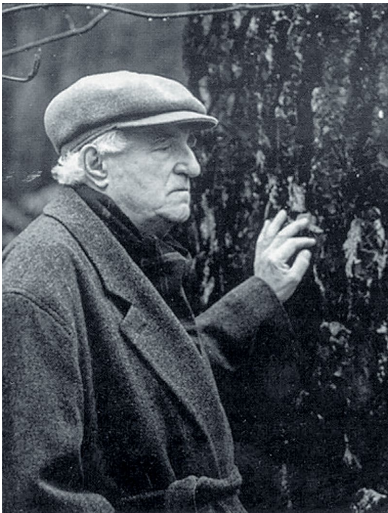
Георгий Васильевич Свиридов

её однообразной, густой чёрной краской... коверкать сознательно, опошлять её гениев — на это способны лишь люди, глубоко равнодушные или открыто враждебные Родине» 6 .