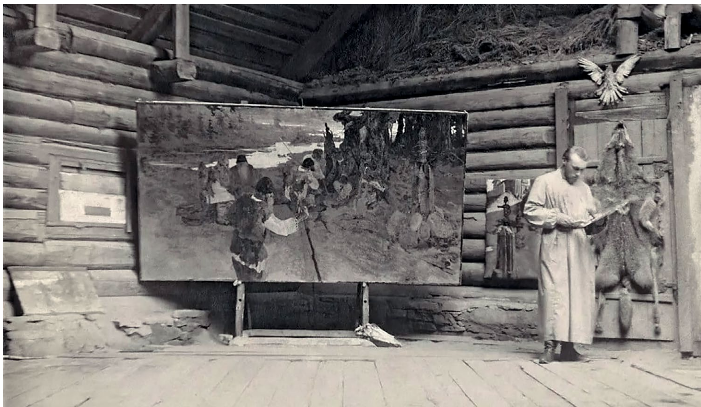
Н.К. Рерих за работой у картины «Сходятся старцы». Извара. 1897 – 1898

Кисти Рериха принадлежит более семи тысяч полотен и эскизов. Расскажем об одной из его ранних работ, ставшей значительной вехой в творчестве художника и имевшей сложную и необычную судьбу. Это картина «Сходятся старцы», которую Николай Константинович написал в 1898 году и впоследствии несколько раз переписывал. Картина была высоко оценена на выставках в Петербурге, Москве, Париже. Некоторое время она с успехом экспонировалась в США. Затем, по вине устроителей и распорядителей североамериканских выставок, картина прошла через аукцион и долгое время считалась утерянной и наконец получила новую жизнь благодаря неравнодушным ценителями творчества Рериха.