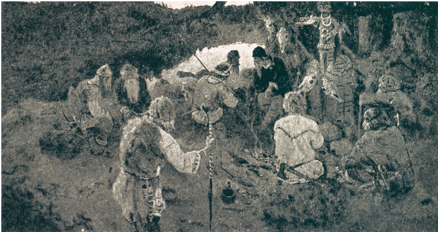
Н.К. Рерих. СХОДЯТСЯ СТАРЦЫ. 1898