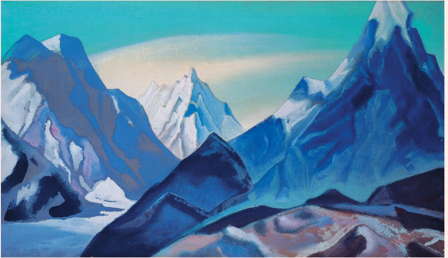
Н.К. Рерих. ГИМАЛАИ. 1945