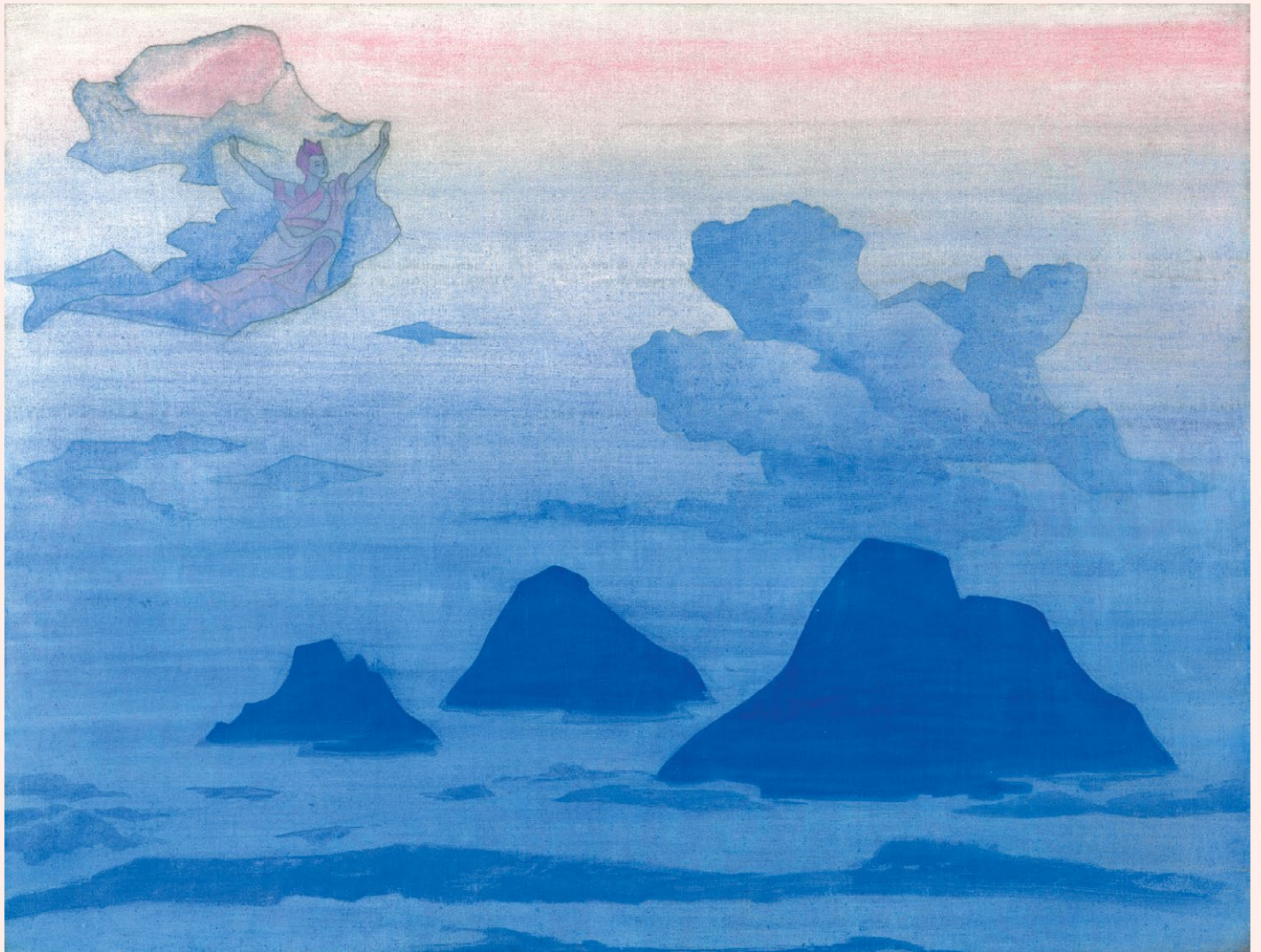
Н.К. Рерих. ПРЕВЫШЕ ГОР. Серия «Его Страна». 1924

Издание Сибирского Рериховского Общества, № 3 (383), Март, 2026