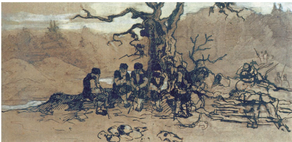
Н.К. Рерих. СХОДЯТСЯ СТАРЦЫ. Рисунок. 1898

Молодой человек пошёл к администратору и спросил, почему картина находилась на складе. Ответ был ещё более поразительным, нежели сама находка: "О, это всего-навсего мусор. Всё это пойдёт завтра утром на городскую свалку". Конечно, наш молодой друг пришёл в ужас и немедленно спросил, не может ли он каким-то