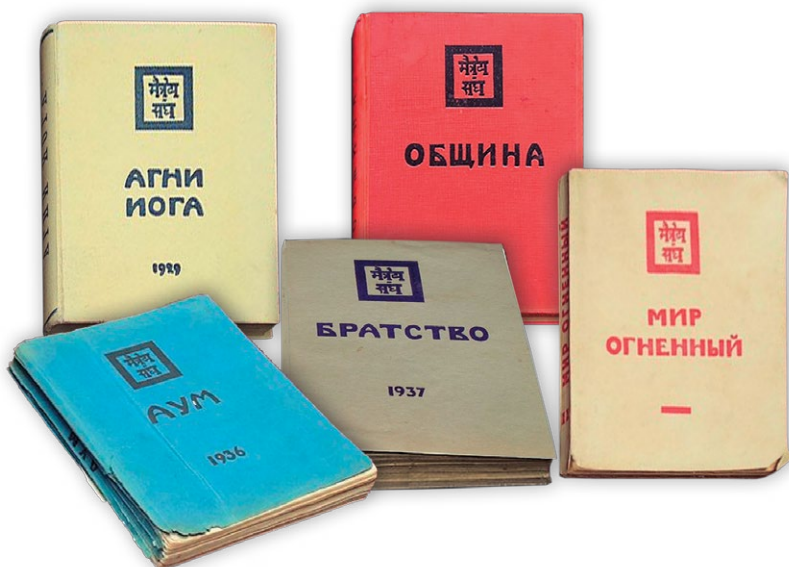
Книги Учения Живой Этики (издание 1920 – 1930-х гг.)

«Кто-то пишет о своей мечте о полном единении среди сотрудников, конечно, всем сердцем присоединяюсь к нему. Но как достигнуть этого единения? Ответ всегда один — углублением в Учение и применением его в жизни, другого пути нет» 7 .