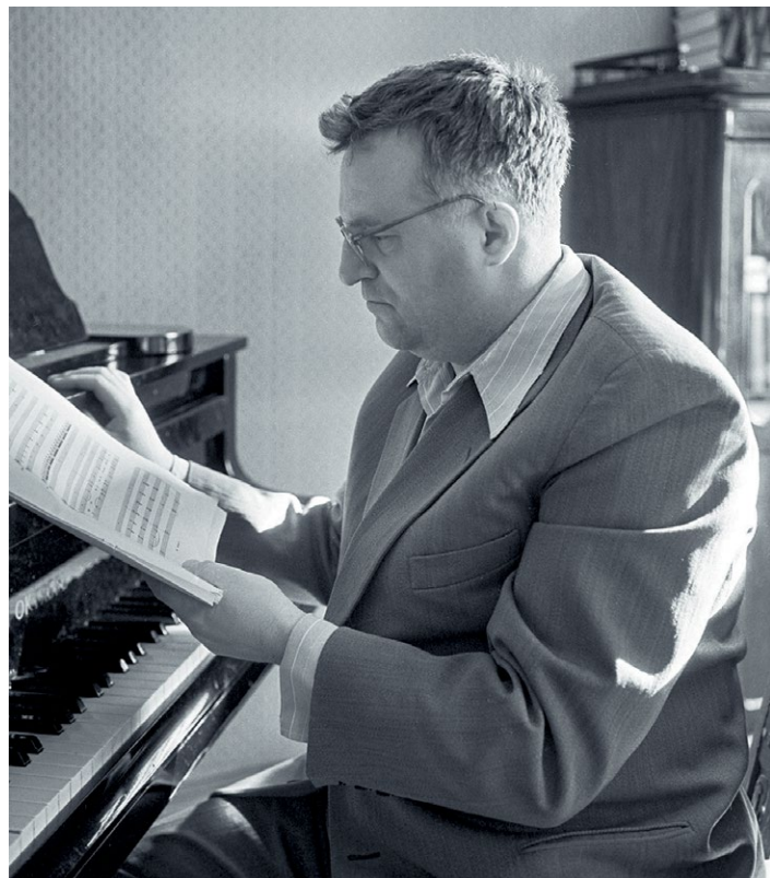
Г.В. Свиридов. 1960

Свиридов очень отрицательно относился к так называемой массовой музыкальной продукции — примитивной, зачастую грубой, ничего не дающей человеческой душе и даже вредящей.