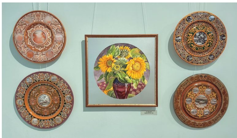
А.П. Веселёв. «Подсолнухи» (2005) и декоративные тарелки

Нина Тимофеевна — автор уникального стиля росписи по дереву и металлу, который получил высокую оценку профессионалов.