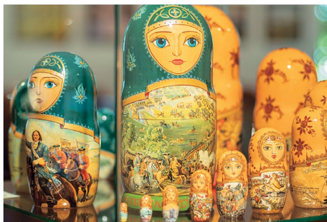
Н.Т. Черникова. Матрёшки