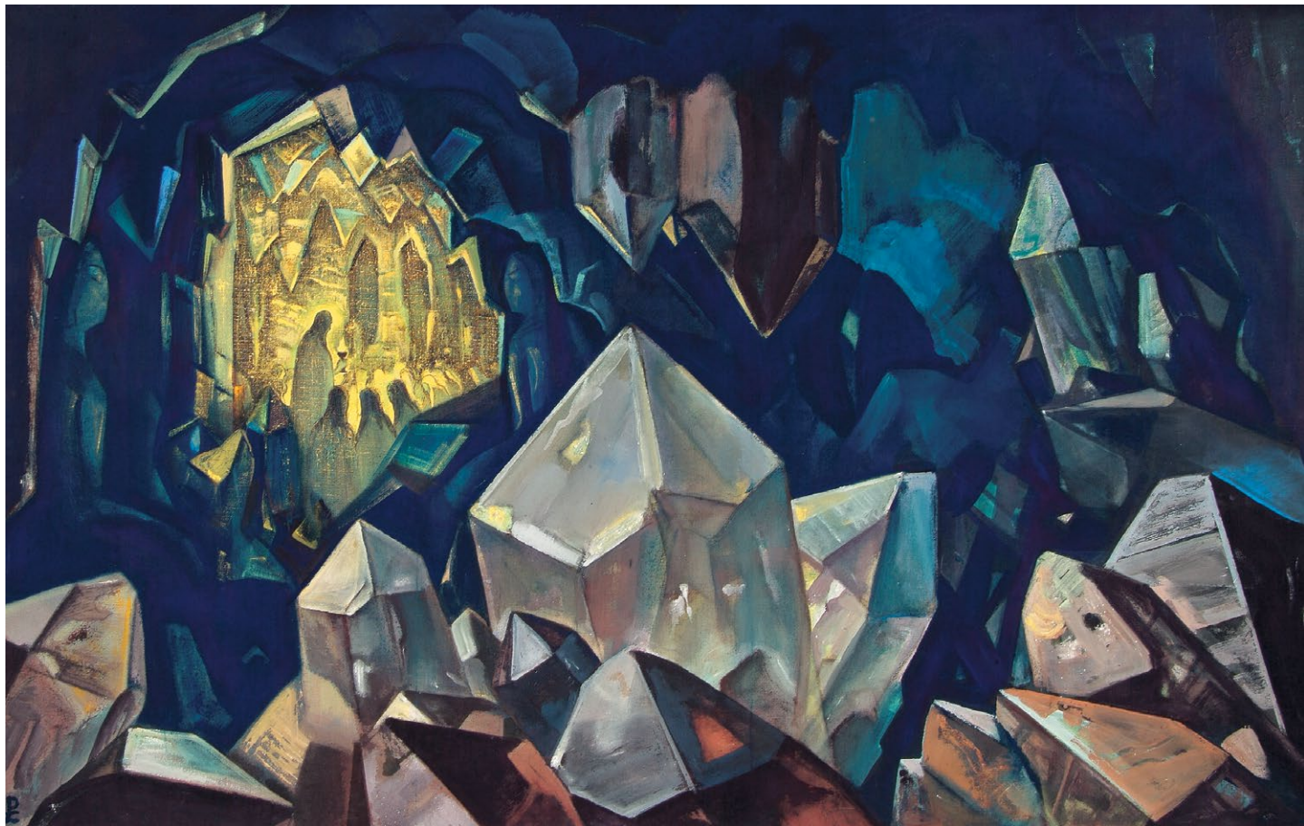
Н.К. Рерих. СОКРОВИЩЕ ГОРЫ. 1933

Не вы, но Я Вижу победу, не вы, но Я Знаю будущее и, зная о нём, Свидетельствую о непреложности суждённого Цикла. Как ночь сменяется днём, зима — весной, смерть — новым рождением, так и Цикл сменяется Циклом, неся с собою условия новые и новые формы жизни. Незыблемость Законов Космических служит основанием непреложности Знания Нашего. В понимании исторического процесса развития человечества применяются Нами меры больших сроков, от них зависят и малые. Звёзды рисуют узоры Лучей на поверхности планеты, и по этим узорам, или узлам сгущённого звёздного Света, располагаются центры цивилизаций и очаги культуры. Они, эти центры, смещаясь, двигаются по лицу Земли, изменяя карту мира исторически, географически и геологически. Когда Говорим о жребии лучшем, данном лучшей Стране, Знаем непреложность космических начертаний, то есть того, что предназначено мощью звёздных Лучей. Даже на протяжении известных человечеству тысячелетий центры культуры постоянно менялись. И ныне центр звёздных воздействий с особою