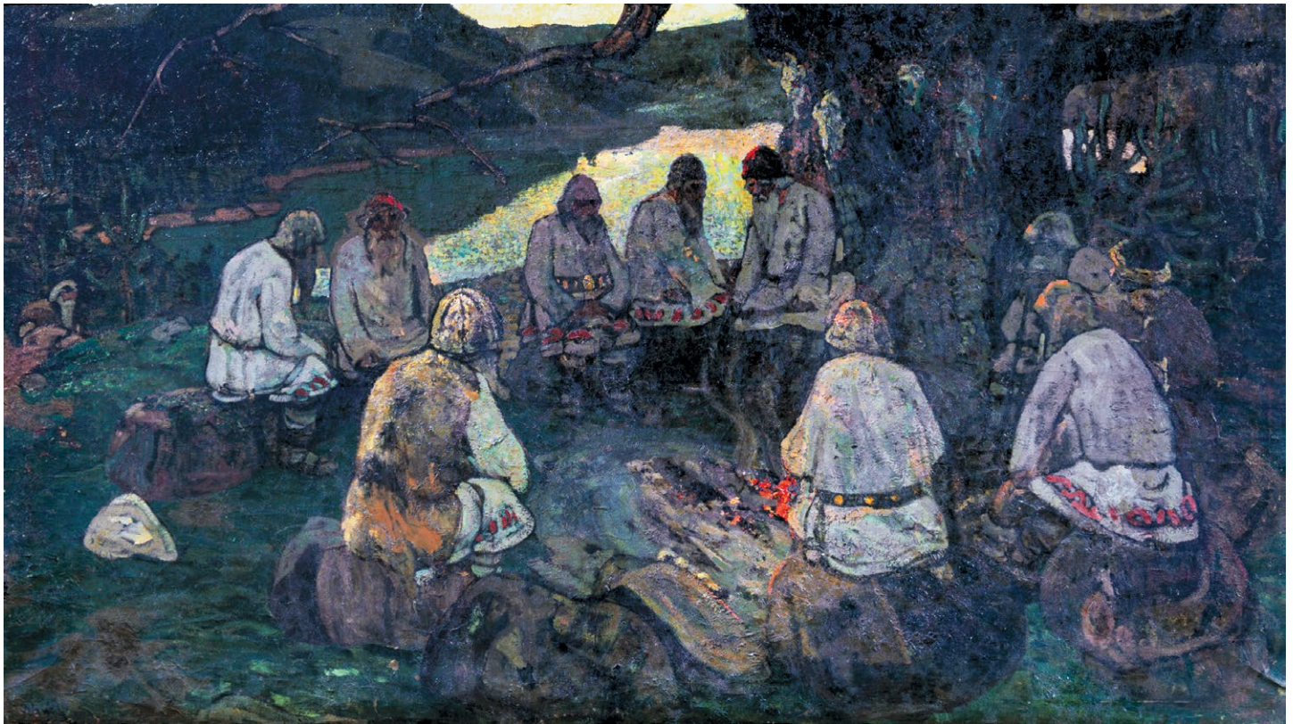
Н.К. Рерих. СХОДЯТСЯ СТАРЦЫ. 1898 – 1902