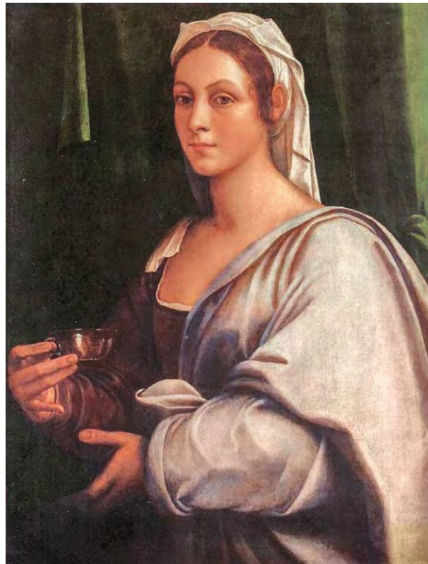
Себастьяно дель Пьомбо ВИТТОРИЯ КОЛОННА. 1530-е гг.

Римская инквизиция осудила на казнь Пьетро Карнесекки (в 1567 г.), а во время следствия его