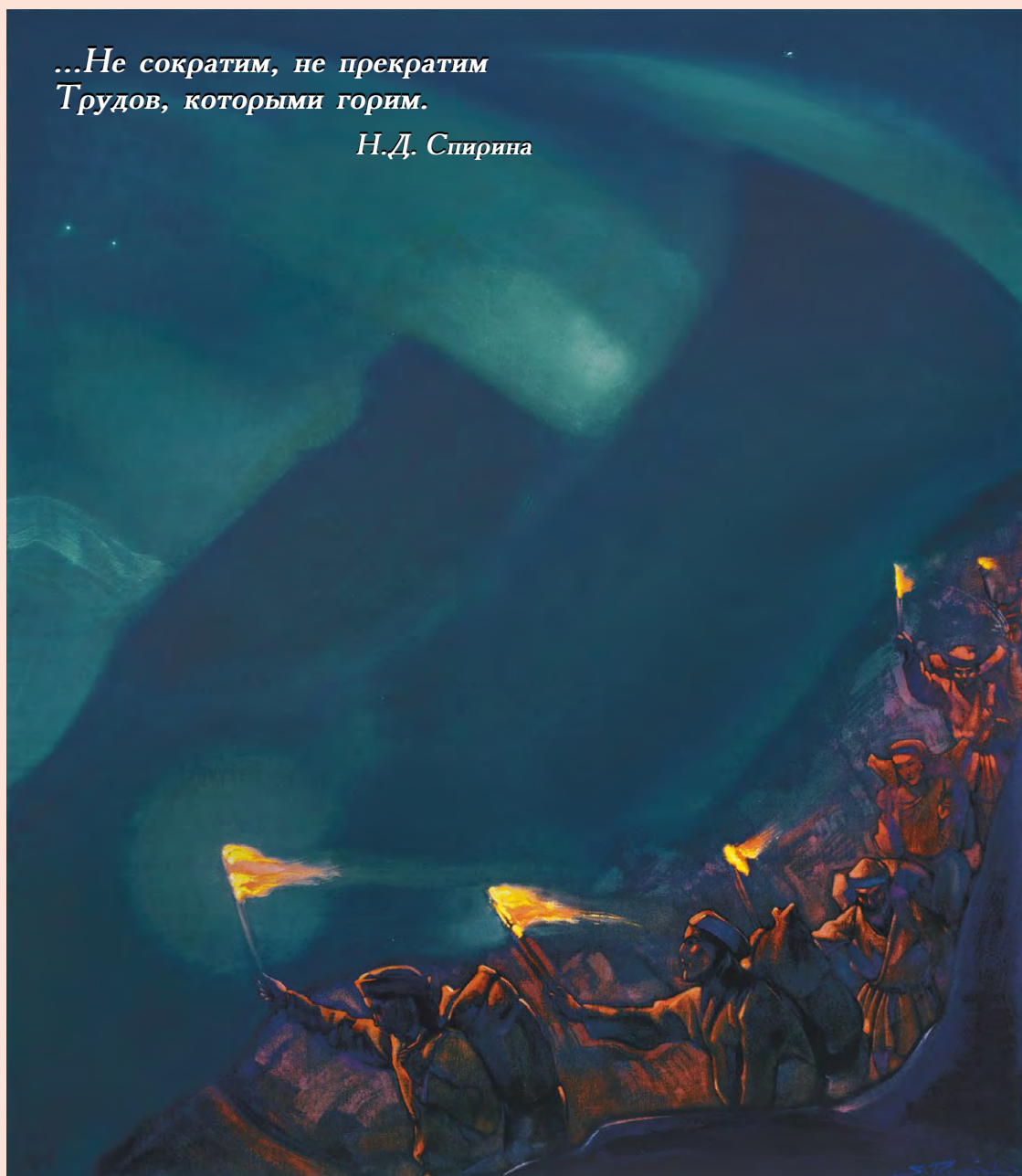
С.Н. Рерих. ОГНИ ТРУДОВ. 1939