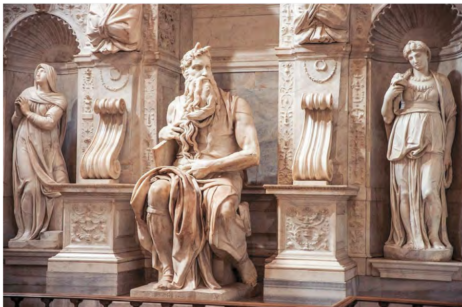
Микеланджело. Скульптурная композиция гробницы папы Юлия II Церковь Святого Петра в Риме. XVI в.

«Оплакивание Христа» (1538): Мадонна сидит у подножия креста, залитое слезами лицо её выражает невыносимое страдание, распостёртые руки воздеты к небу. Безжизненное тело Христа, кажется, вот-вот рухнет к ногам Пресвятой Матери, но два ангела подхватывают его.