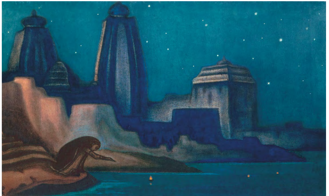
Н.К. Рерих. ОГНИ НА ГАНГЕ. 1947

Невозможно чем-либо насильственным или противоестественным развить в себе эту чуткость. Лишь веками, в великом ритме, в постоянном мышлении