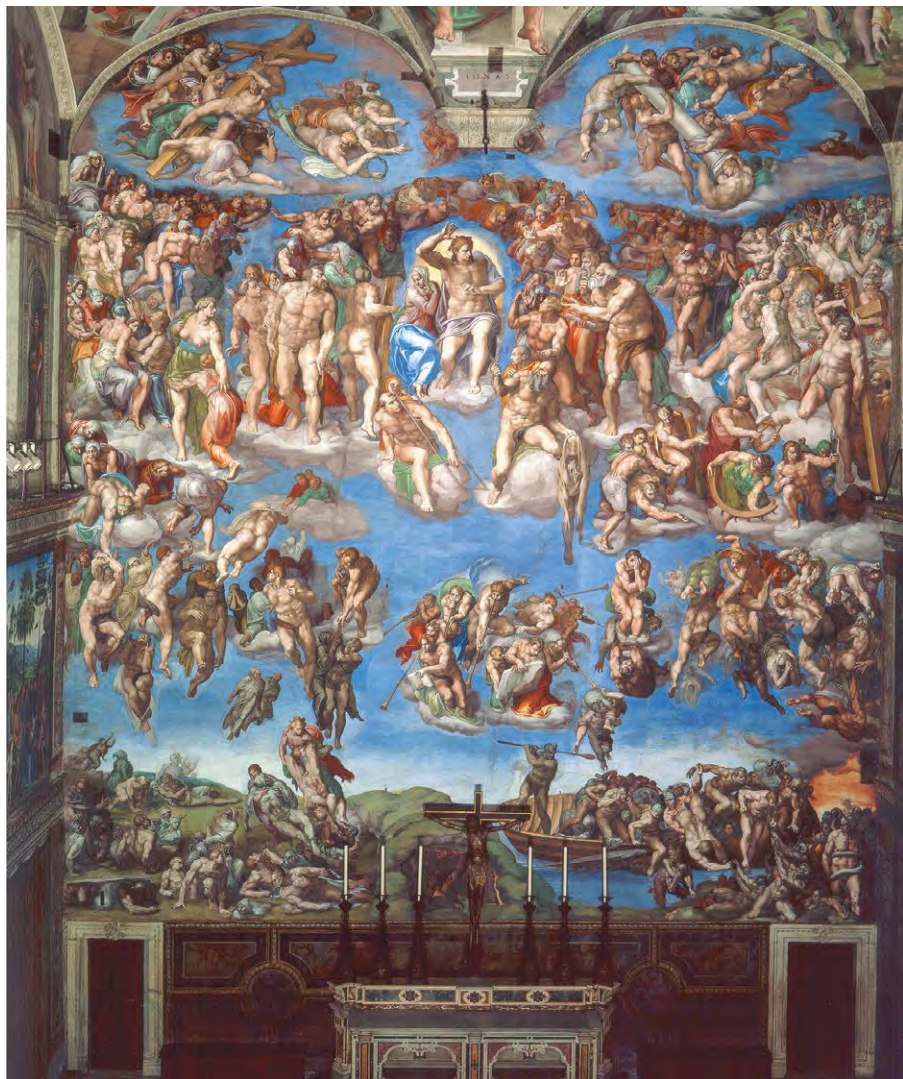
Микеланджело. СТРАШНЫЙ СУД. Фреска в Сикстинской капелле