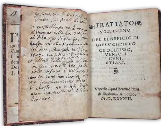
Благодения Христа. Издание 1543 г.

две версии относительно её изображения. Ясно одно: Микеланджело не мог не отобразить её на этой фреске. Где именно она изображена или изображена дважды — остаётся вопросом.