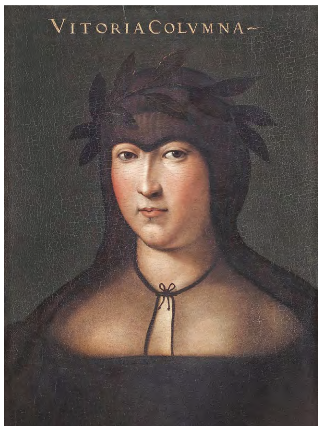
Кристофано дель Альтиссимо ВИТТОРИЯ КОЛОННА. До 1568 г.

Неудивительно, что, когда император Карл V прибыл в Рим в апреле 1536 года (через 11 лет после смерти маркиза), он удостоил Витторию личным