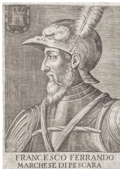
ФЕРНАНДО Д'АВАЛОС МАРКИЗ ПЕСКАРЫ. Гравюра. XVII в.

Приют мой одинокий прост и строг: Живу, как птица, на утёсе голом, К возлюбленным сердцам, к ветвям весёлым Не возвращаться я дала зарок.