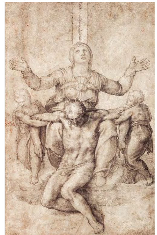
ОПЛАКИВАНИЕ ХРИСТА Рисунок Микеланджело. 1540

В 1541 году Виттория уехала в Витербо — небольшой городок к северо-западу от Рима. Её отъезд