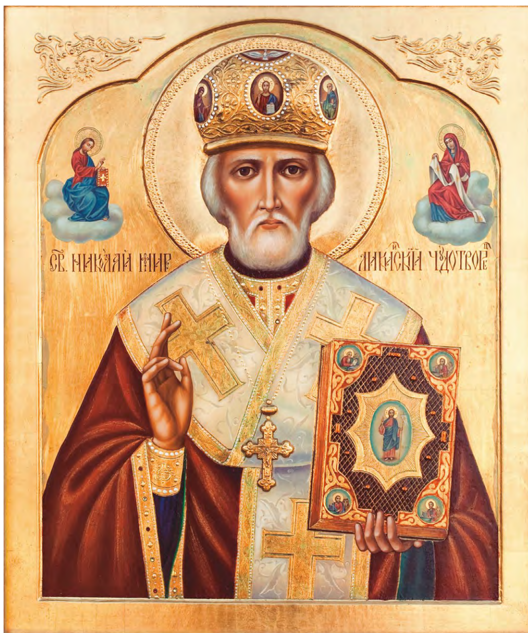
СВЯТОЙ НИКОЛАЙ МИРЛИКИЙСКИЙ ЧУДОТВОРЕЦ

19 декабря — день Святого Николая Чудотворца