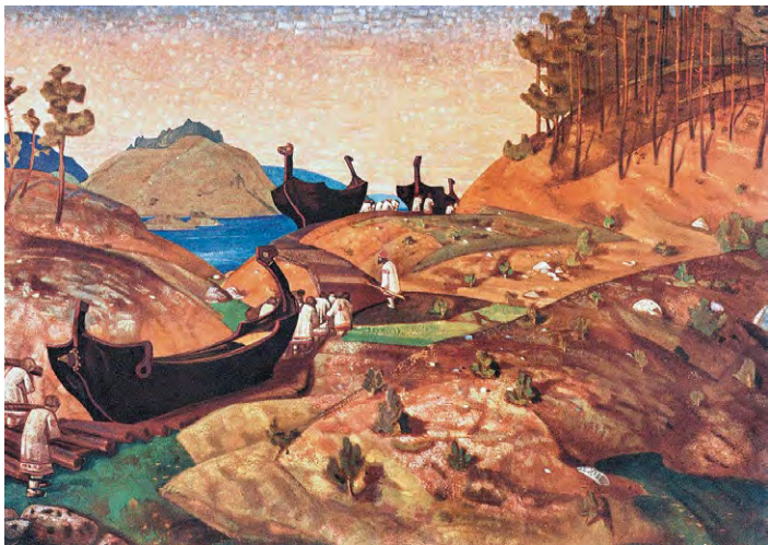
Н.К. Рерих. ВОЛОКУТ ВОЛОКОМ. 1915

Н.К. Рерих любил историю своего Отечества и изучал её не только по книгам, летописям и сказаниям, но и по предметам древности, добытым