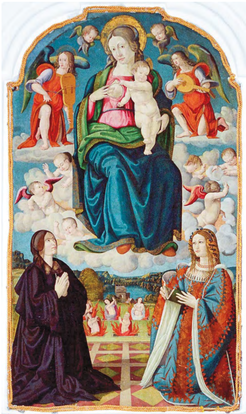
Алтарная фреска в монастыре Сан-Антонио на острове Искья Предстоящие: Констанца д'Авалос и Виттория Колонна

Приведём интересный факт, говорящий о высоких моральных принципах Виттории. Во время борьбы с французами возник заговор против императора. И маркизу Пескары предложили корону Неаполя, склоняя к измене императору под самым благородным предлогом — «для освобождения Италии от французов». Маркиз взял паузу на размышление