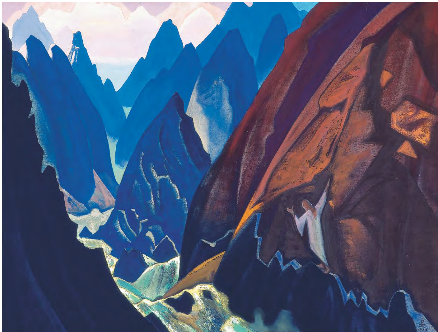
Н.К. Рерих. ПУТЬ. 1936