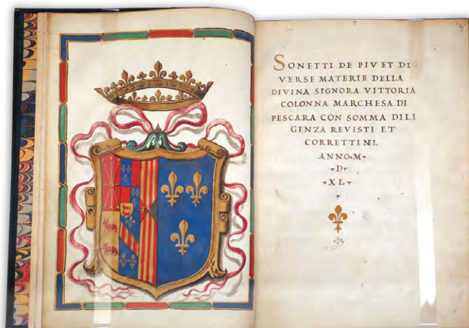
Виттория Колонна. Сонеты. Издание 1540 г.

Она собралась уйти в монастырь, но её отговорил папа Климент VII, разрешив жить в монастыре без пострига. Отныне она — светская монахиня.