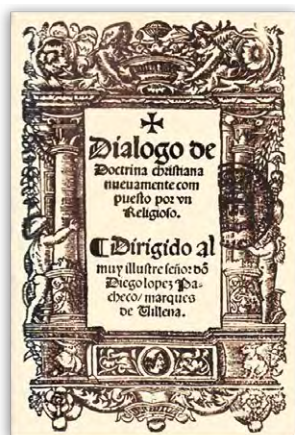
Хуан де Вальдес. «Диалог о христианской доктрине». 1529 г.

Один из главных последователей Вальдеса монах-капуцин Окино стал успешно проповедовать