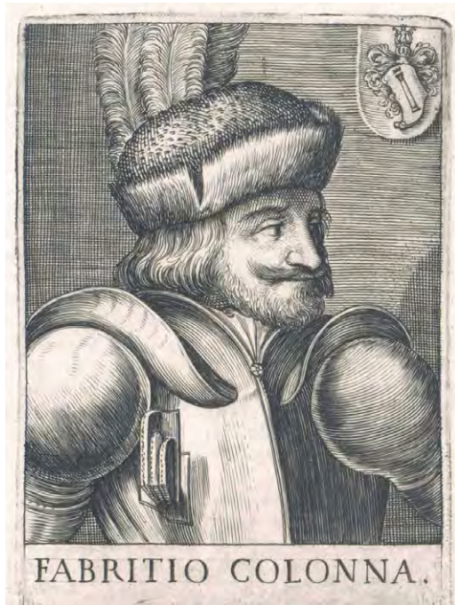
ФАБРИЦИО КОЛОННА. Гравюра. XVI в.

Уже в XX веке в архивах Ватикана была обнаружена ранее неизвестная рукопись, принадлежавшая