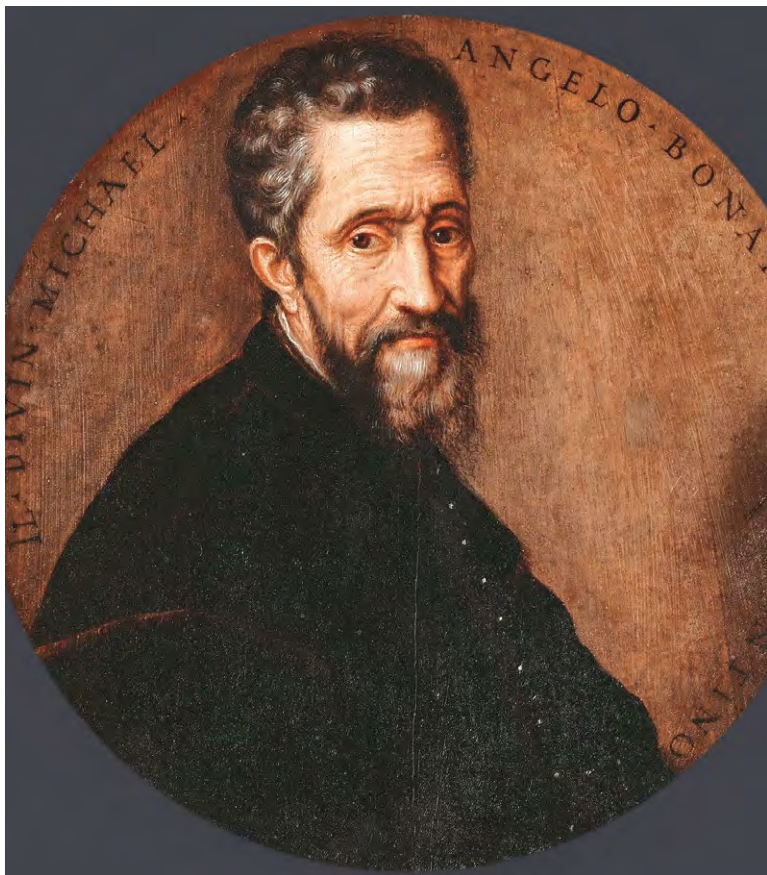
Франс Флорис Старший. ПОРТРЕТ МИКЕЛАНДЖЕЛО Около 1550 г.

Среди гигантов Италии, давшей миру Рафаэля, Леонардо да Винчи, Тициана, Боттичелли, Джорджоне