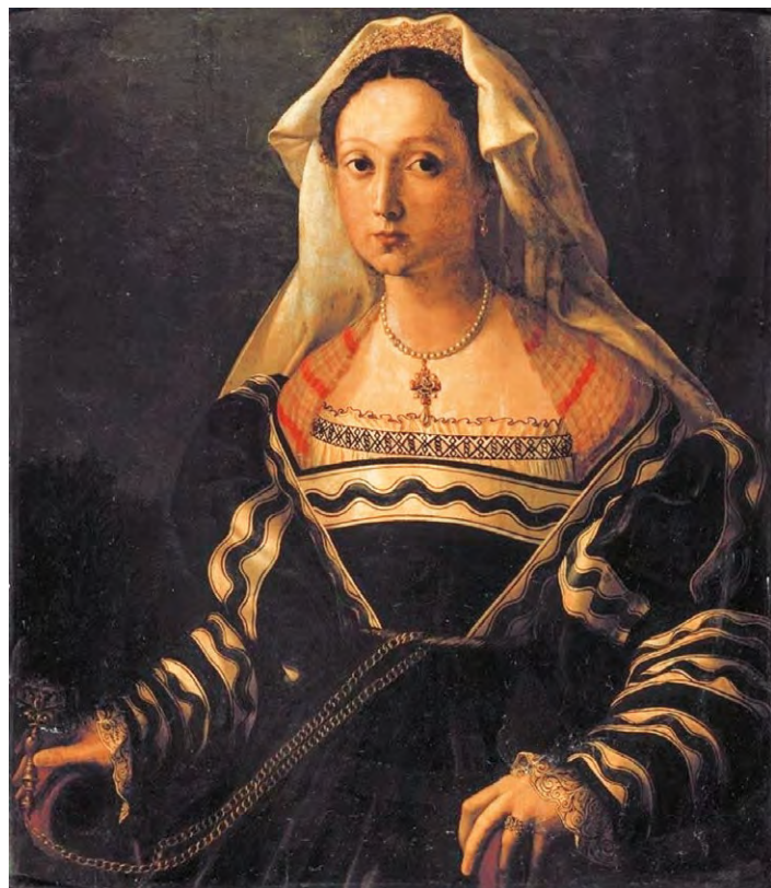
Флорентийская школа. ПОРТРЕТ ВИТТОРИИ КОЛОННА XVI в.

Обширные познания, высочайшие нравственные качества и признанный поэтический талант прославили её в самых образованных кругах Рима, Неаполя и Венеции. Сочинения Виттории — сонеты, посвя-