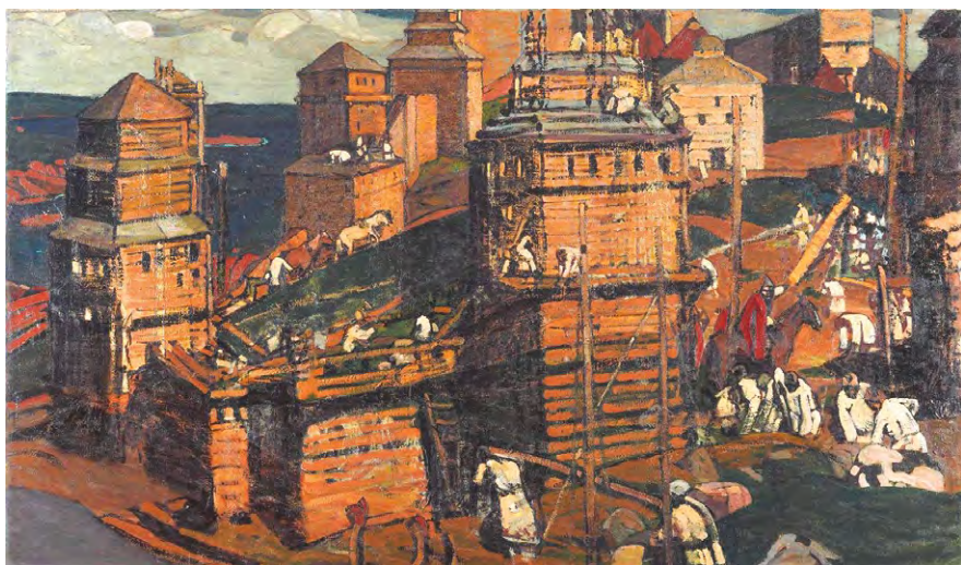
Н.К. Рерих. ГОРОД СТРОЯТ. 1902

Елена Ивановна Рерих предрекала нашей Родине великое будущее. Она писала: «Очищенная и возрождённая на новых началах широкого народного сотрудничества и свободного культурного строи-