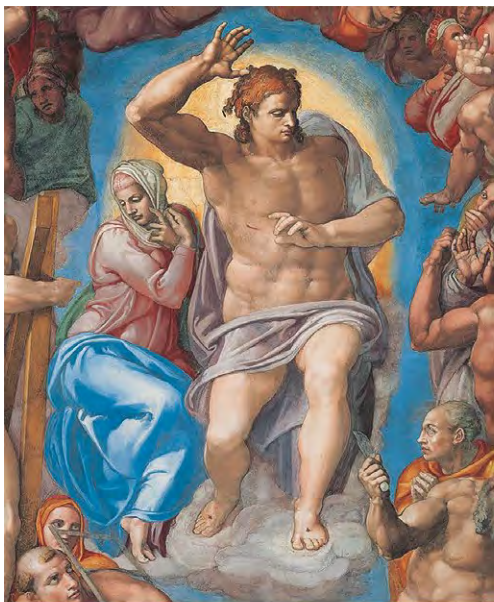
Микеланджело. СТРАШНЫЙ СУД Фрагмент фрески

никак не сказался на их отношениях с Микеланджело. Они продолжали посещать друг друга и переписываться, как прежде. Биографы отмечают: «Переписка этих двух замечательных людей представляет не только высокий биографический интерес, но является прекрасным памятником исторической эпохи и редким примером живого обмена мыслей, полных ума, тонкой наблюдательности и иронии».