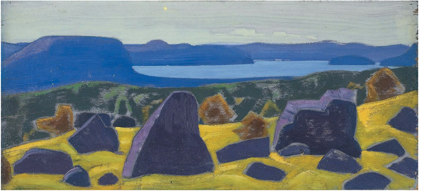
Н.К. Рерих. Этюд из серии «Ладога». 1918