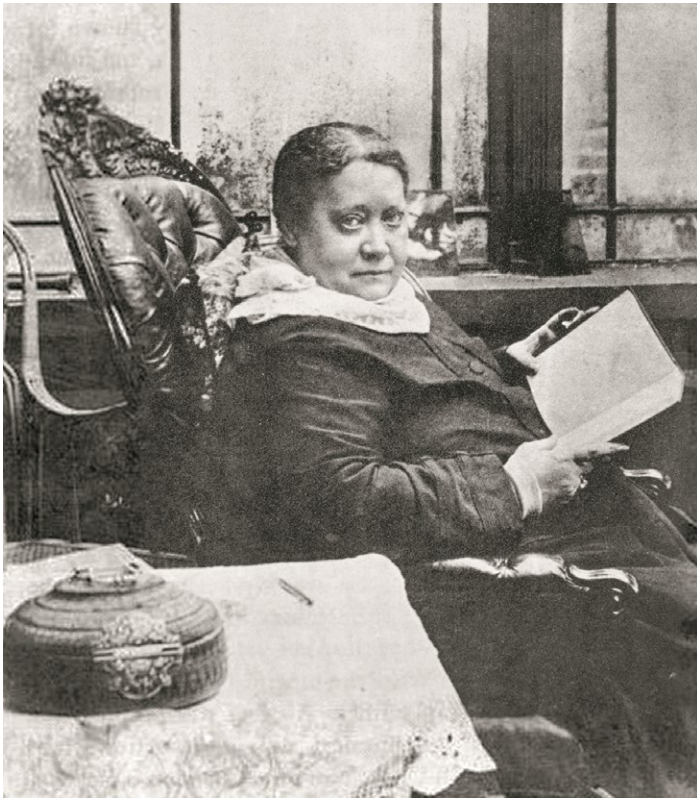
Елена Петровна Блаватская. 1887

Это чувство её силы нисколько не давило и не унижало слабых, это было впечатление глубины и такого размера души, который охватывает всякую суть до самого первоисточника.