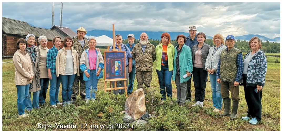
Верх-Уймон. 12 августа 2023 г.

Предательство, клевета, поношение сопутствовали этому великому духу, взявшему на себя тяжкую ношу — расширение горизонтов сознания современного человечества. "Нельзя представить,