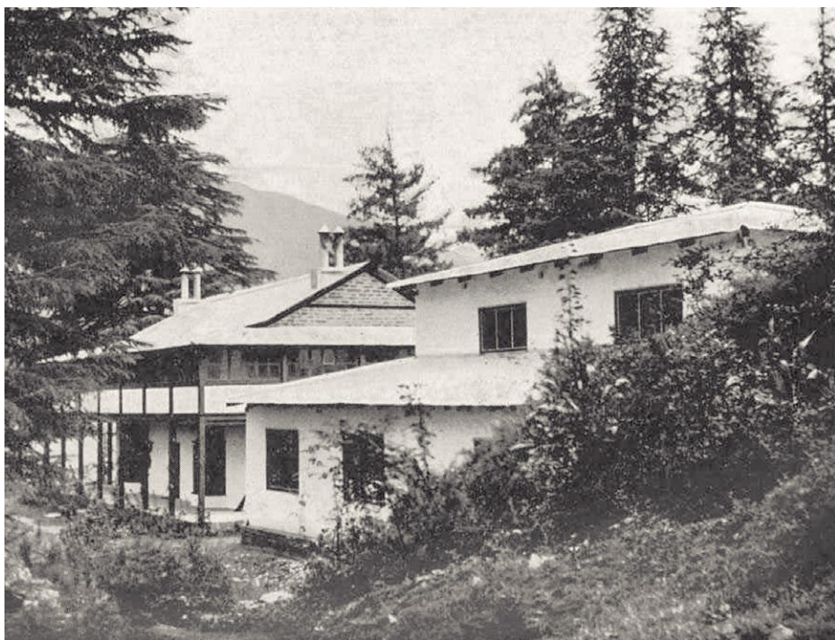
Институт Гималайских исследований «Урусвати». Наггар, Индия. 1930-е гг.

Этот вдохновенный проект, возглавляемый основателем «Урусвати» профессором Николаем Рерихом и д-ром Юрием Рерихом, директором