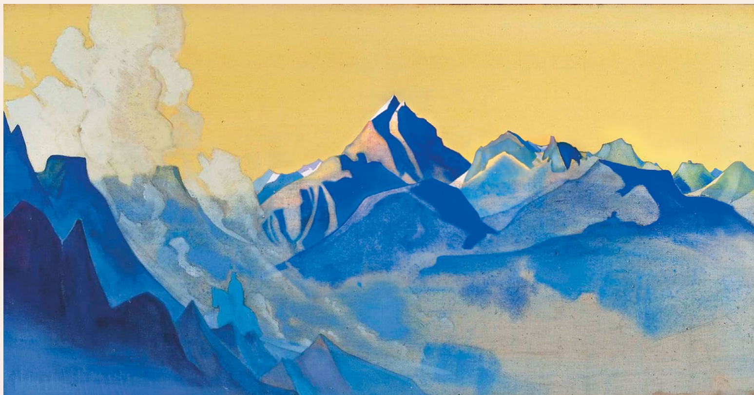
Н.К. Рерих. ПО ЕРГОРУ ЕДЕТ ВСАДНИК. 1927

Издание Сибирского Рериховского Общества, № 8 (352), Август, 2023