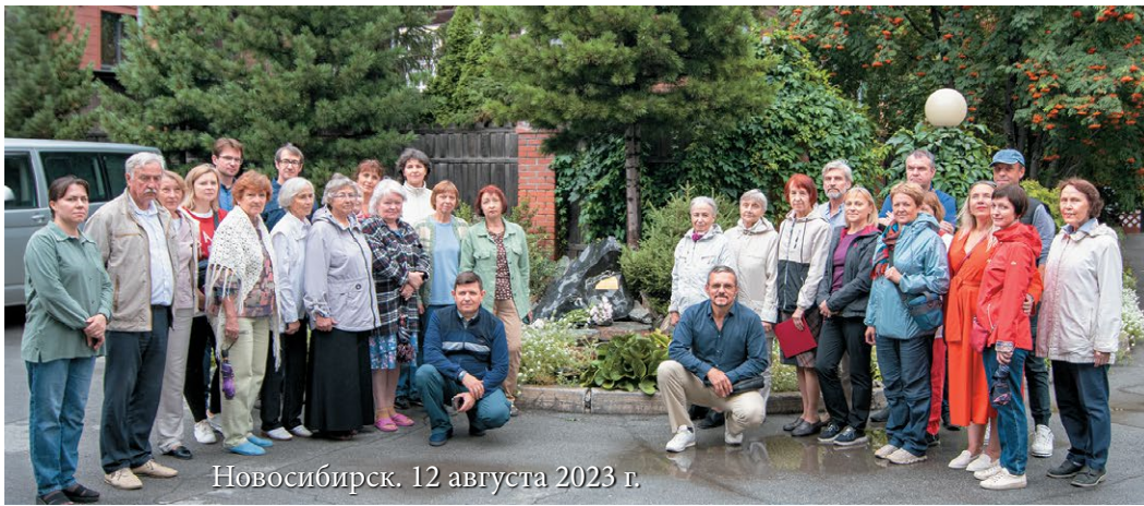
Новосибирск. 12 августа 2023 г.

как невероятно трудно было давать, встречая натиск отпора, тупого и злобного сопротивления. (...) Не могли понять, что не новое приносила, но очищала и давала основы знания, не старого и не нового, но вечно даваемого и вечно искажаемого. Младенчество науки и дряхлая затхлость церкви, медиумизм и магия, невежество и суеверия встречали её на пути приношения. Как лев шла, разбивая грудью удары сопротивления. Дух был несломим, но тело не выдер-