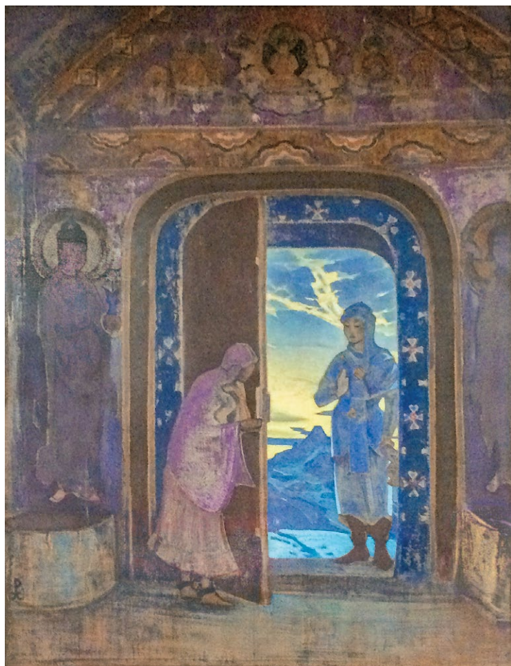
Н.К. Рерих. ВЕСТНИК. 1924

«...Единственная миссия [Теософского Общества] — вновь зажечь факел истины, столь надолго погасший для всех, кроме очень немногих, и сохранять сию истину живую посредством создания