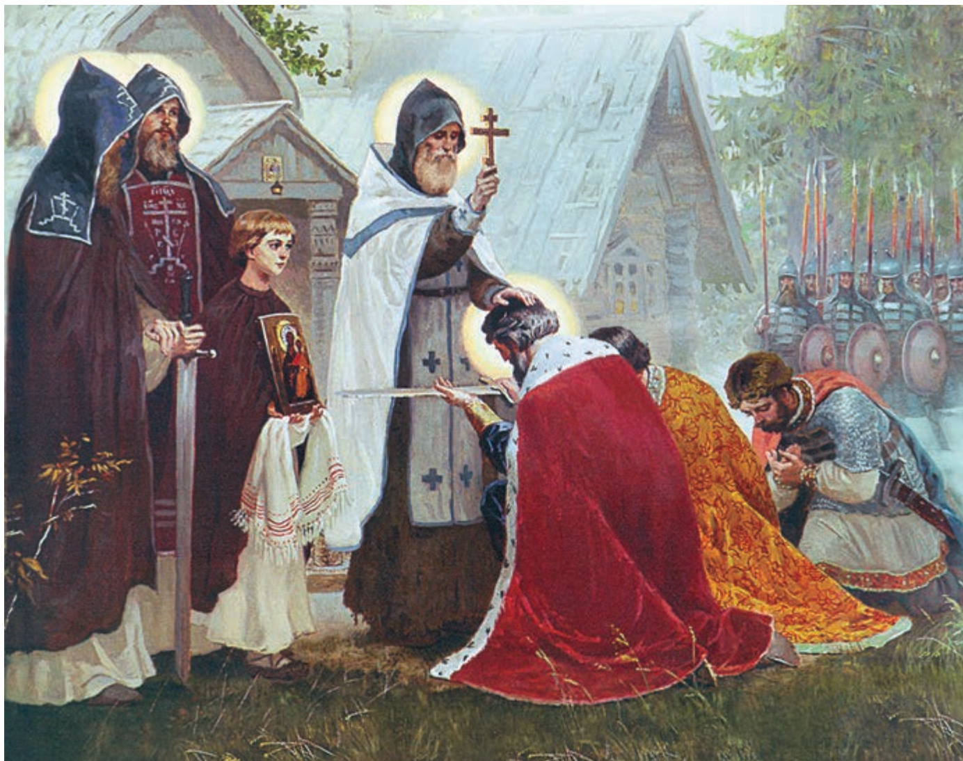
С.Н. Ефошкин. ПРЕПОДОБНЫЙ СЕРГИЙ БЛАГОСЛОВЛЯЕТ КНЯЗЯ ДМИТРИЯ НА КУЛИКОВСКУЮ БИТВУ

Всегда помните и знайте, что там, где не слушают Христа и основанной им Церкви, там воцаряется дьявол; там, где искореняют пшеницу, вырастают плевелы. Итак, с Богом, за работу. Аминь!"