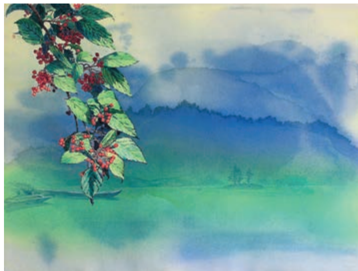
Куо Мин-фу. ИДЕЗИЯ ВБЛИЗИ ОЗЕРА. 1996

Отдельно хочется сказать о технике. Точность мельчайших деталей, но при этом — ощущение живости