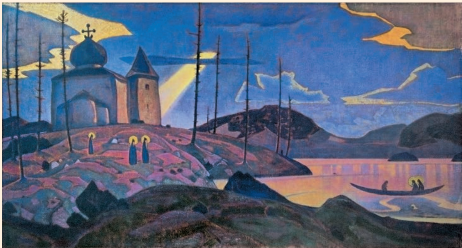
Н.К. Рерих. СВЯТЫЕ ГОСТИ. 1923

Издание Сибирского Рериховского Общества, № 7 (243), Июль, 2014