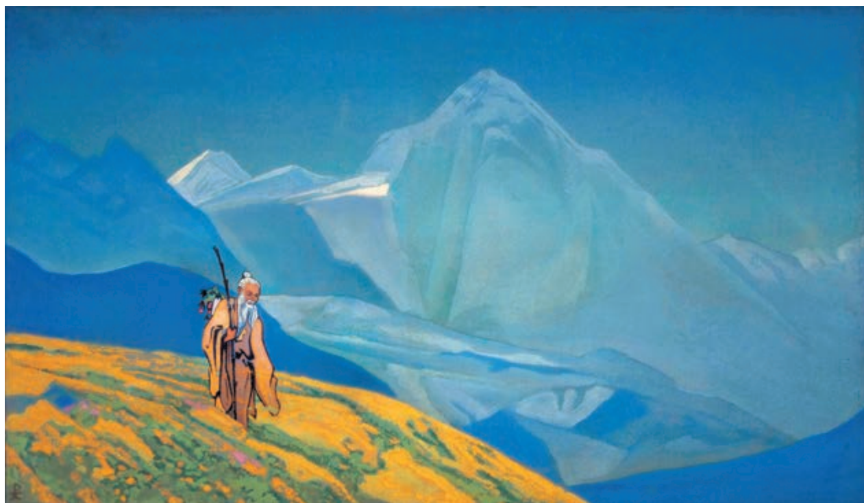
Н.К. Рерих. ГУРУ ЧАРАКА. 1932

Из секретий желёз животных особое место занимает мускус, содержащий большое количество психической энергии. Очень полезно сочетание его с валерианом, имеющим растительную психическую энергию, и содой.