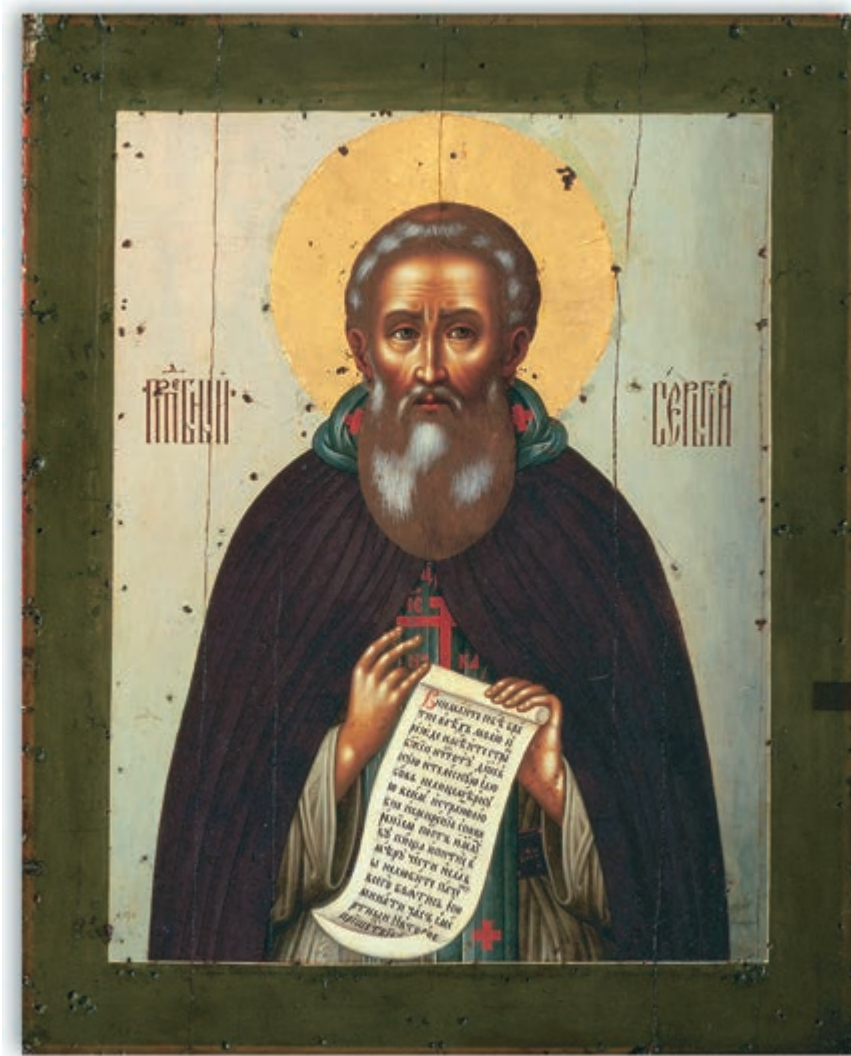
С. Ушаков. ПРЕПОДОБНЫЙ СЕРГИЙ РАДОНЕЖСКИЙ. 1669

родины стоит самый мощный Покровитель, именно её Строитель и Воспитатель духа народа Преподобный Сергий Радонежский. Семена, заложенные Им, не умерли и живут в глубинах народной. В суждённые сроки они взойдут чудесными ростками. Вот и Троицко-Сергиевская Лавра уже восстанавливается, и народу напоминают о чудесной защите родины её Основателем против татар и поляков. Примечательно и то, что, видимо, никто не смущается тем обстоятельством, что помощь против поляков проявлена была Преподобным уже в тонком теле. Всё это вехи, которые даются, чтобы понять грядущее великое время.