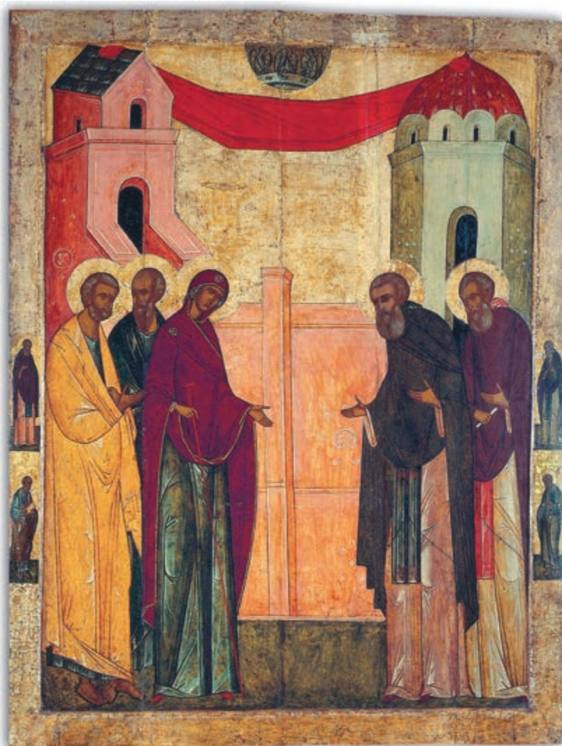
ЯВЛЕНИЕ БОГОМАТЕРИ СЕРГИЮ РАДОНЕЖСКОМУ. XVI в.

Не тревожьтесь чрезмерно, родные, но вооружитесь мужеством и храните спокойствие, близкие будут охранены. Атмосфера вокруг Земли настолько тяжка, что необходимо какое-то разряжение и уже космическое очищение, может быть, оно уявится в лучах приближающихся новых пространственных тел? Многие тела невидимы даже в самые сильные телескопы, но лучи их могут воздействовать на атмосферу и на недра Земли, так же как и на её обитателей. Ведь пространственные токи — самые мощные рычаги всяких воздействий и преобразований, прежде всего человеческих настроений. Именно на них, на эти токи, так мало обращают внимания и только сейчас начали изучать космический луч, но со стороны физической, тогда как всё следует изучать прежде всего со стороны психической. Ибо Мир Психический ведёт мир физический, а не наоборот. Когда наука вступит на широкий путь