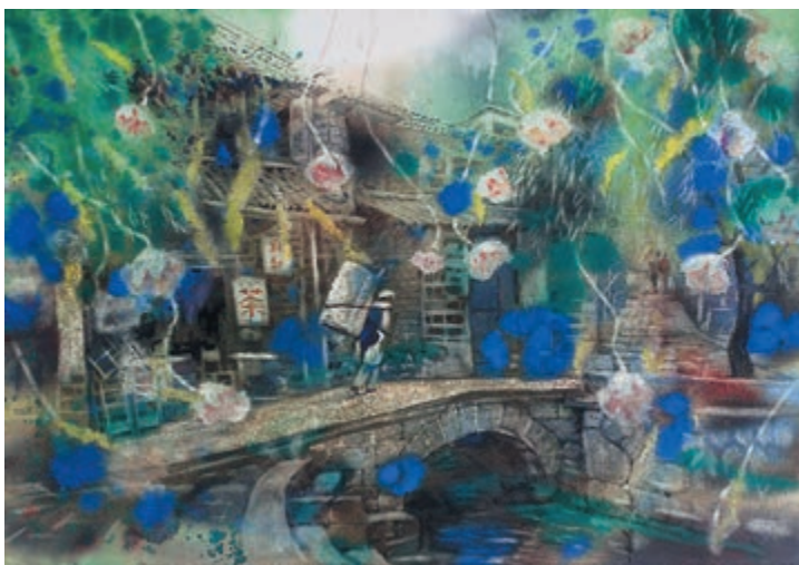
Куо Мин-фу. ВЕСЕННЕЕ ЦВЕТЕНИЕ. 2001

Первые отклики посетителей появились в Книге отзывов сразу же после открытия выставки. Вот некоторые из них: