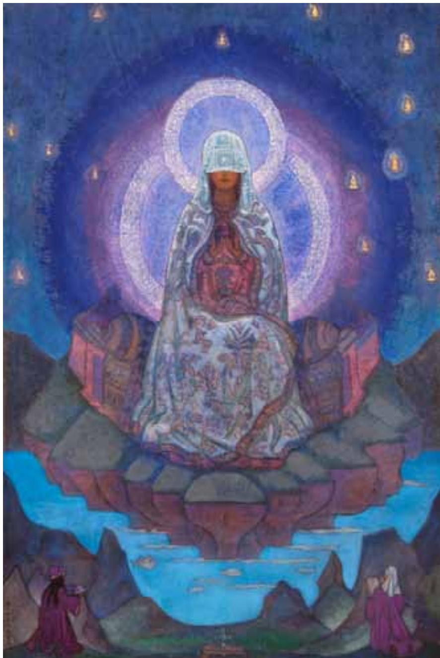
Н.К. Рерих. МАТЕРЬ МИРА. 1924

ность тяготения мысли Мы даём» 10 . Разве это далеко от жизни? Разве это нам недоступно? «Человеческое сознание направить можно к управлению неуправляемыми и бессознательными мыслями» 11 .