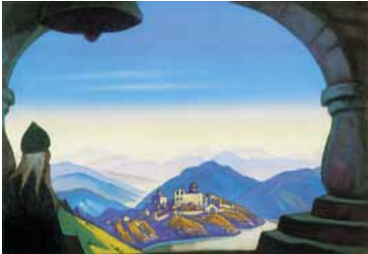
Н.К. Рерих. ЗЕМЛЯ СЛАВЯНСКАЯ. 1943

будет открыто окно в Миры Надземные и в жизнь бессмертную» 68 .