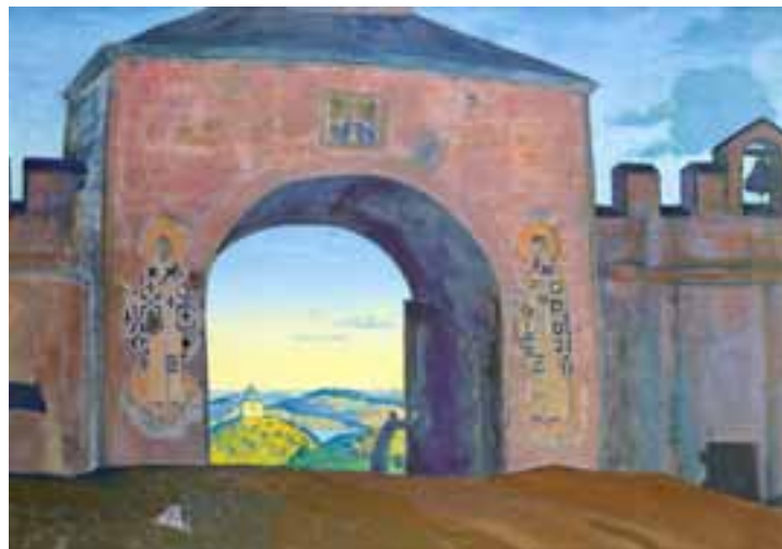
Н.К. Рерих. И МЫ ОТКРЫВАЕМ ВРАТА. 1924

«Всё, могущее восходить, всё, приемлющее эволюцию, призывается под Знамена Майтрейи. Как бы всеобщая мобилизация духов для создания будущей расы. Первые откликнувшиеся пойдут впереди. И сколько их, заскоружлых духом, но не угасивших огня, уже примкнуло ко Мне. И Я Принял их, таких тёмных и несовершенных, но отдавших все силы свои на строительство Нового Мира. Принял разбойника, Принял блудницу, Принял и их, заскоружлых, Приму и вас, отягчённых несовершенствами вашими, если придёте ко Мне, чтобы путь совершать вместе. И вы, уже идущие со Мною, несовершенны и вы, но и вы не смущайтесь и не допускайте, чтобы смущение ваше остановило вас, пресекло путь и ввергло во тьму, не смущайтесь, если чувствуете, что неизжитое ещё пока в духе тяжко давит на сознание ваше. Вам Говорю: не смущайтесь, ибо Я с вами и вас не оставлю, пока вы не оставите Меня» 33 .