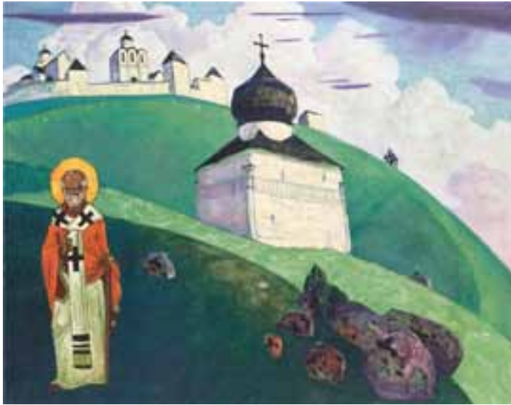
Н.К. Рерих. СВЯТОЙ НИКОЛА. 1916