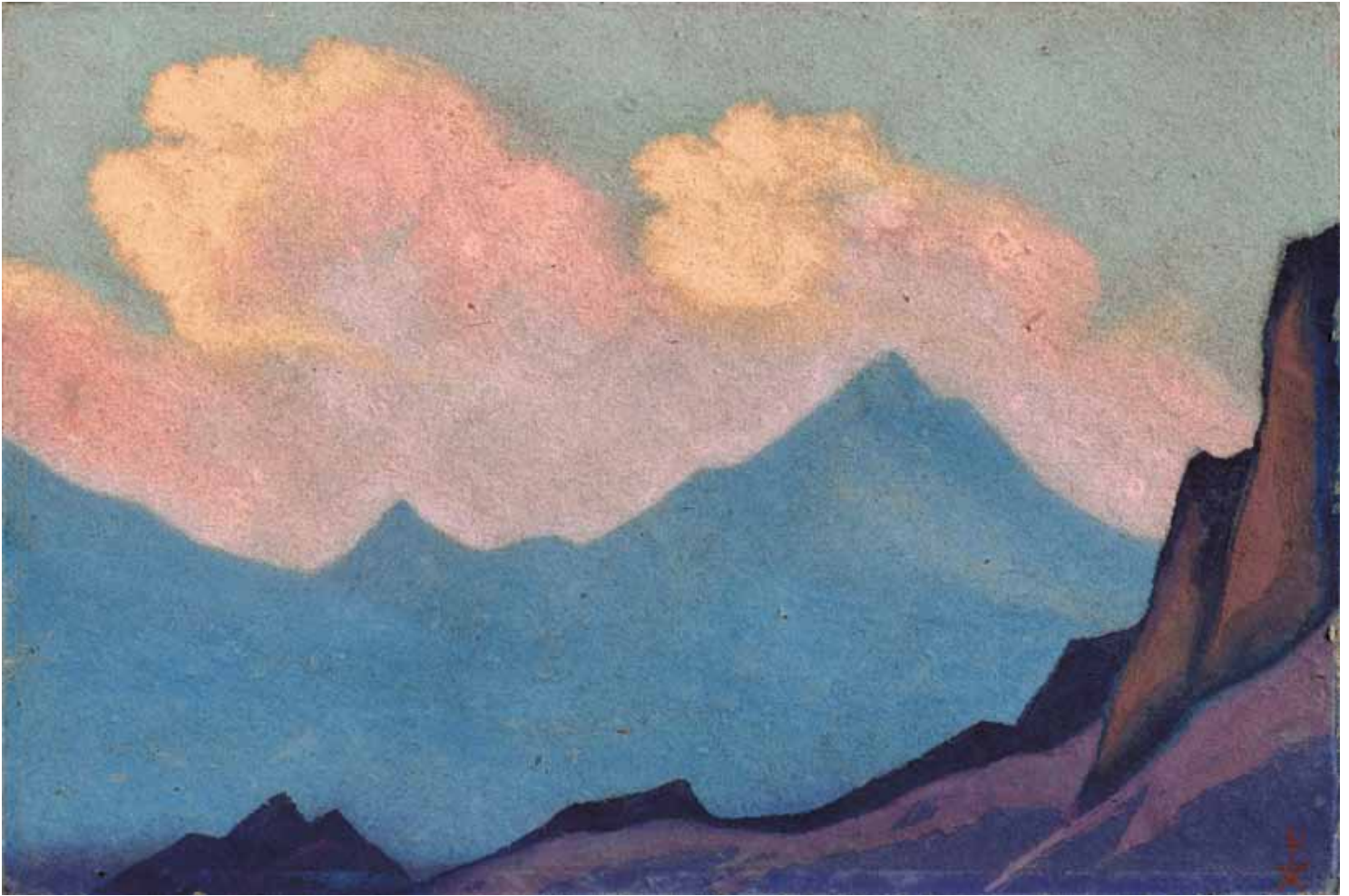
Н.К. Рерих. ГИМАЛАИ. 1944

Никто не может утверждать, что Рерих в своих символических изображениях абстрактен. Напротив, в его картинах отражаются многообразные идеи и темы, психологически и философски завершённые образы прошлого, видения будущего. В его работах ощутимо само дыхание живой жизни. В искусстве Рериха, можно сказать, отображается великая Реальность Космоса. (...)