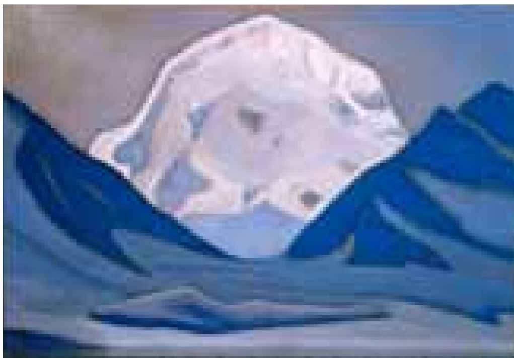
Н.К. Рерих. КАЙЛАС. 1946

Если бы кто-нибудь задался целью исторически проследить всемирное устремление к Гималаям, то получилось бы необыкновенно знаменательное исследование. (...) Даже в тёмные времена средневеко-