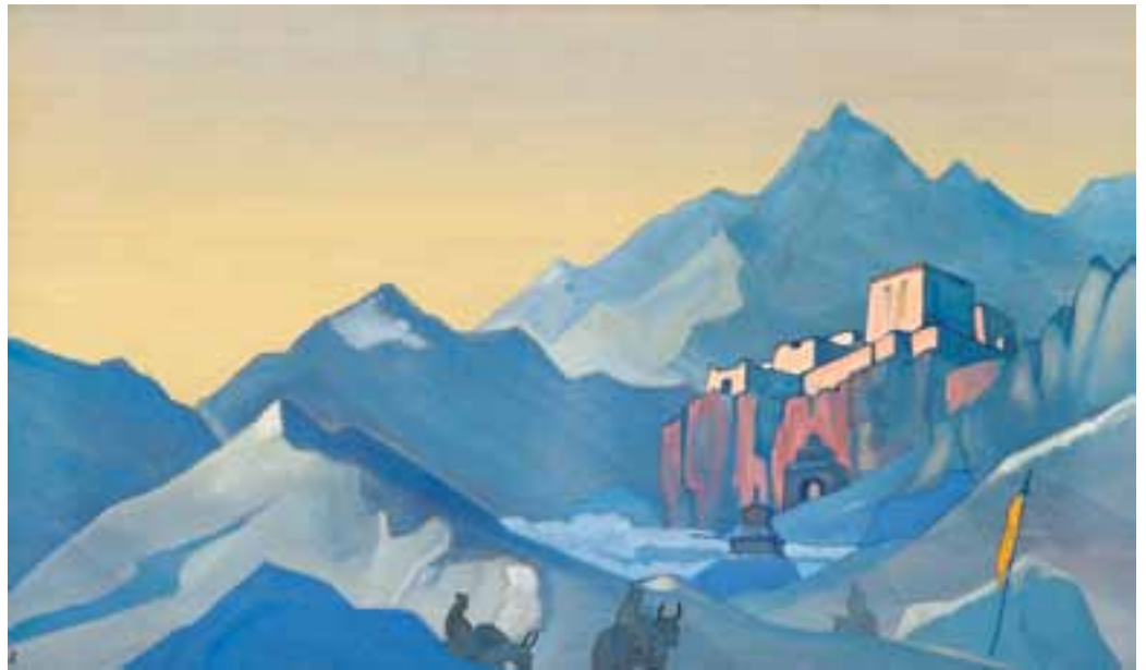
Н.К. Рерих. ПУТЬ НА КАЙЛАС (ТВЕРДЫНЯ ДУХА). 1932

Рерих часто пишет варианты картин с одним и тем же названием, это и «Труды Мадонны» (две картины), и «Ведущая» (пять картин), и «Чинтамани» (две картины), и многие другие. Их объединяет один сюжет, меняются пейзаж, колорит или другие детали.