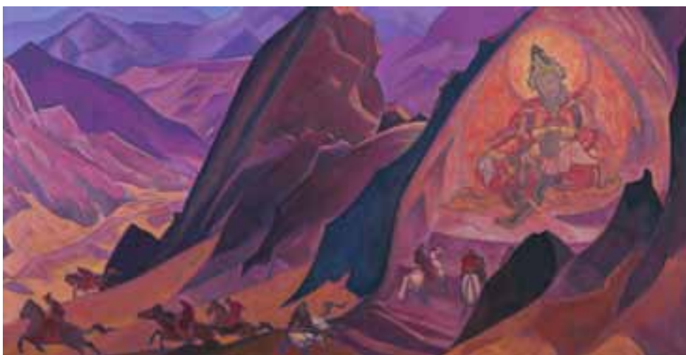
Н.К. Рерих. ПРИКАЗ РИГДЕН-ДЖАПО. 1926

Внимательно изучая эти тексты, мы неизбежно почувствуем, насколько важна и ответственна миссия всех, кто в этом воплощении принял Учение как руководство к действию.