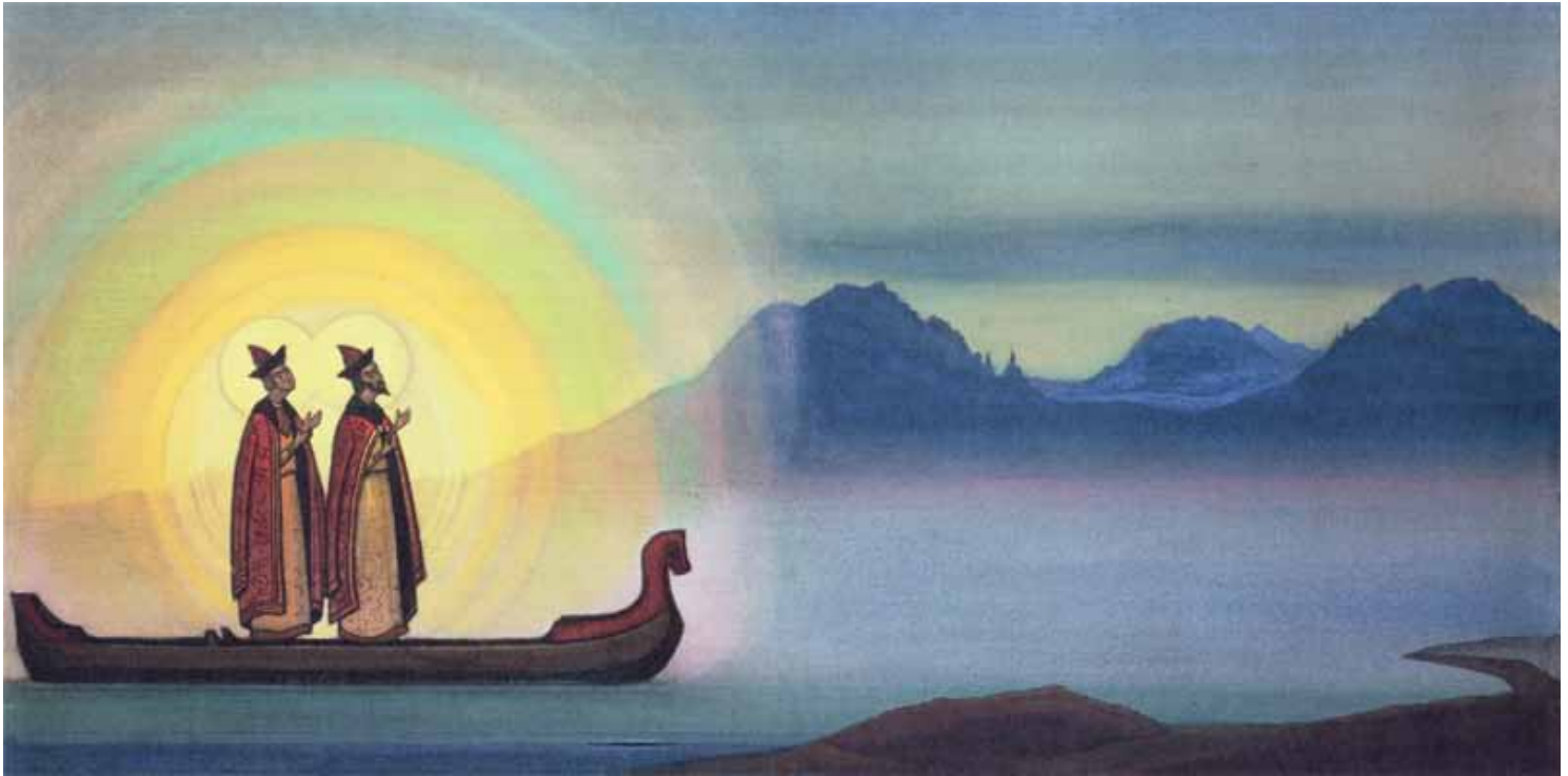
Н.К. Рерих. СВЯТЫЕ БОРИС И ГЛЕБ. 1942

ительство, что в теософской литературе почти нигде не упоминается наша страна, как будто бы шестая часть Света не имеет места в космическом плане и эволюции. Почти никто не задаётся вопросом, в чём тут дело, где причина этого? Отвечу Вам — всё сокровенное особо охраняется 24 .