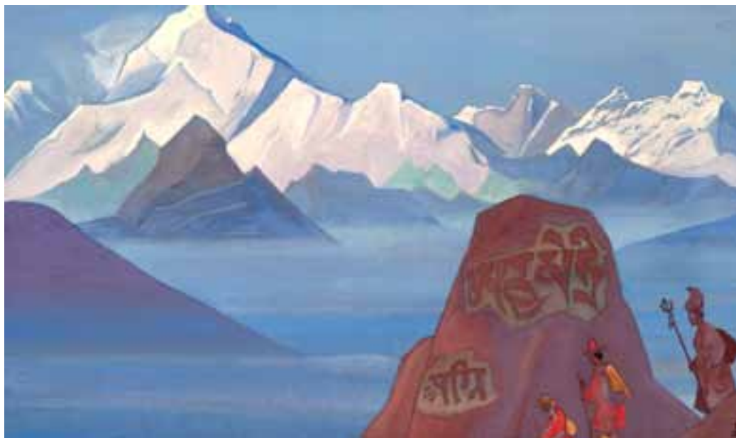
Н.К. Рерих. ПУТЬ НА КАЙЛАС. 1932

«В стане некоторое волнение, — записывает во время Центрально-Азиатской экспедиции Н.К. Рерих. — Мы подходим к Брамапутре, той самой, которая берёт исток из священного Манасаровара — озера великих Нагов. Здесь родилась мудрая Ригведа, здесь близок священный Кайлас, куда ходят пилигримы, предчувствуя, на каком великом пути лежат эти места» 19 . «Когда нам оставался один день пути до Манасаровара, весь караван воспрял духом — так далеко воздействует аура священного действующего ашрама» 20 .