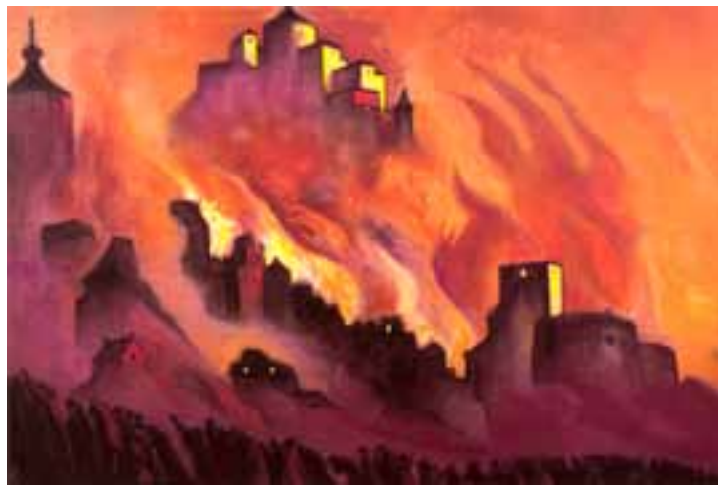
Н.К. Рерих. АРМАГЕДДОН. 1940

«За ошибки одних ответственность несут все. Человек может отказываться от этой ответственности,