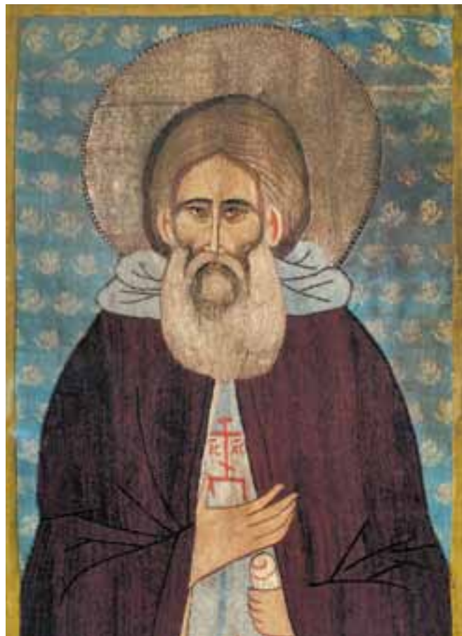
Покров со святых мощей преподобного Сергия Радонежского. Шитьё. Фрагмент. 1420-е гг.

Также около этого времени совершается величайшее дело по распространению и насаждению новых обителей учениками Преподобного. По разным направлениям, широко наметились эти ячейки духовной культуры. Преподобный, кроме своей первоначальной Обители на Маковце, сам построил и Обитель Киржачскую. Кроме того, по поручению великого князя Дмитрия Ивановича, основал два Дубенских монастыря, затем Московский Симонов монастырь и Голутвинский. Им же, по просьбе князя Владимира Андреевича Храброго, был заложен монастырь Высоцкий в Серпухове. Преподобный Сергий помогал и митрополиту Алексию в устройстве Московского Андроникова монастыря. Причём все места для Обителей Преподобный избирал сам лично, совершая все эти многовёрстные передвижения пешком. Ещё при жизни Преподобного ученики его были поставлены им игуменами в основанных им монастырях. Так, Блаженный Роман — первый игумен Киржачской Обители; Преподобный Андро-