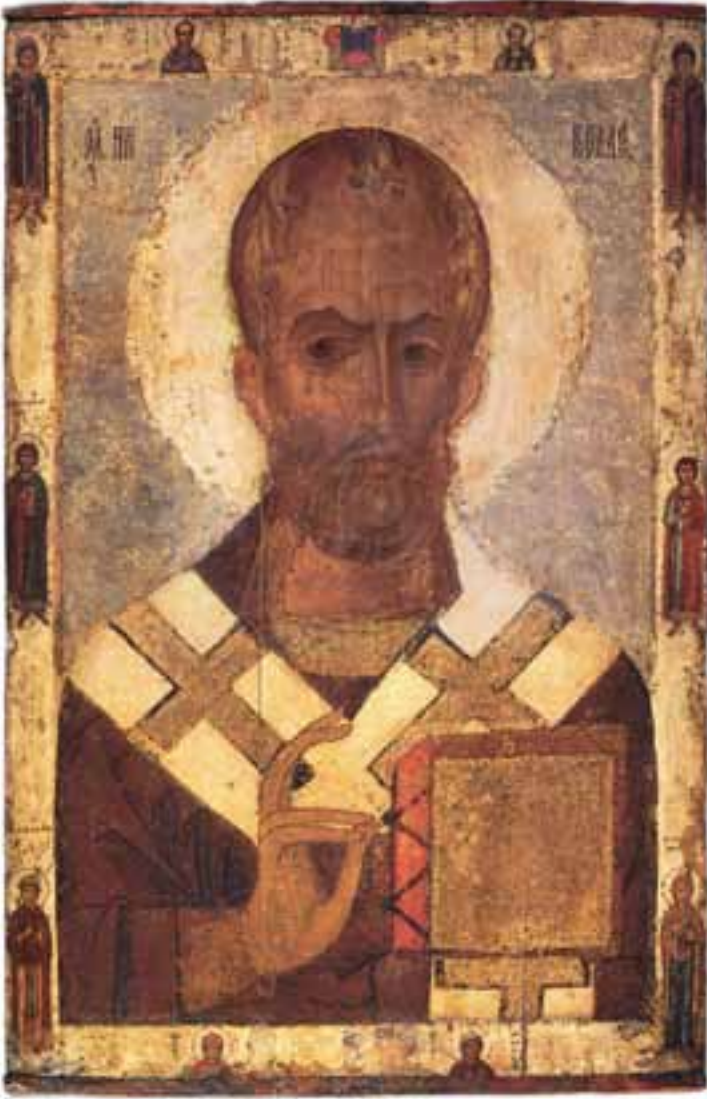
НИКОЛА С ИЗБРАННЫМИ СВЯТЫМИ. Середина XII — начало XIII в. Государственная Третьяковская галерея, Москва

19 декабря отмечается день памяти Святителя Николая Мирликийского. В народе этот день называют Николой зимним.