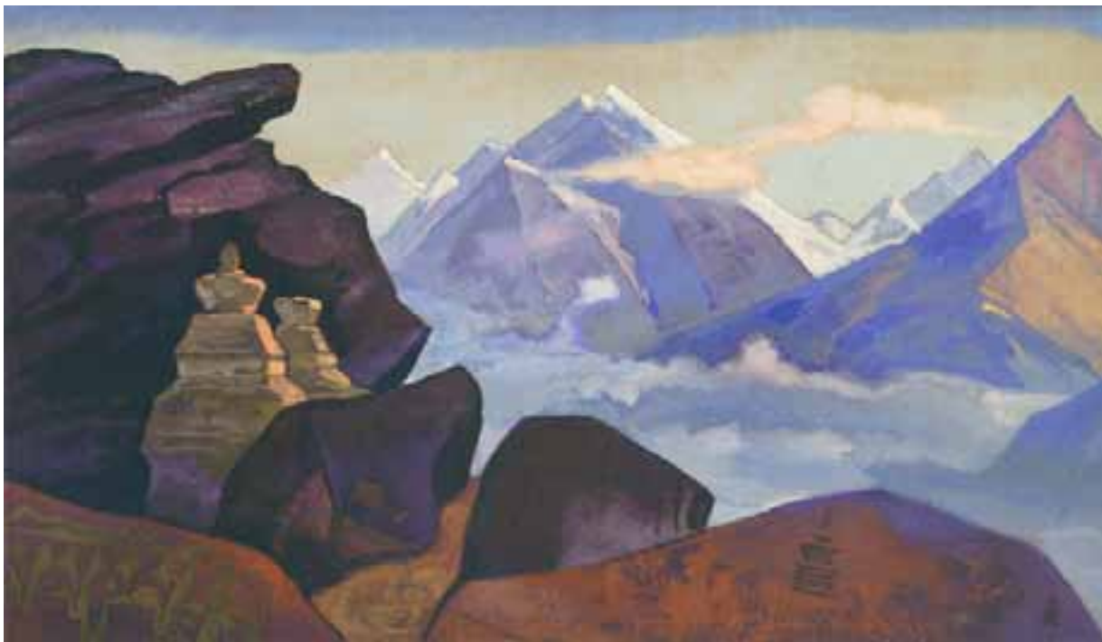
Н.К. Рерих. ПУТЬ НА КАЙЛАС. 1931

вья, даже удалённые страны мыслили о прекрасной Индии, которая кульминировалась в народных воображениях, конечно, сокровенно таинственными снеговыми великанами. "Гималаи" на санскрите — "страна снегов" 6 . «Нигде нет такого сверкания, такой духовной насыщенности, как среди этих драгоценных снегов» 7 . «Я горд, что мне было предназначено прославить во многих картинах величавые, священные Гималаи» 8 .