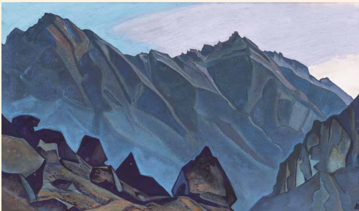
Н.К. Рерих. ГОРА КОЛОКОЛА. 1932

Перед нами путь на Кайлас. Высится одно из пятнадцати священных чудес, исчисленных в книгах Тибета. Гора Колокола! По острым кряжам ходят к вершине её. Стоит она поверх последнего можжевельника, поверх всех жёлтых и белых складок нагорных. Тут ходил и Падма Самбхава, о том говорит древний монастырь Гандо-Ла. Именно здесь пещеры Миларепы. И не одна, но многие, освящённые именем отшельника, слушавшего перед зарёю голоса дэв. Здесь же и духовные твердыни Гаутамы Будды. Недалеко и легенды, сложенные около Пахари Баба. Ходили тут многие Риши.