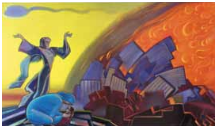
С.Н. Рерих. ТЫ НЕ ДОЛЖЕН ВИДЕТЬ ЭТОГО ПЛАМЕНИ! 1968

«Пора бы человечеству нашему осознать ту Гигантскую Дозорную и Охранную Работу, которая проводится неусыпно и неукоснительно нашими Великими Охранителями!! Они уже на протяжении столетия бьют в Набат и предупреждают о грозящем нам Бедствии, если мы не просветим своё сознание в смысле общечеловечности и проведения кооперации народов, вместо насаждения растления и ничем не оправдываемой вражды и захвата власти! Всякие порабощения и завоевания во всех областях жизни должны кануть в Лету. Кооперация, сознательный труд и добросовестное отношение во всём и ко всему должны лечь в основу будущего строительства» 11 .