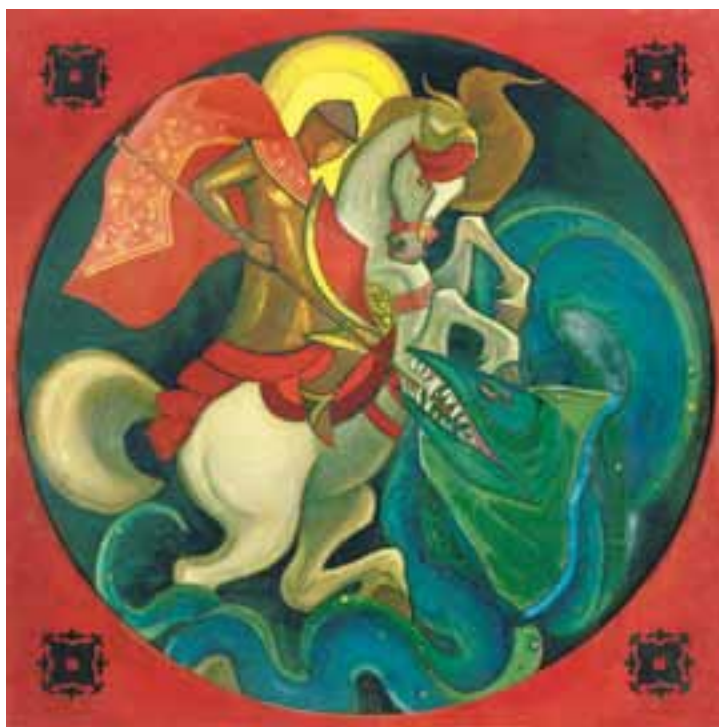
Н.К. Рерих. СВЕТ ПОБЕЖДАЕТ ТЬМУ. 1933

Письма Елены Ивановны, относящиеся ко времени Армагеддона — великой решающей Битвы между Силами Света и Тьмы, описанной в Откровении Иоанна Богослова, или Апокалипсисе (последней книге Нового Завета), — не только полны тревоги за судьбу планеты, в них звучит острая боль за то чудовищное напряжение, которое Великое Братство испытывает в этой битве.