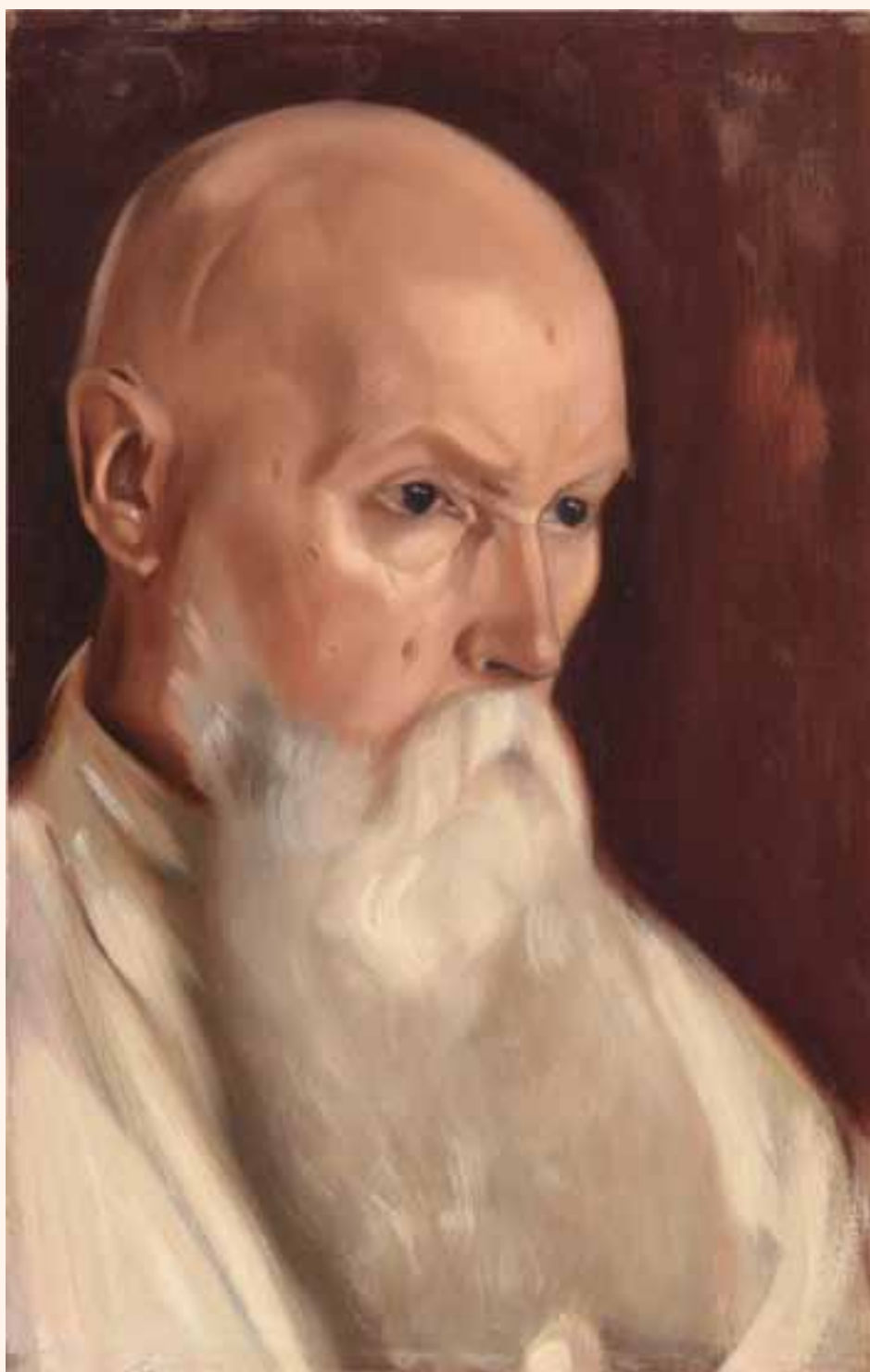
С.Н. Рерих. ПОРТРЕТ Н.К. РЕРИХА. 1944

Каждая эпоха имеет своих героев. В эпоху воскресения духа Он будет первым среди героев духа. Во всей реальности встанет Его подвиг и труд. Чем тише подвиг, тем громче он в мегафоне пространства. Внешние громкие дела часто пространственно ничтожны.