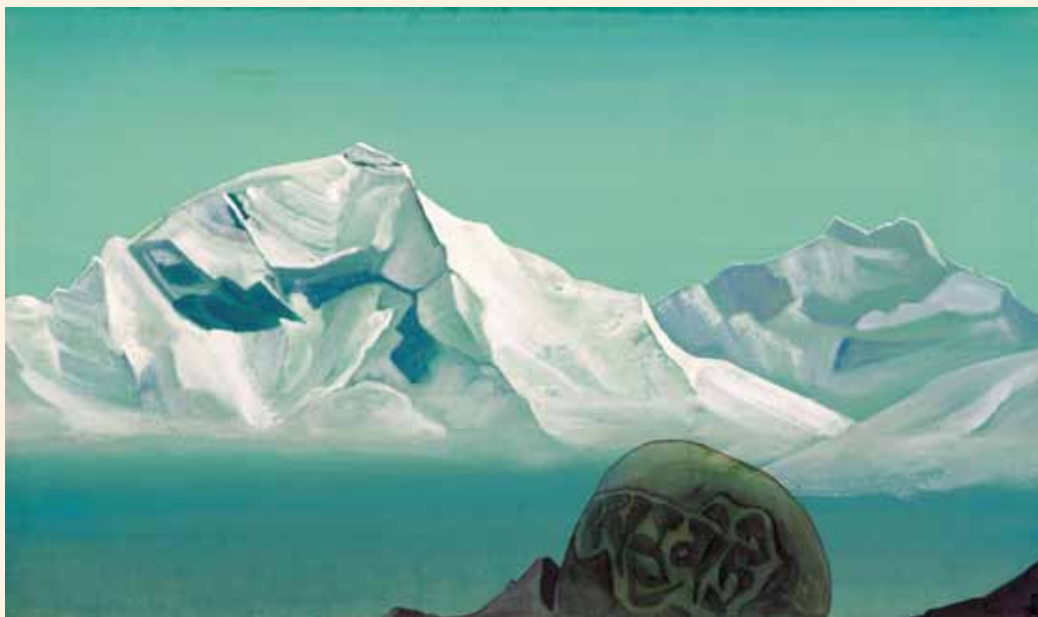
Н.К. Рерих. ПУТЬ НА КАЙЛАС. Серия «Святые горы». 1933

Издание Сибирского Рериховского Общества, № 12 (224), Декабрь, 2012