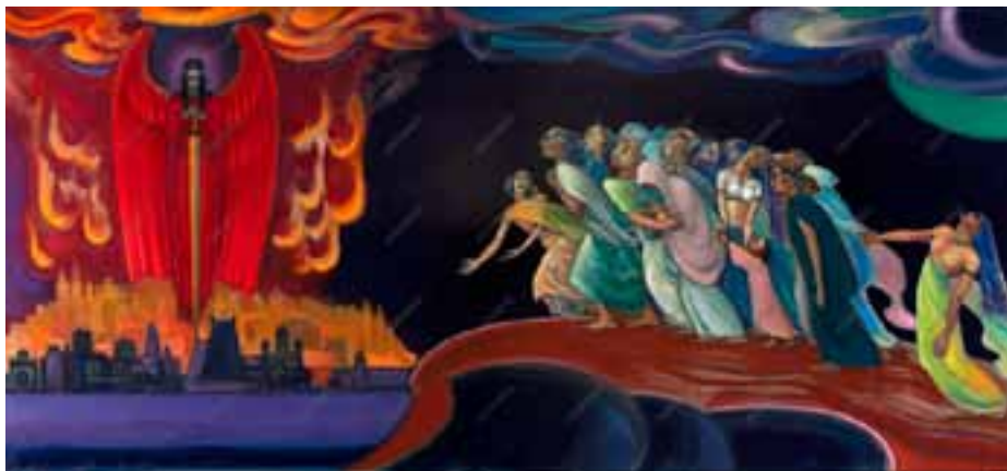
С.Н. Рерих. ВОЗВРАТИ, ЧЕЛОВЕЧЕСТВО. 1962

Сейчас возможность изучать книги Учения даётся всем. Учитель утверждает: «Пространство звучит, пространство зовёт, пространство ждёт пробуждения сердец человеческих, ибо конечные сроки приходят» 9 .