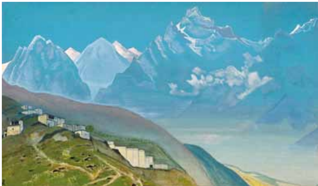
Н.К. Рерих. НА КАЙЛАС. ЛАХУЛ. 1932

В одной только Центрально-Азиатской экспедиции Рерихом было создано более 500 гималайских этюдов. Каждая картина переносит нас в загадочный горный мир, но сегодня хотелось бы поговорить об одной из вершин Трансгималаев — священной горе Кайлас.