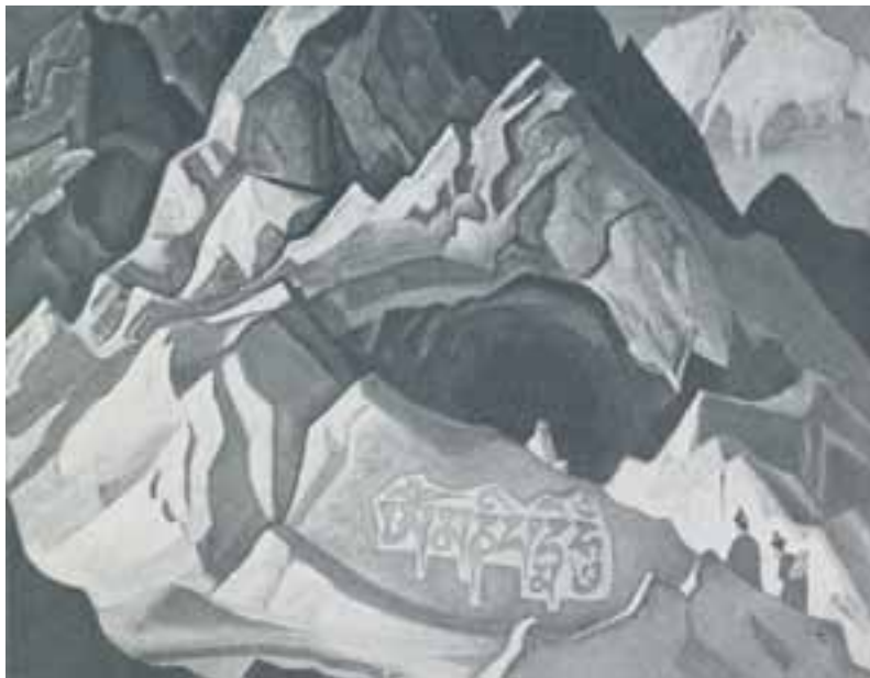
Н.К. Рерих. ПУТЬ НА КАЙЛАС

В своих картинах Н.К. Рерих хотел не только показать реально существующий путь на Кайлас, но и оставить свидетельства извечного устремления человеческого духа к самому Высшему. Именно это стремление является тем двигателем, которое помогает человечеству вступить на путь эволюции и выйти из замкнутого круга обыденной жизни, на просторы духовной Чистоты и Правед-