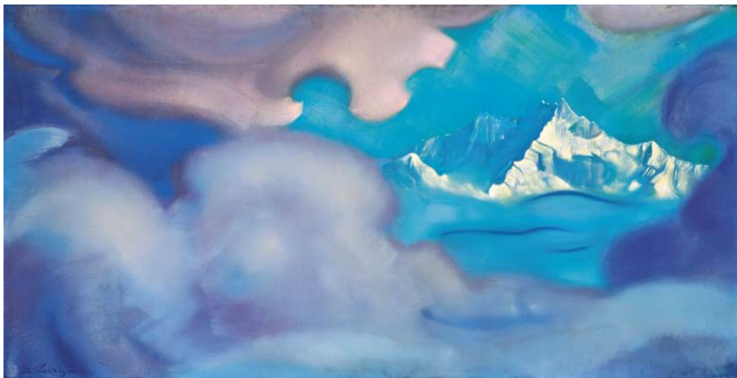
С.Н. Рерих. КАНЧЕНДЖАНГА. ЦИТАДЕЛЬ. 1954

Издание Сибирского Рериховского Общества, № 9 (197), Сентябрь, 2010