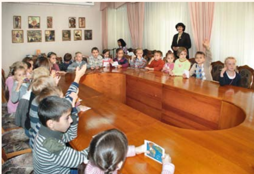
Дети в Музее Н.К. Рериха в Новосибирске. Сентябрь 2010

Дети очень подражательны. Они воспринимают и часто копируют и внешние проявления педагога — его манеру держаться, говорить, жестикулировать. Внешняя культура поведения способствует и ведёт к внутренней духовной культуре, так же как внутреннее благородство влияет на манеру поведения. Всё взаимодействует, и эта взаимосвязь должна быть осознана и