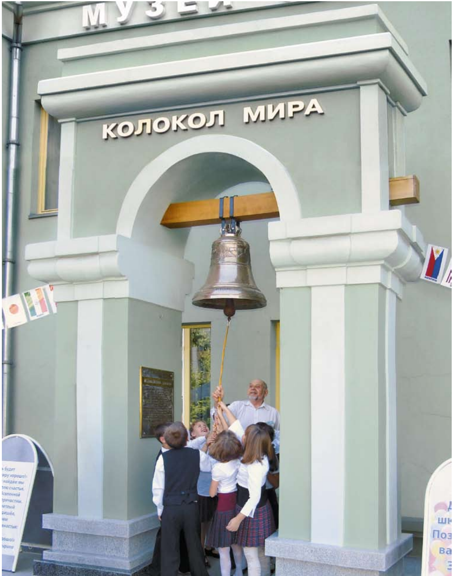
У КОЛОКОЛА МИРА. 1 сентября 2010 г.