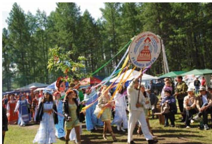
Торжественное шествие участников фестиваля