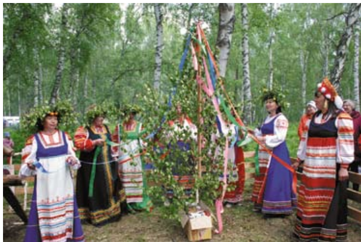
Хоровод вокруг берёзки

Такой небесной синевы, Ручьём звенящих водопадов Не встретите, ручаюсь, вы, Как здесь. И на Кавказ не надо!