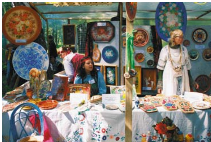
На выставке-ярмарке народных промыслов

СибРО представило на конкурсе «Город мастеров» также изделия из дерева и камня. Резные шкатулки и тарелки, украшенные каменными пла-