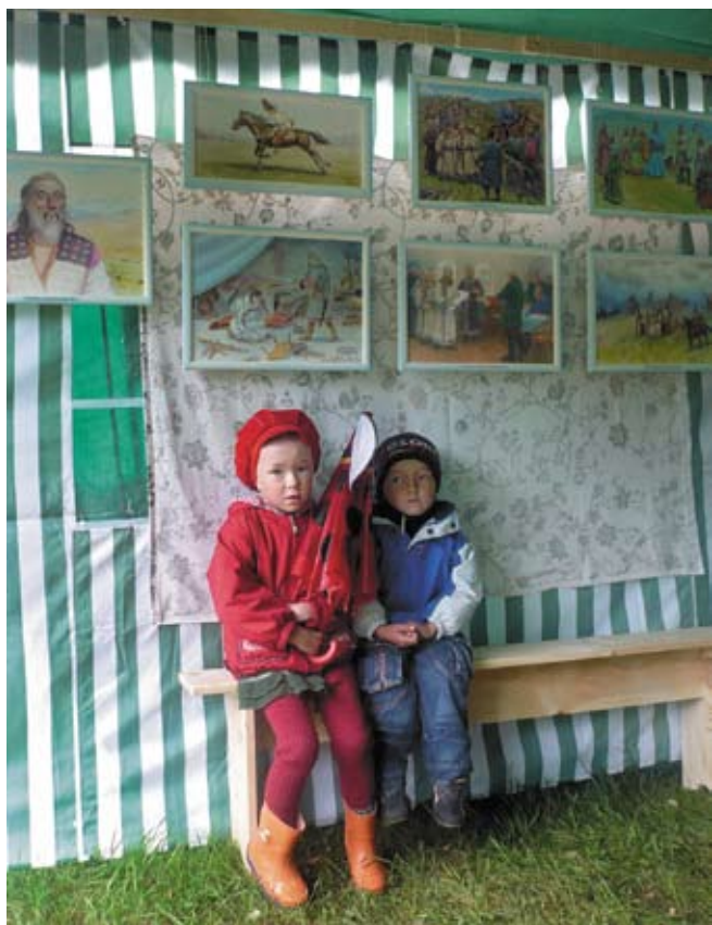
Выставочный павильон СибРО