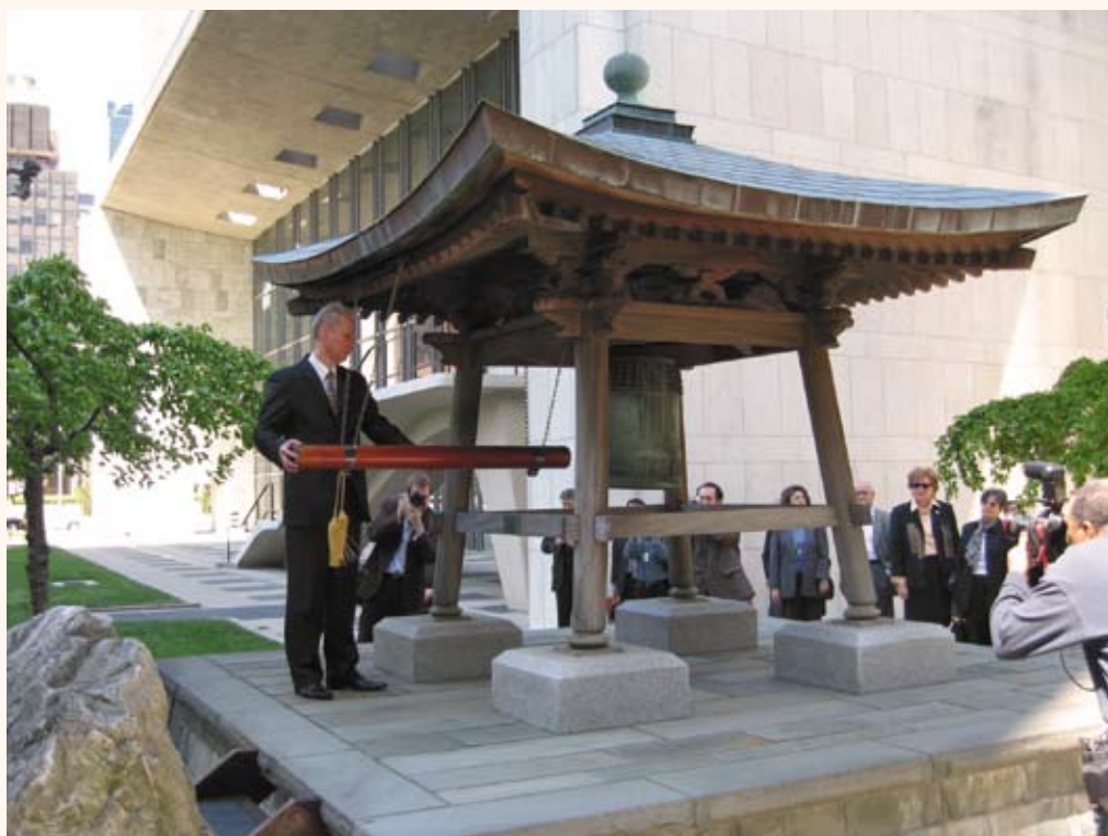
Колокол Мира перед штаб-квартирой ООН. Нью-Йорк

Первое капитальное сооружение в России — арка «Колокол Мира» — возведено в Новосибирске на территории Музея Н.К. Рериха. Инициаторами проведения акции «Колокол Мира в День Земли» в столице Сибири стали несколько общественных орга-