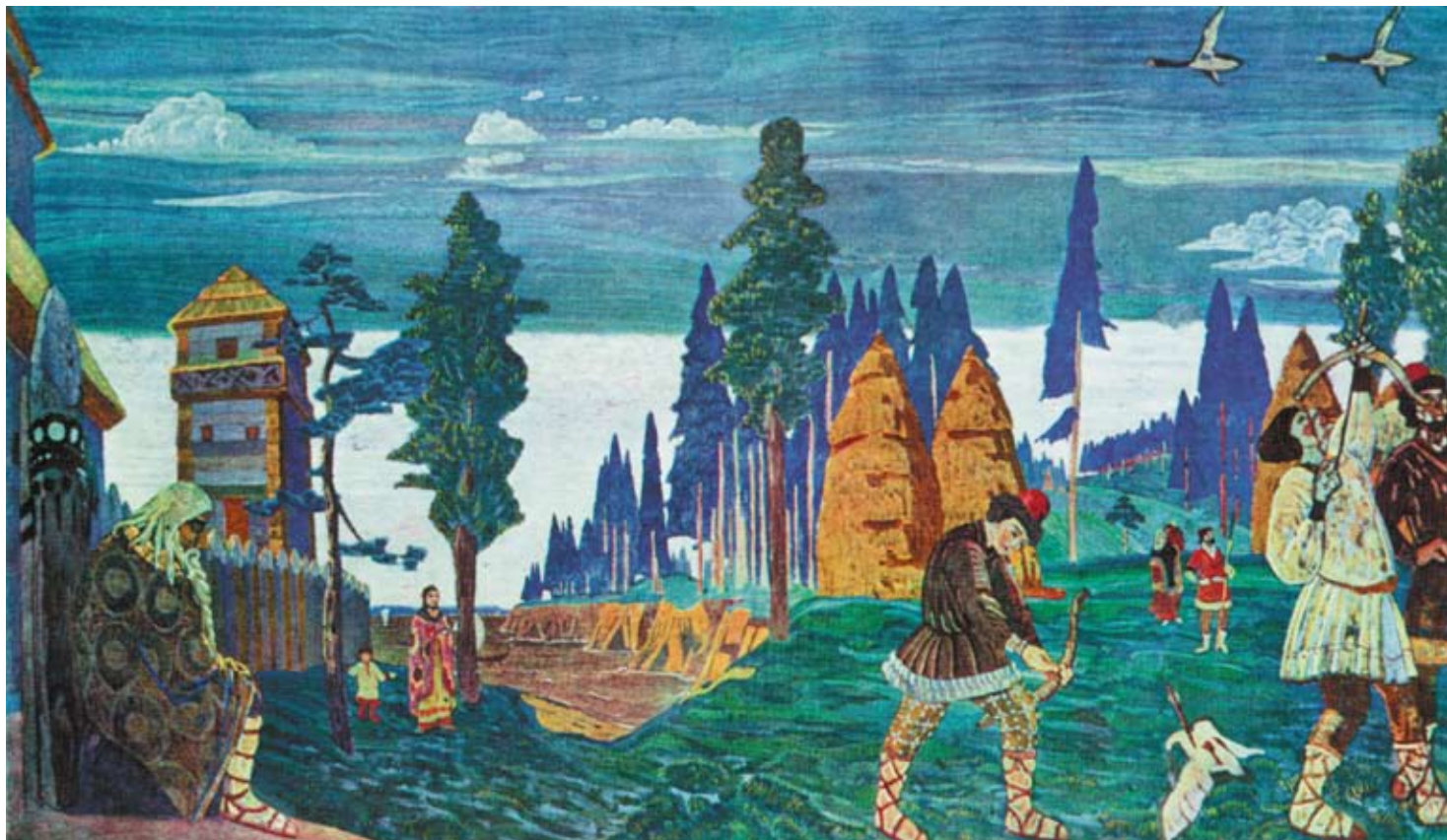
Н.К. Рерих. ПОМОРЯНЕ. УТРО. 1906

Рерих рисует образ древнего города и в то же время воссоздаёт героический дух сурового средневековья.