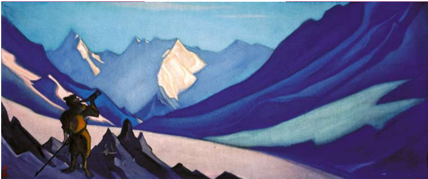
Н.К. Рерих. ЗОВ. 1944

неодолимой стеной ограждения"» 12 . Злобно скрежеща зубами от бессилия своего перед этим мощным духом, тьма рассеивалась без следа.