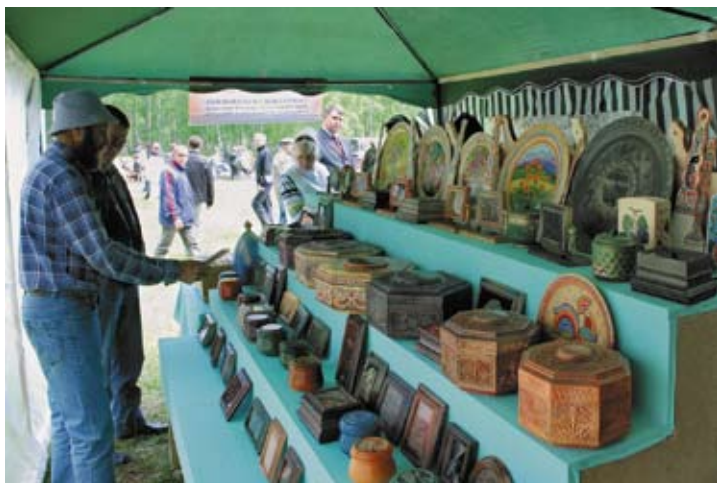
Выставка-продажа резных изделий

Н.К. Рерих, высоко ценивший истинное народное творчество, предвидя его будущий расцвет, говорил: «...И у нас есть попытки пробить свежие родники. Почтена старина лучшим вниманием: в ней найдена живая сила — сила красоты, идущей к новизне, и основы которой соткали для кристаллов векового орнамента все царства природы: звери, птицы, кам-