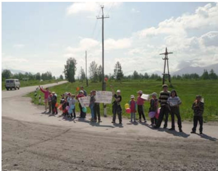
Болельщики приветствуют участников велопробега

В республиканском празднике «Родники Алтай» Сибирское Рериховское Общество принимало уча-