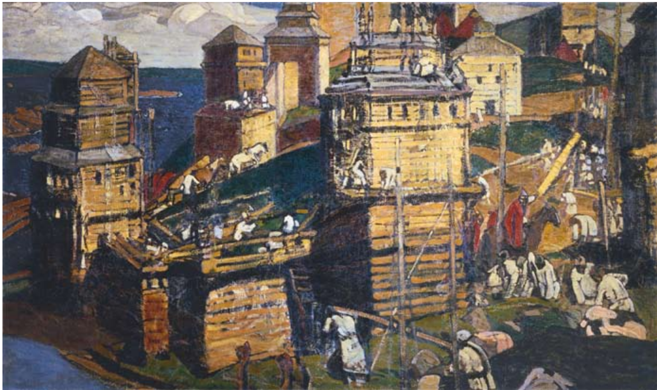
Н.К. Рерих. ГОРОД СТРОЯТ. 1902