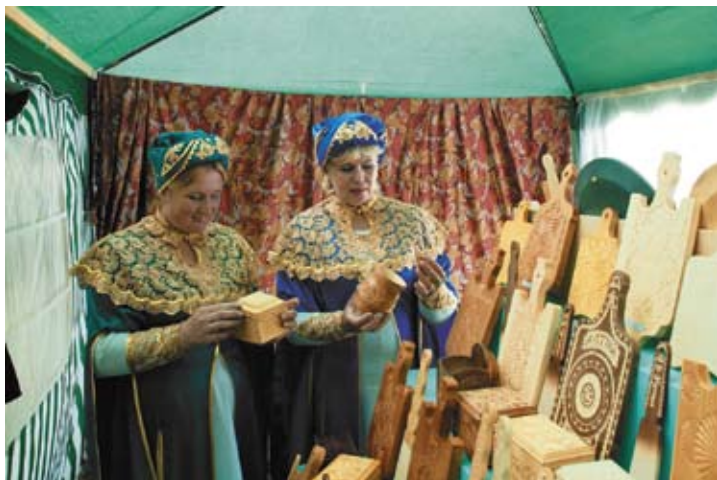
В павильоне СибРО

необходимые предметы русского быта. Здесь проводят игры, угощают традиционными русскими блюдами, под аккомпанемент русской гармошки поют и пляшут артисты. Под звучание народных песен разворачивается перед нами русская ярмарка — в деревянных теремках, в цветных палатках народными мастерами представлено огромное разнообразие изделий: берестяных и кожаных, лоскутных и вязаных; плетение из лент, украшения из бисера и камней, лапти и бочонки, русские народные костюмы, вышивка, мягкая игрушка, музыкальные инструменты и картины. Здесь же всех желающих обучают резьбе и росписи по дереву. Многие продавцы сами нарядились в русские народные костюмы, с шутками и прибаутками зазывают гостей, показывают свои достижения.