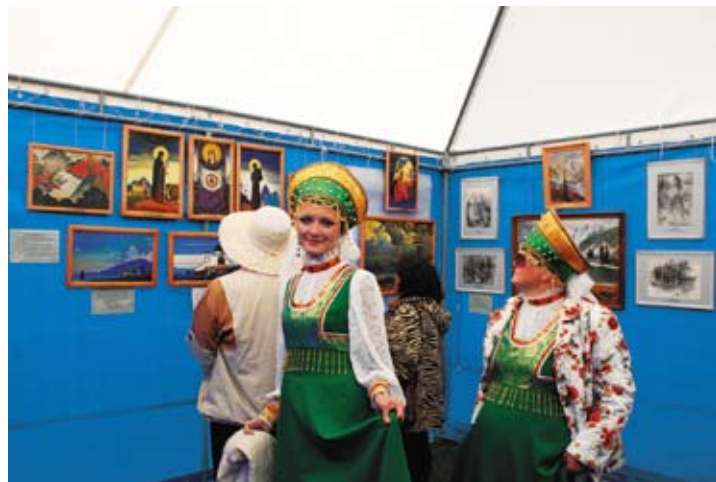
Выставочный павильон СибРО

лей побуждали экскурсоводов проводить экскурсии дольше и обширнее обычного. Не так часто в музей заходят сразу по десять – пятнадцать молодых русских красавиц в кокошниках и вышитых сарафанах и задают вопросы о смысле жизни и о месте человека в этом мире.