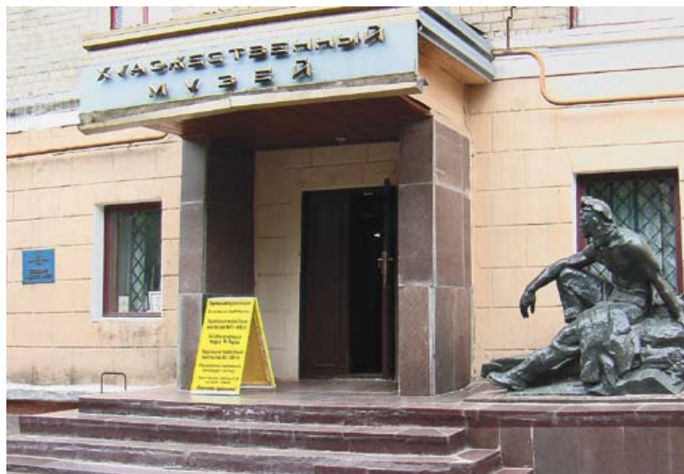
Горловский художественный музей

12 апреля 1958 года в Москве открылась первая в Советском Союзе персональная выставка произведений Н.К. Рериха, организацией которой занимался вернувшийся из Индии на Родину старший сын художника Юрий Николаевич Рерих. Среди полотен Рериха, предоставленных музеями и частными коллекционерами, на выставке экспонировалось несколько картин из собрания Мухиных. К 1962 году их коллекция стала столь объёмной, что супруги обратились в Министерство культуры с предложением о безвозмездной передаче картин в один из музеев страны при условии их постоянного экспонирования. Находившийся в это время в Москве Б.В. Бородин, директор недавно созданного Художественного музея Горловки, с благодарностью принял этот дар.