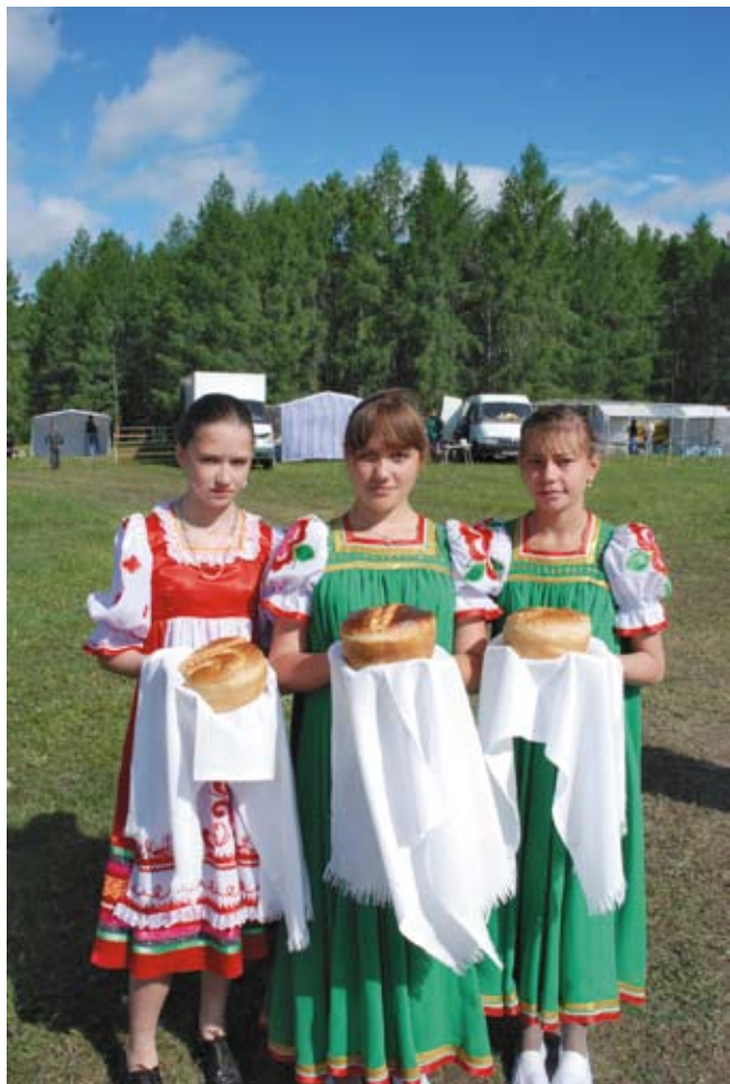
Русские красавицы встречают хлебом-солью