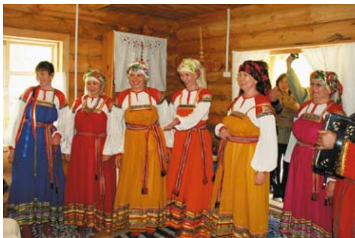
В русской горнице

Кажется, что вся Уймонская долина заполняется напевной и лиричной мелодией русской старины. «Спой, человек, песню Солнцу! Спой вместе с птицами и ветром, вместе с травой и ручьём. Спой о том, как ты живёшь в мире и согласии с природой»