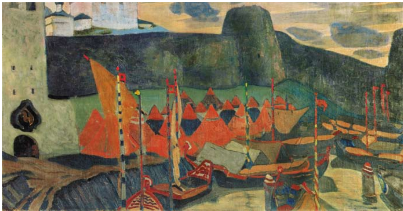
Н.К. Рерих. СТАРЫЙ ПСКОВ. 1904