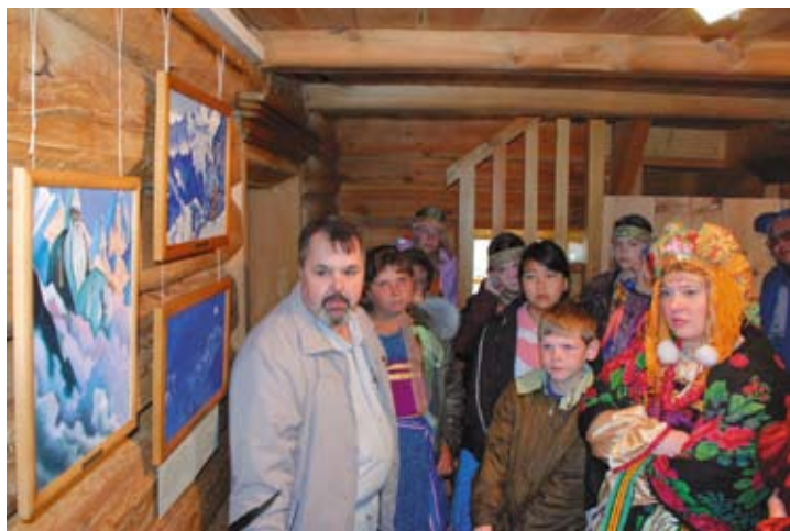
Экскурсия в Музее Н.К. Рериха

Пусть, как живые родники, сольются в широкие русла народные праздники Алтая, образуя собой единый мощный поток Культуры.