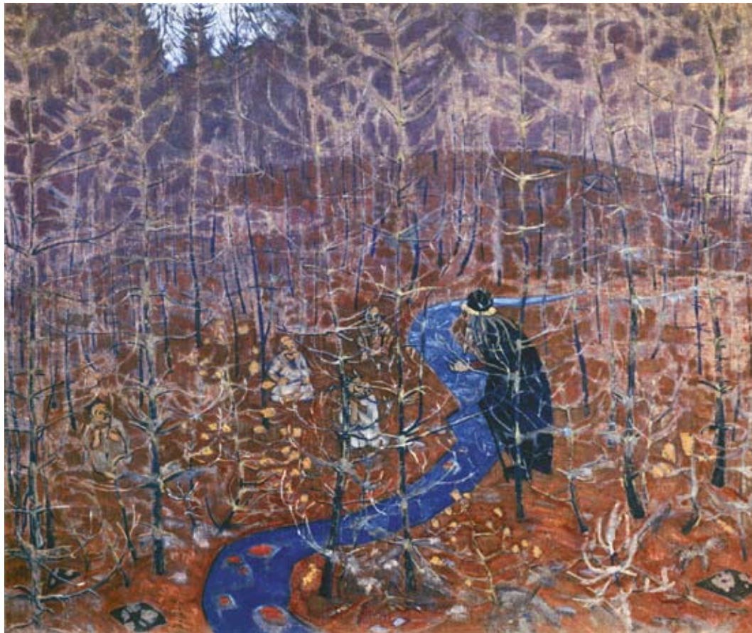
Н.К. Рерих. ЛЕСОВИКИ. 1916