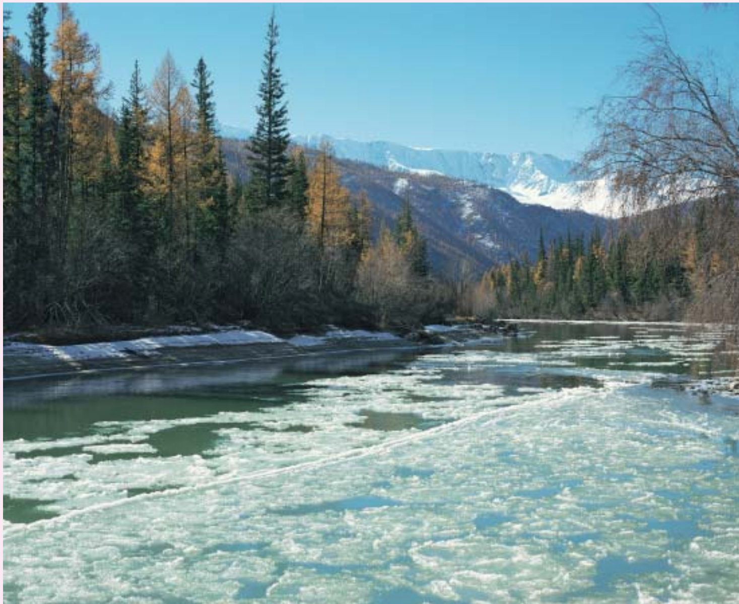
ГОРНЫЙ АЛТАЙ.