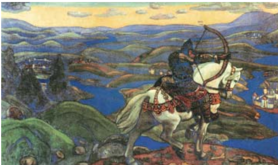
Н.К.Рерих. ИЛЬЯ МУРОМЕЦ. Панно из сюиты «Богатырский фриз». 1910

Елена Петровна Блаватская в «Тайной Доктрине» рассказывает о французском историке Августине (Огюсте) Тьери (1795 – 1856), который «сделал честное признание», что « лишь в легенде заключается настоящая история; ибо... "Легенда есть живая традиция, и трижды из четырёх случаев