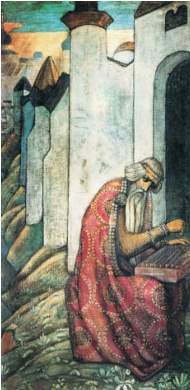
Н.К.Рерих. БОЯН. Богатырский фриз. 1910

под облака, рыбою ходить да во глубоки страна, зверями ходить да во темны леса», а также понимать язык птиц и зверей.