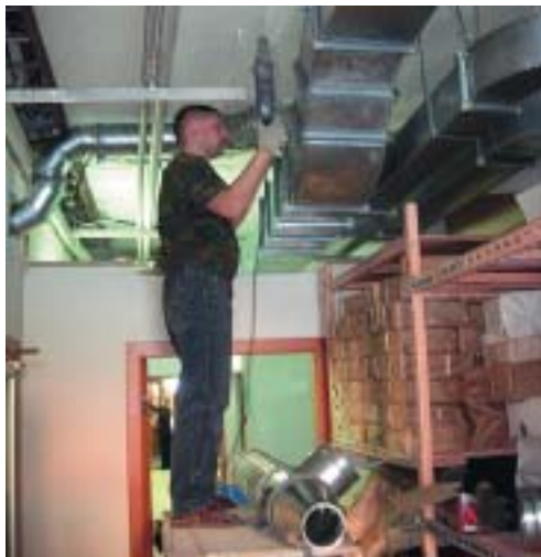
Монтаж вентиляции на первом этаже Музея Н.К.Рериха. Март 2006 г.