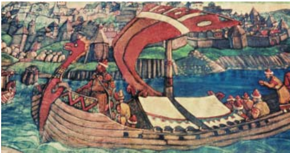
Н.К.Рерих. САДКО. Панно из сюиты «Богатырский фриз». 1910

Русские богатыри, о которых сложено так много легенд, сказаний, былин и песен, совершали свои подвиги в труднейшие для Руси времена нашествий иноплемennых завоевателей: половцев, печенегов, татаро-монголов. Именно в этот период возникли знаменитые легенды о народных героях-богатырях. Весть о них распространялась из уст в уста, путешествующие певцы и сказители складывали о них песни. Со временем эти истории приукрашивались рассказчиками, обрастали новыми подробностями, но происходило это вовсе