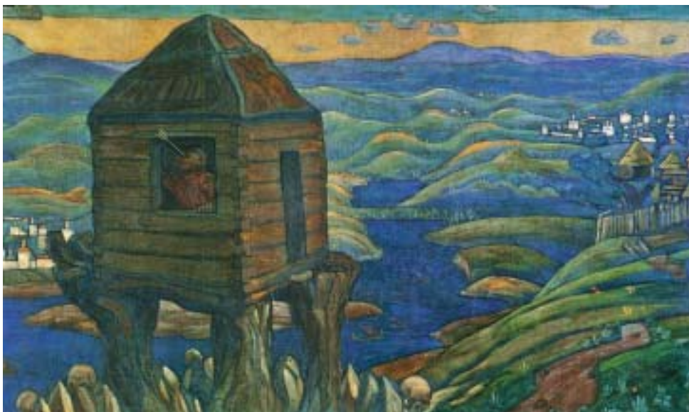
Н.К.Рерих. СОЛОВЕЙ-РАЗБОЙНИК. Панно из сюиты «Богатырский фриз». 1910

Шло время, и такие рассказы превращались в былины, легенды, сказания, в которых был заложен особый смысл — как воспитательного, так и «вдохновительного» характера, то есть вдохновляющего других людей на благородные поступки и подвиги, а также вселяющего веру в победу добра над злом, веру в то, что справедливость возможна не только на небе, но и на земле. Часто эти легенды и сказания, ходившие в народе, запечатлевались летописцами, благодаря чему они сохранились до наших дней. У каждого народа есть такая «легендарная» летопись, передающаяся от поколения к поколению, но есть много легенд, которые словно бы перешли границы своих государств и стали известны всему миру. Именно такими являются былины о русских богатырях.