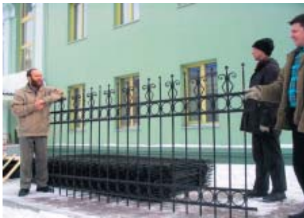
Получение из Екатеринбурга очередной части ограждения для Музея Н.К.Рериха. Март 2006 г.

Выражаем нашу признательность друзьям из Музея Николая Рериха в Нью-Йорке за сотрудничество и помощь материалами архива. Будем укреплять наше доброе содружество!