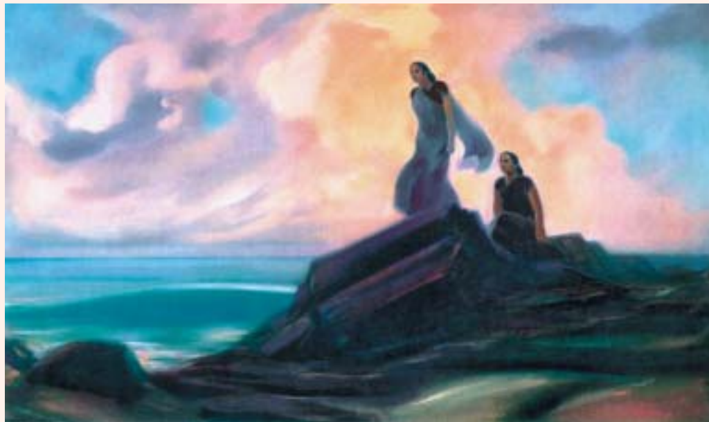
С.Н.Рерих. ОЖИДАНИЕ. 1944

Понятие материнского долга требует одухотворе-