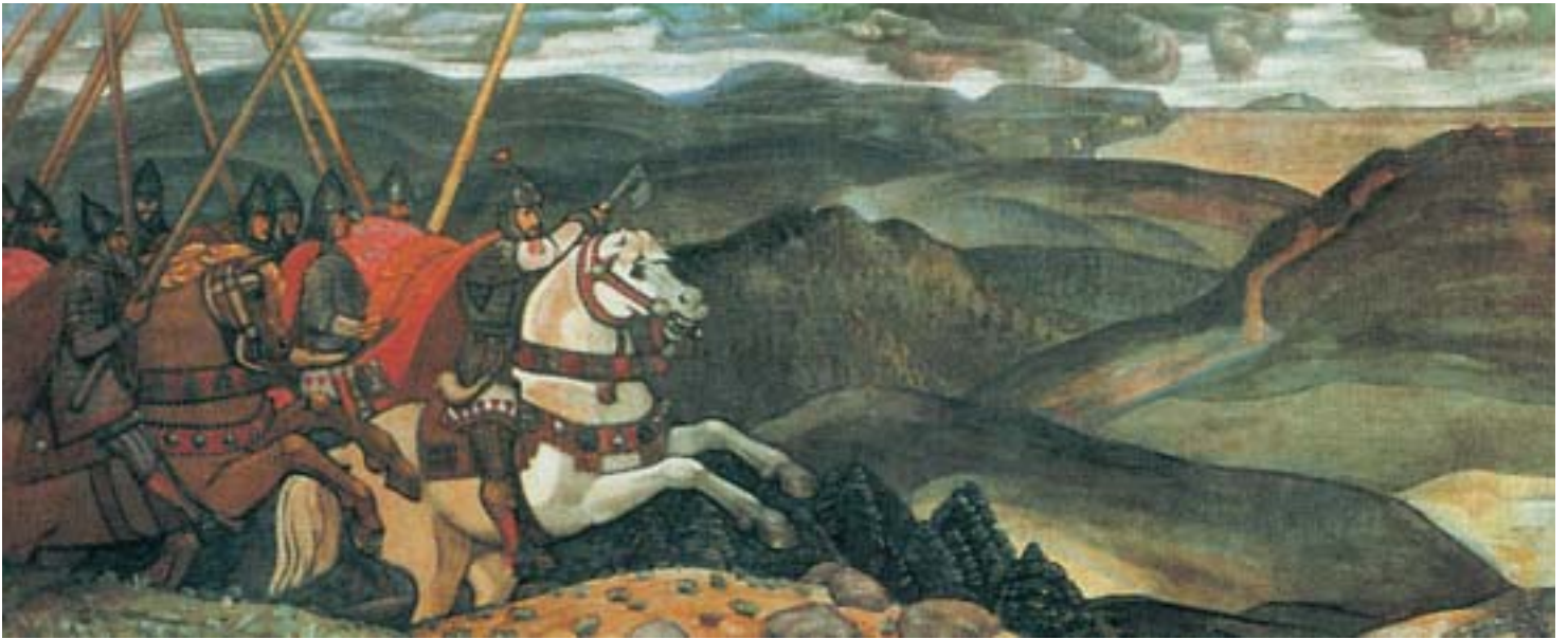
Н.К.Рерих. ВОЛЬГА СВЯТОСЛАВОВИЧ. Панно из сюиты «Богатырский фриз». 1910