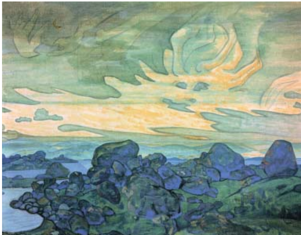
Н.К.Рерих. ПУТЬ ВЕЛИКАНОВ. 1910

На картине «Могила великана» изображён каменный лабиринт, под которым, согласно названию картины, покоится великан. Рерих в своей сказке «Лют-Великан» рассказывает об очень сильном, очень большом великане: «Борода у Люта — на семь концов, шапка на Люте — во сто песцов». Он был такой огромный, что «брату за озеро топор подавал, перекидывал». Далее Рерих пишет: