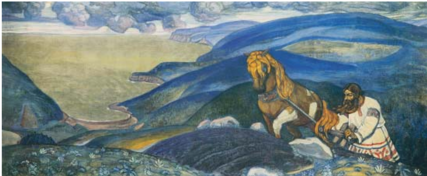
Н.К.Рерих. МИКУЛА СЕЛЯНИНОВИЧ. Панно из сюиты «Богатырский фриз». 1910

Одолел его Илья и привёз в стольный град Киев, к самому князю Владимиру.