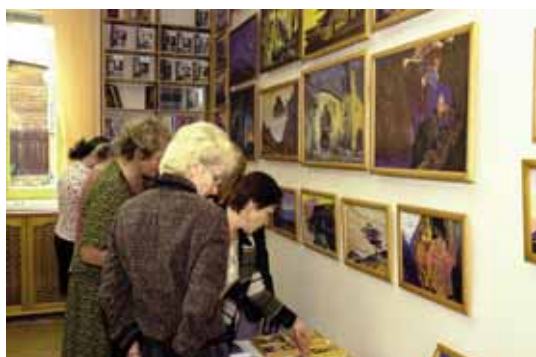
Кiosk в Музее Н.К.Рериха в Новосибирске