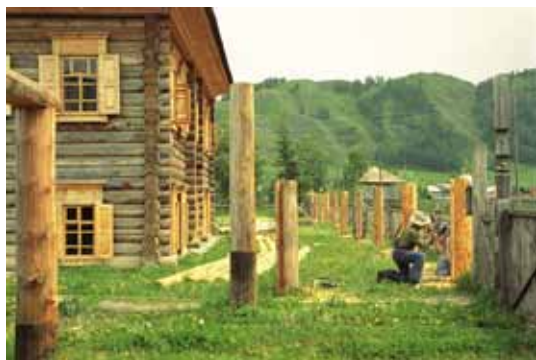
Установка ограждения. Верх-Уймон, 2005