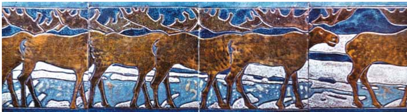
Н.К.Рерих. Каменный век. Север. Олени. 1904

В 1912 году балет был завершён. Музыка, необыч-