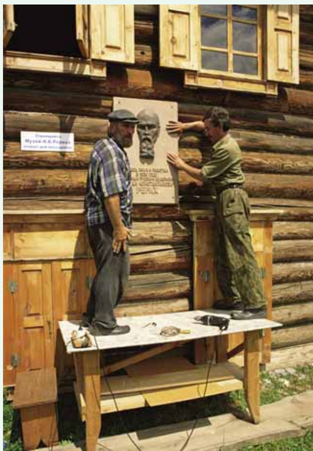
Установка памятной доски. 29 июня 2005 г.

В начале июня состоялась поездка детей из Верхнего Уймона в Новосибирск, в Музей Рериха. Могли ли мы раньше помыслить об этом — алтайские дети, без родителей, поехали за тысячу километров по при-