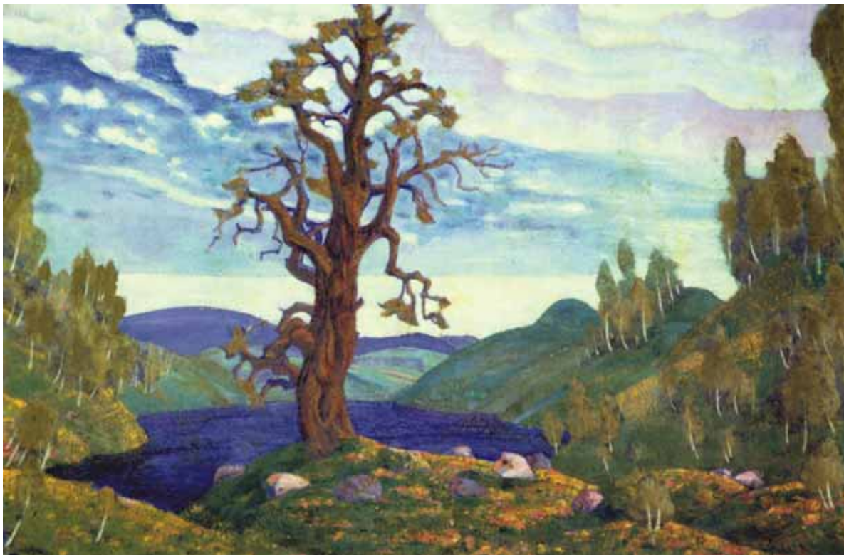
Н.К.Рерих. ПОЦЕЛУЙ ЗЕМЛЕ. Эскиз декорации к балету «Весна Священная». 1912

ная и новаторская, произвела на Рериха огромное впечатление: «Чувствуется... непосредственное общение с землёю. При полном отсутствии этнографичности она полна какого-то общего доисторического проникновения». Впоследствии, во время путешествий по Азии, слушая «ритмы и напевы азийские», Рерих отмечал, как много общего у этих напевов с музыкой «Весны Священной», ибо в ней звучали те же «великие ритмы человеческих устремлений», то же «вечное начало», к которому, как утверждал Рерих, прикоснулся в своей музыке Стравинский.