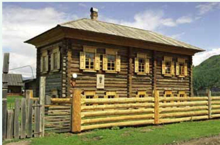
Музей Н.К.Рериха. Верхний Уймон. Июнь 2005 г.

Первая часть ограждения Музея — прясла (изгородь из брусьев) — была установлена в июне. В июле закончили укладку камней на отмостке вокруг здания