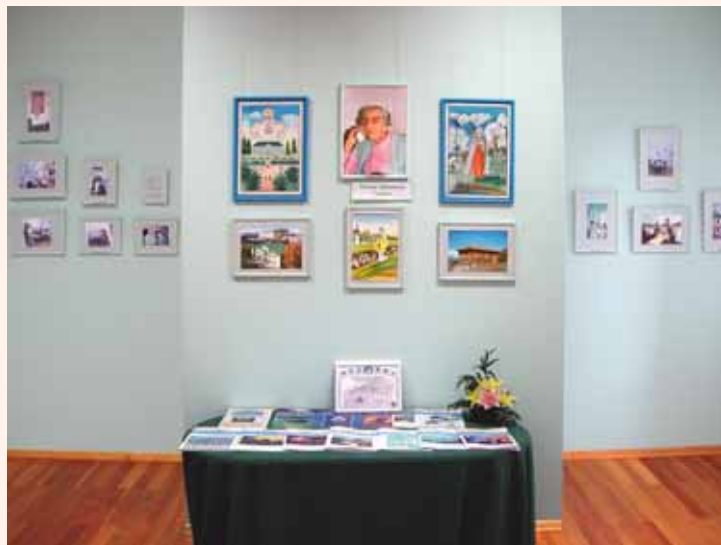
Зал истории Музея

их, наполнила новым светом и цветом, какой-то прозрачностью — будто накинута лёгкую волшебную вуаль. Здесь не хотелось ни говорить, ни восклицать, а только внимать, впитывать в себя таинство, исходящее от картин и царящее в залах. Это воистину другой мир: трогательный, хрупкий, говорящий без слов, — Мир Искусства.