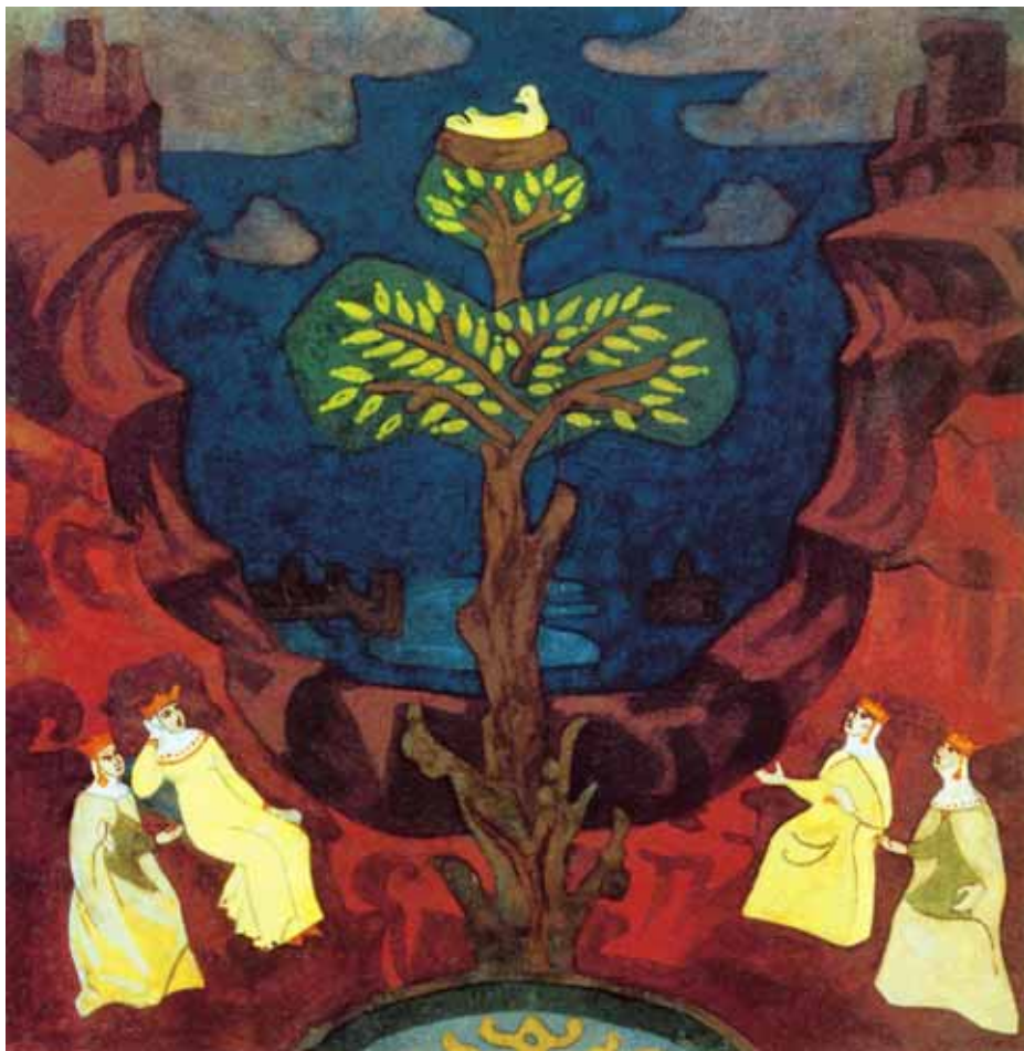
Н.К.Рерих. ДРЕВО ПРЕБЛАГОЕ. 1911

Через всё творчество Рериха проходит тема единства всего живого на земле, тема братства и родства всего со всем, понимаемого великим художником-мыслителем как основной закон жизни. Выразительно и глубоко эта тема воплощена в картине «Праотцы человечья», которая была написана Николаем Константиновичем в Талашкине в 1911 году, а впоследствии, в разные годы жизни, художник создал ещё несколько вариантов картины, один из которых называется «Чара звериная».