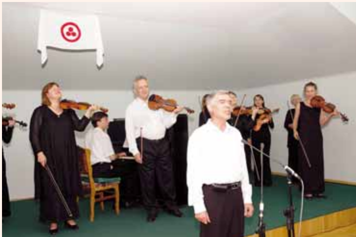
Выступление ансамбля скрипачей

фотографии, картины, книги, предметы, принадлежавшие Наталии Дмитриевне, письма к ней от её духовного Учителя, Бориса Николаевича Абрамова, — всё это позволяет соприкоснуться с прекрасным и возвышенным миром подвижницы, посвятившей свою жизнь самоотверженному несению света духа, преданному служению делу Рерихов.