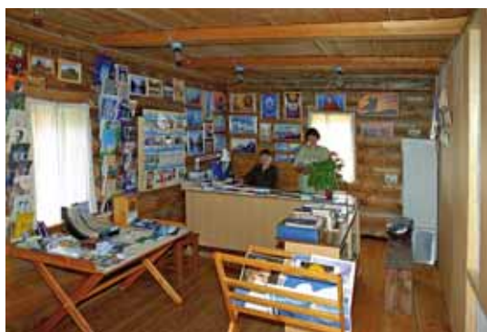
Кiosk в Музее Н.К.Рериха в Верх-Уймоне