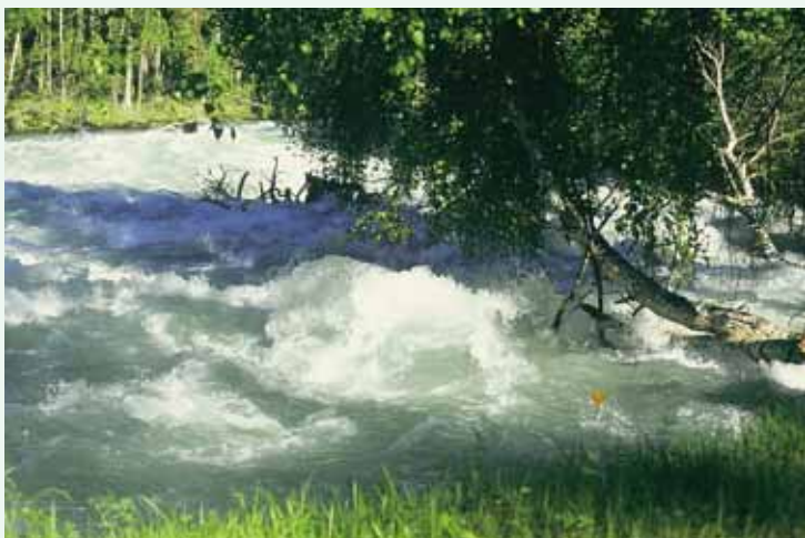
Река Кучерла. Алтай

Близится к завершению строительство моста через Катунь. В октябре состоится его официальное торжественное открытие и освящение. Новый мост протянулся от посёлка Октябрьского до Верхнего Уймона, и дорога до районного центра Усть-Коксы стала короче на сорок километров. Жители Уймонской долины с нетерпением ждут окончания этого строитель-