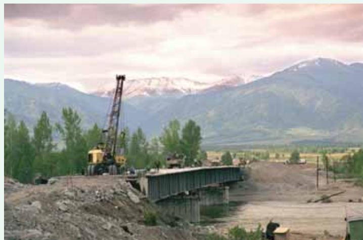
Мост через Катунь