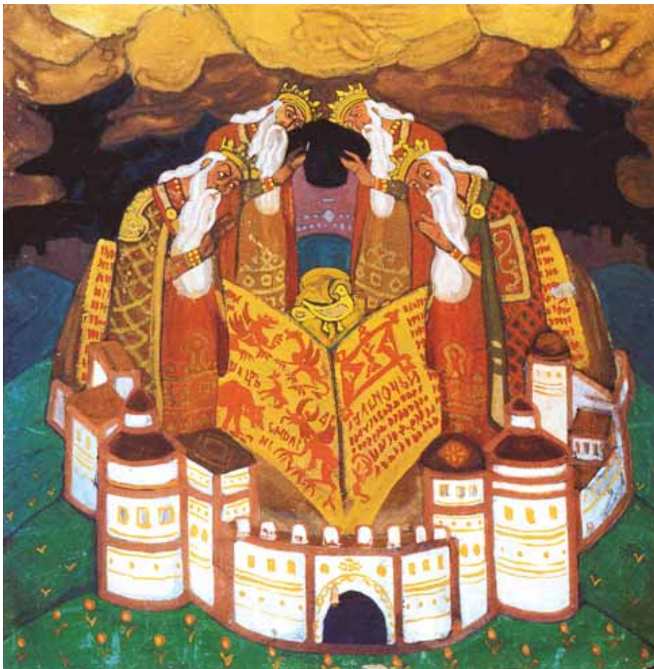
Н.К.Рерих. ПОМИН О ЧЕТЫРЁХ КОРОЛЯХ. 1911

глубокое символическое содержание. Ведь искусство для него было лишь одним из способов познания мира, постижения вечных и непреходящих Начал жизни. Эти великие несказуемые основы художник выражает языком глубокозначительного символа.