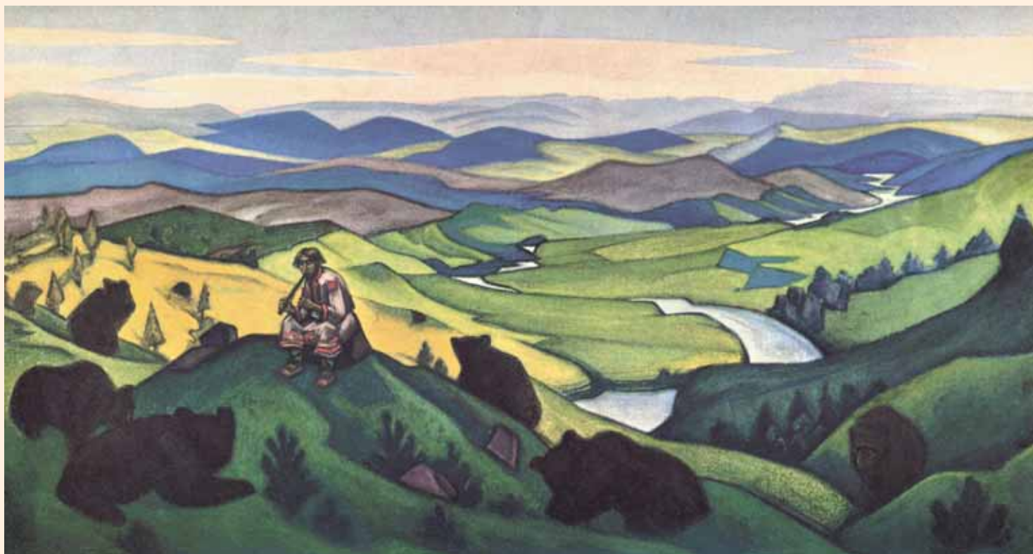
Н.К.Рерих. ЧАРА ЗВЕРИНАЯ. 1943

Сколько прекрасных сказаний от самых древнейших времён утверждает значение божественных созвучий. В назидание всем поколениям оставлен миф об Орфее, чаровавшем зверей и всё живущее своею дивною игрою. ...Сколько прекрасных подвигов человеческих остались бы несовершёнными, если бы они не были сопровождаемы вдохновляющим пением и музыкой.