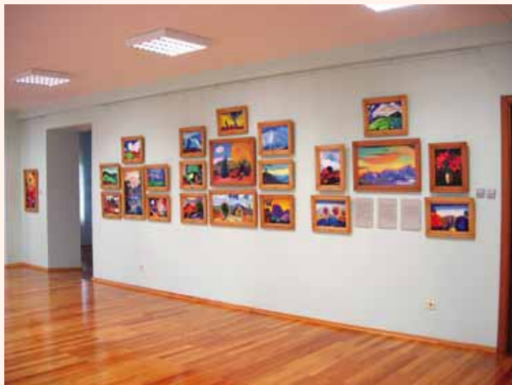
Зал С.Н. Рериха

В следующем зале — экспозиция, посвящённая Натальи Дмитриевне Спириной. Многочисленные