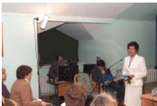
День рериховской поэзии