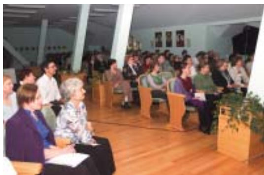
День рериховской поэзии