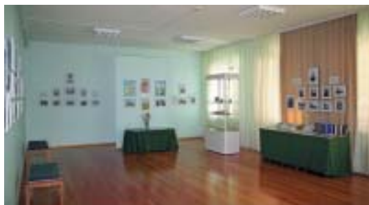
Выставка, посвящённая Н.Д.Спириной