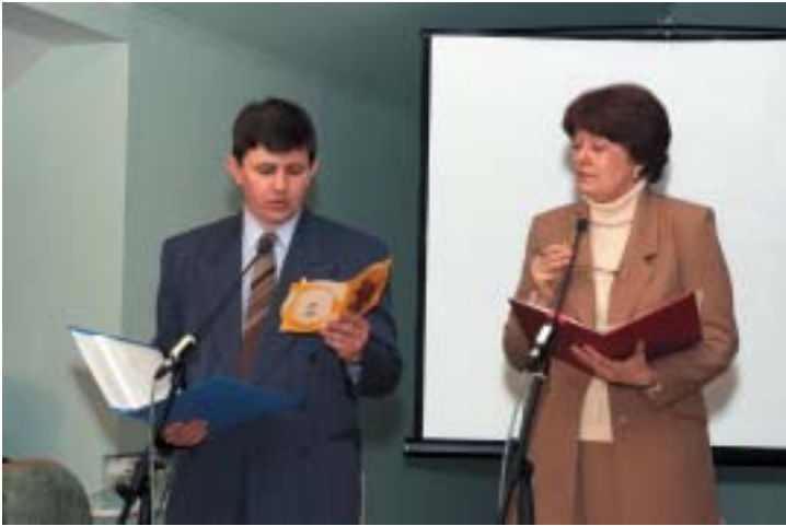
Зачитываются приветствия к Дню рериховской поэзии