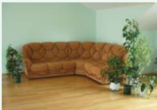
Зелёный уголок в концертном зале