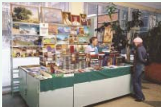
Книжный киоск СибРО в НГУ

за постоянную помощь Рериховскую группу из г. Екатеринбурга