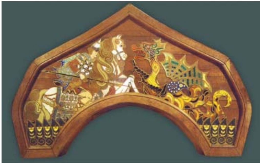
М.К.Тенишева. Картуш двери. 1911

Однако вслед за этим Тенишева подверглась ярким нападкам на родине. Было начато судебное дело «о разграблении ризницы смоленского Успенского собора», в чём обвинили Марию Клавдиевну, которая