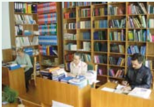
Читальный зал библиотеки