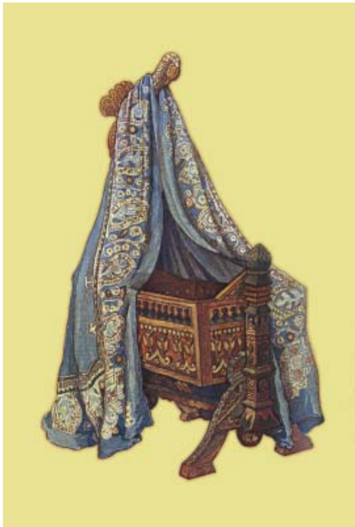
Колыбель, изготовленная по эскизам М.К.Тенишевой

«Сказка о семи богатырях» — опера на музыку Фомина, «разыгранная под звуки гуслей и домбры здесь, в деревне, в театре-тереме, — всё это было красиво и трогательно, — вспоминал Маковский. — На миг воскресло древнее. Из глубины народного духа протянулись к нам золотые нити художественной грёзы. Колдовство искусства обратило сказку в желанную быль. И мы почуяли самое близкое, самое вечное».