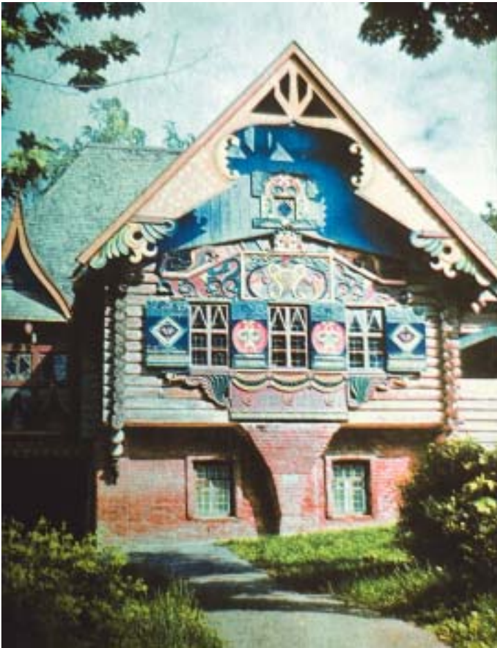
«Теремок» в Талашкине

нике выемчатой эмали: «Придите и владейте, мудрые. Влагаю дар мой в руцы ваша. Блюдите скрыню сию и да пребудут во веки сокровища ея во граде Смоленске на служение народа русского...»