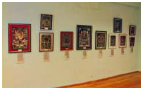
Новая экспозиция в Музее Н.К.Рериха