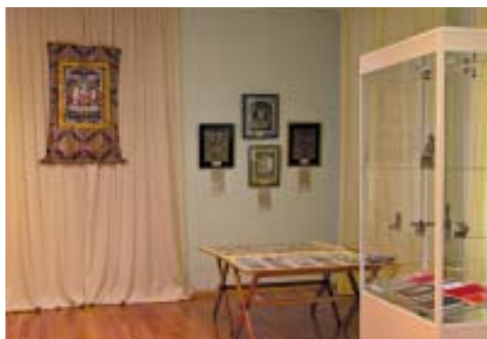
Новая экспозиция в Музее Н.К.Рериха