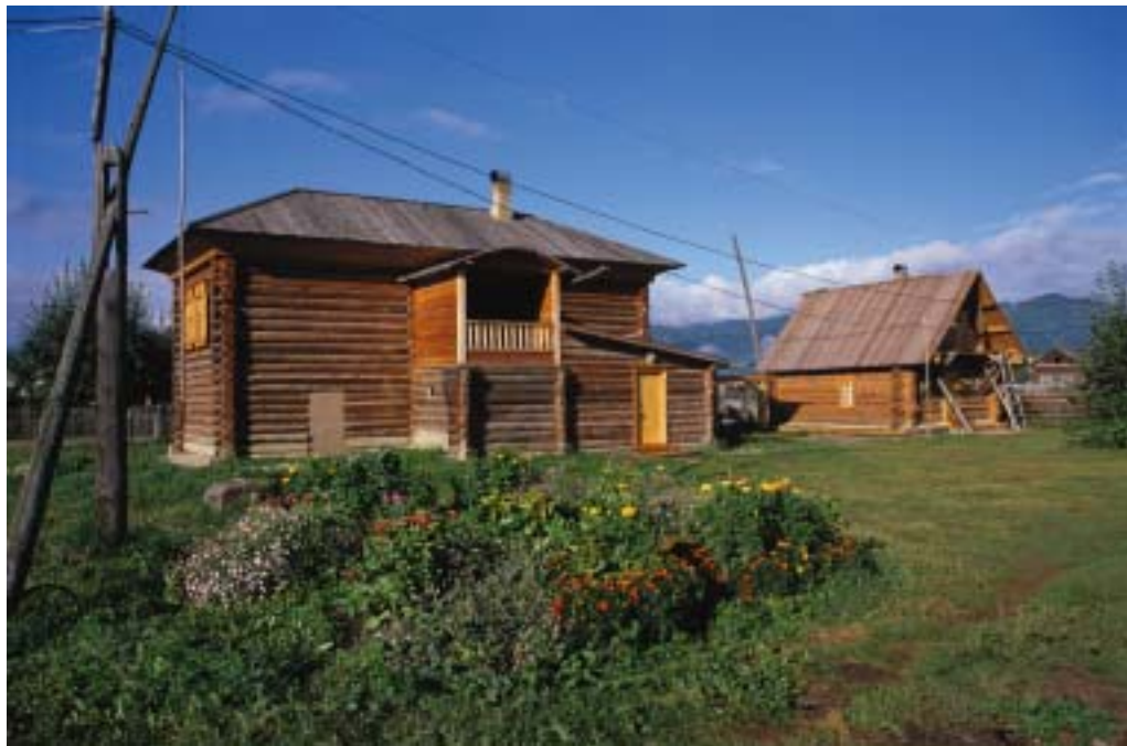
Музей Н.К.Рериха в с. Верхний Уймон. 2004

«Дорогие мои! Великое вам спасибо за то, что вы делаете такое нужное всем нам дело! Мы прикоснулись к духу удивительных людей, когда-то посетив-