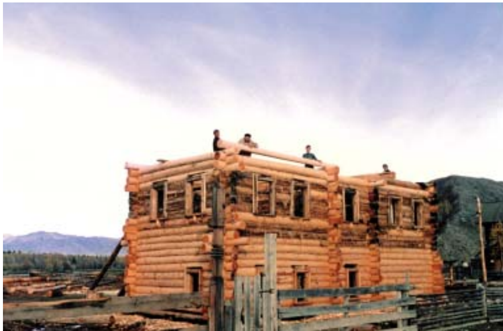
Восстановительные работы на усадьбе В.С.Атаманова. 1996

материала. В целом это составило примерно третью часть от двухэтажного дома.