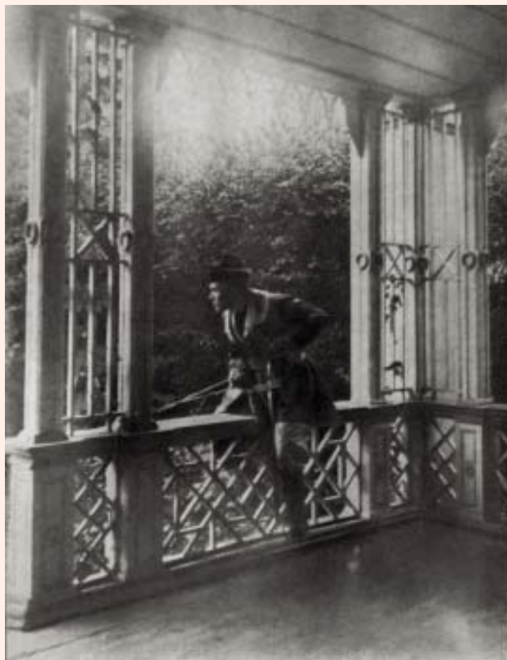
Н.К.Рерих в Изваре. 1897

Николай Константинович Рерих писал: «...Желающий прикоснуться к душе народа должен искать истоки» 10 . Можно уверенно сказать: желающему прикоснуться к истокам Николая Рериха непременно нужно побывать в Изваре.