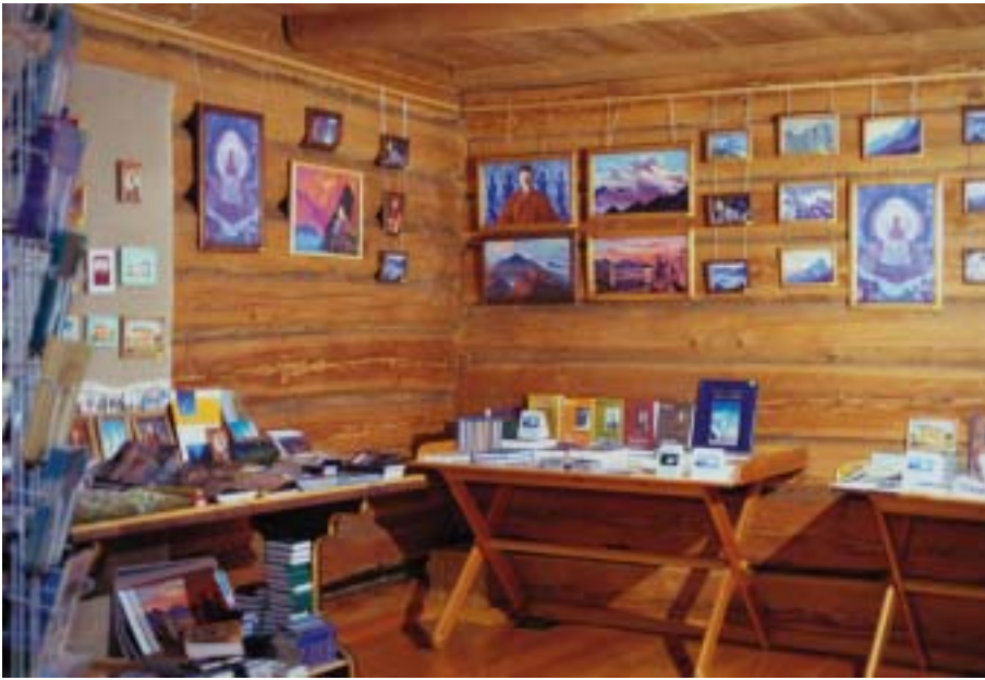
В Музее Н.К.Рериха, с. Верхний Уймон. 2004

профессий, специалисты-реставраторы, художники, историки за эту жемчужину в столь глухом краю Могучего Алтая.