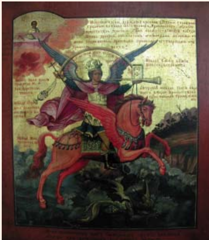
Архистратиг Михаил. Икона

старцы", и "Поход", и "Город строят". Читаются летописи» 6 .