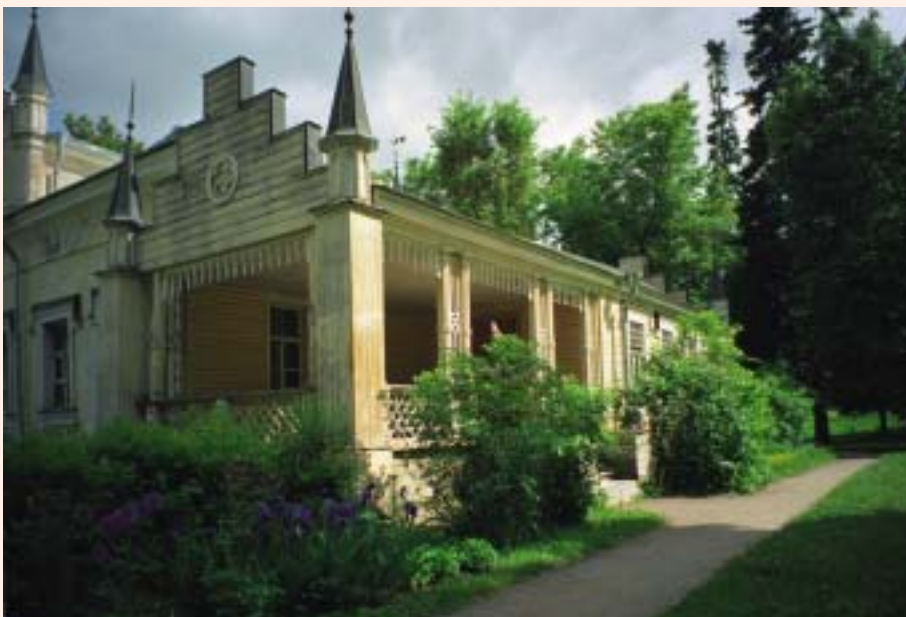
Музей-усадьба Н.К.Рериха в Изваре

Николай Константинович Рерих писал: «...Желающий прикоснуться к душе народа должен искать истоки» 10 . Можно уверенно сказать: желающему прикоснуться к истокам Николая Рериха непременно нужно побывать в Изваре.