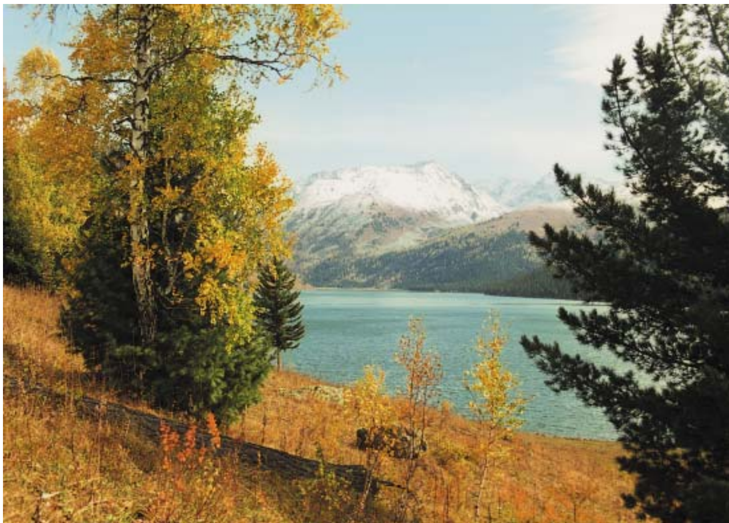
ОСЕНЬ НА АЛТАЕ.