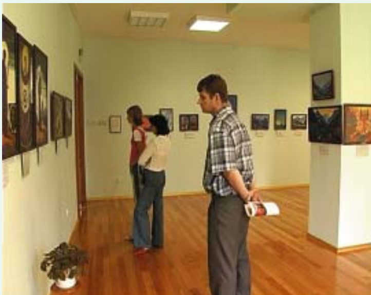
В выставочном зале Музея Н.К.Рериха

Один из выставочных залов посвящён Гималаям. Здесь можно мысленно перенестись в этот загадочный и ослепительно прекрасный мир гор.