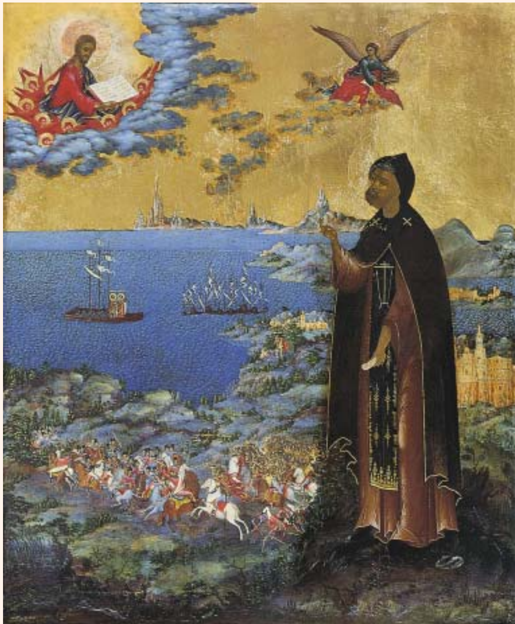
АЛЕКСАНДР НЕВСКИЙ. Икона. Нач. XIX в.

Спустя три века после ухода из жизни, на Московском соборе 1547 года, великий князь Александр Невский был причислен к лику святых.