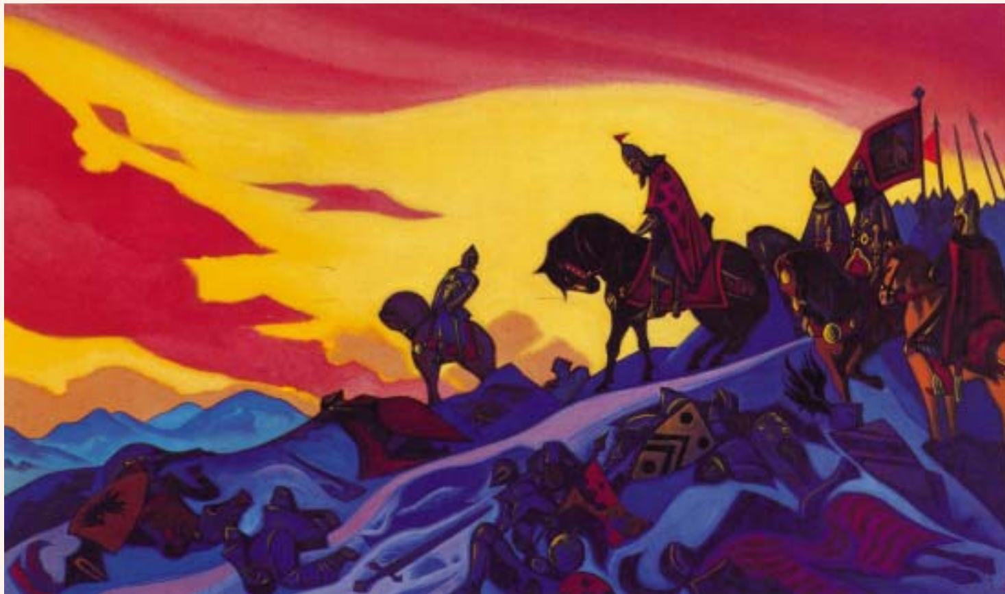
Н.К.Перих. АЛЕКСАНДР НЕВСКИЙ. 1942

битвах бывали, но таких удалцов не видали. Это люди крылатые, не знающие страха...» 6