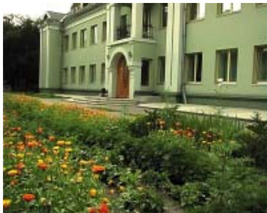
Музей Н.К.Рериха. Июль 2004