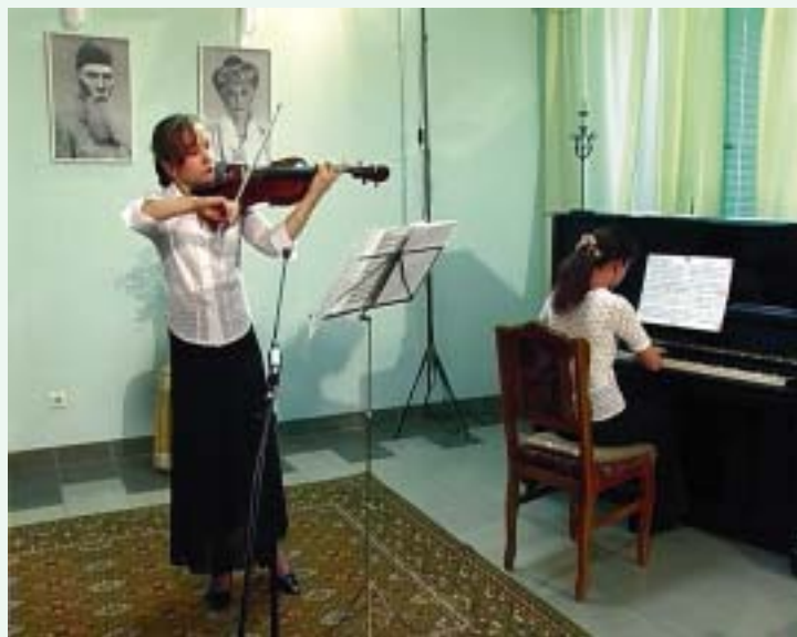
Концерт классической музыки