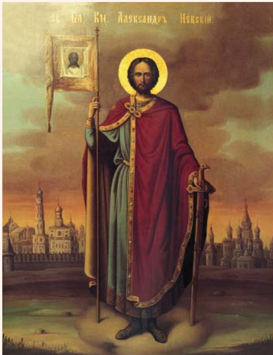
АЛЕКСАНДР НЕВСКИЙ. Икона. 1889

С 16-ти лет Александр стал княжить в Великом Новгороде. Он, ещё совсем молодым принимавший участие в походах отца, пришёлся по сердцу новгородцам. С ним уже тогда считались и друзья и враги, как в русских владениях, так и в других государствах. Но всё же отношения князя с неуёмным, свободолюбивым народом складывались не совсем просто. Все решения в городе принимались на Вече — общем собрании всех жителей. Права свободной вечевого республики при номинальной власти князя были для новгородцев священными. Если князь их не устраивал, то они со словами «тобе князь своё, а нам своё» отправляли его из города, как это было не один раз с отцом Александра, Ярославом Всеволодовичем. Молодому Александру, в отличие от отца, всё же как-то