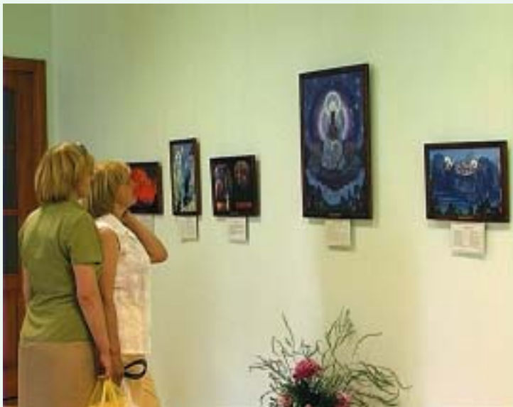
В выставочном зале Музея Н.К.Рериха

ный на Учении Живой Этики, утверждать данное к нашему сроку Учение и внутри себя, и в нашей внешней деятельности и непоколебимо верить в то, что Новый предуказанный Мир настанет. Необходимо постоянно держать контакт с Иерархией Света, для того чтобы в будущем через нас это озарение передавалось окружающим нас людям. Если мы будем крепко держаться нашего Фокуса, наших Старших, Они смогут лучше помочь через нас всей планете».