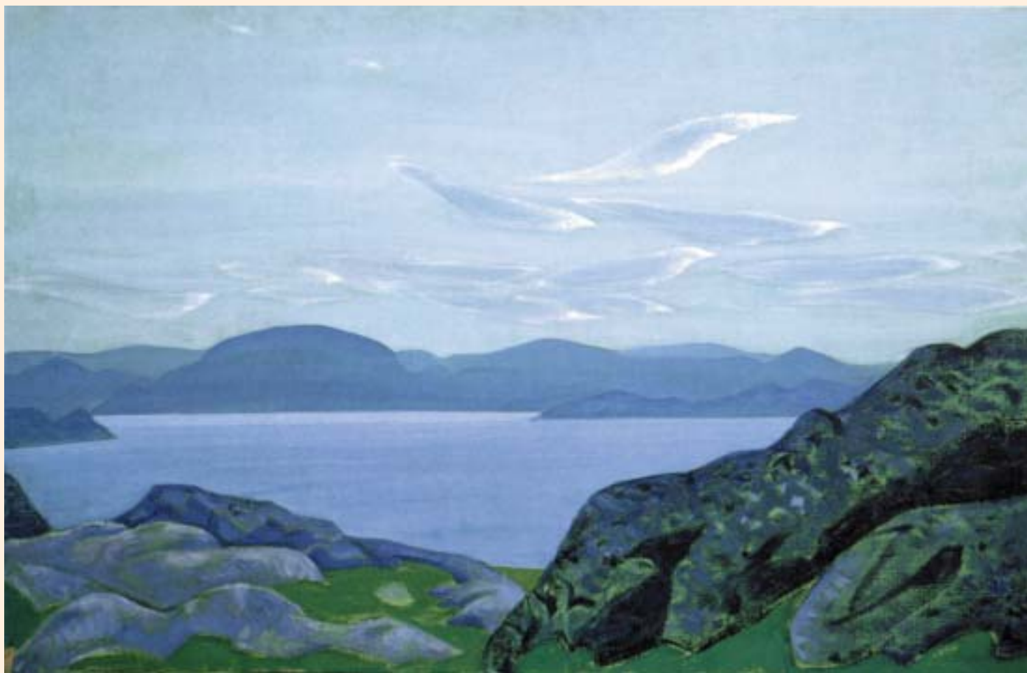
Н.К.Рерих. ВЕСТНИКИ УТРА. 1917

...Помни о Севере. Если кто-нибудь тебе скажет, что Север мрачен и беден, то знай, что он Севера не знает. Ту радость и бодрость, и силу, какую даёт Север, вряд ли можно найти в других местах. Но подойди к Северу без предубеждений. Где найдёшь такую синеву далей? Такое серебро вод? Такую звонкую медь полуночных восходов? Такое чудо северных сияний?