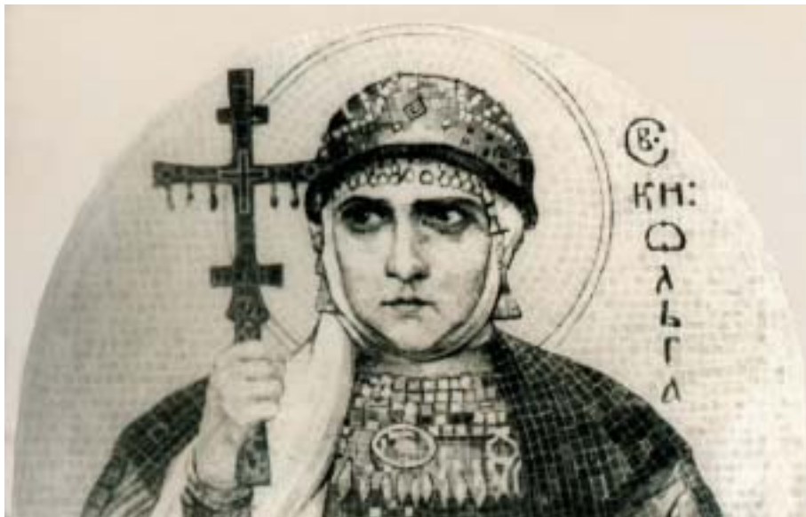
Н.К.Рерих. СВЯТАЯ ОЛЬГА. Мозаика. 1915

Далеко ли стремление просвещения от подвижничества? Легко ли было нести огонь веры среди полного мрака, одичания и невежества, и не только сохранить этот огонь, но вдохнуть его в свой народ для нового строительства? Сказано: «Благое дело творится, но подвиг незрим, ибо он в духе. (...) Много великих начинаний зарождалось в полной безвестности, но следствия их сделались явными миру, ибо сияли в веках. И много великих людей великими признаны были позднее, когда сбросили тело земное и в признании