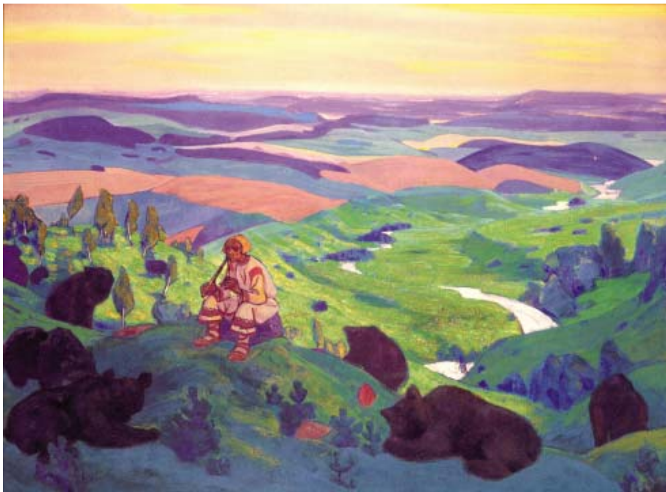
Н.К.Рерих. ЧЕЛОВЕЧЬИ ПРАОТЦЫ. 1911

милее и дороже. И, отстаивая внешне и внутренне каждую пядь земли, народ защищает её не только потому, что она своя, но потому что она красива и превосходна и, поистине, полна скрытых, великих значений. (...)