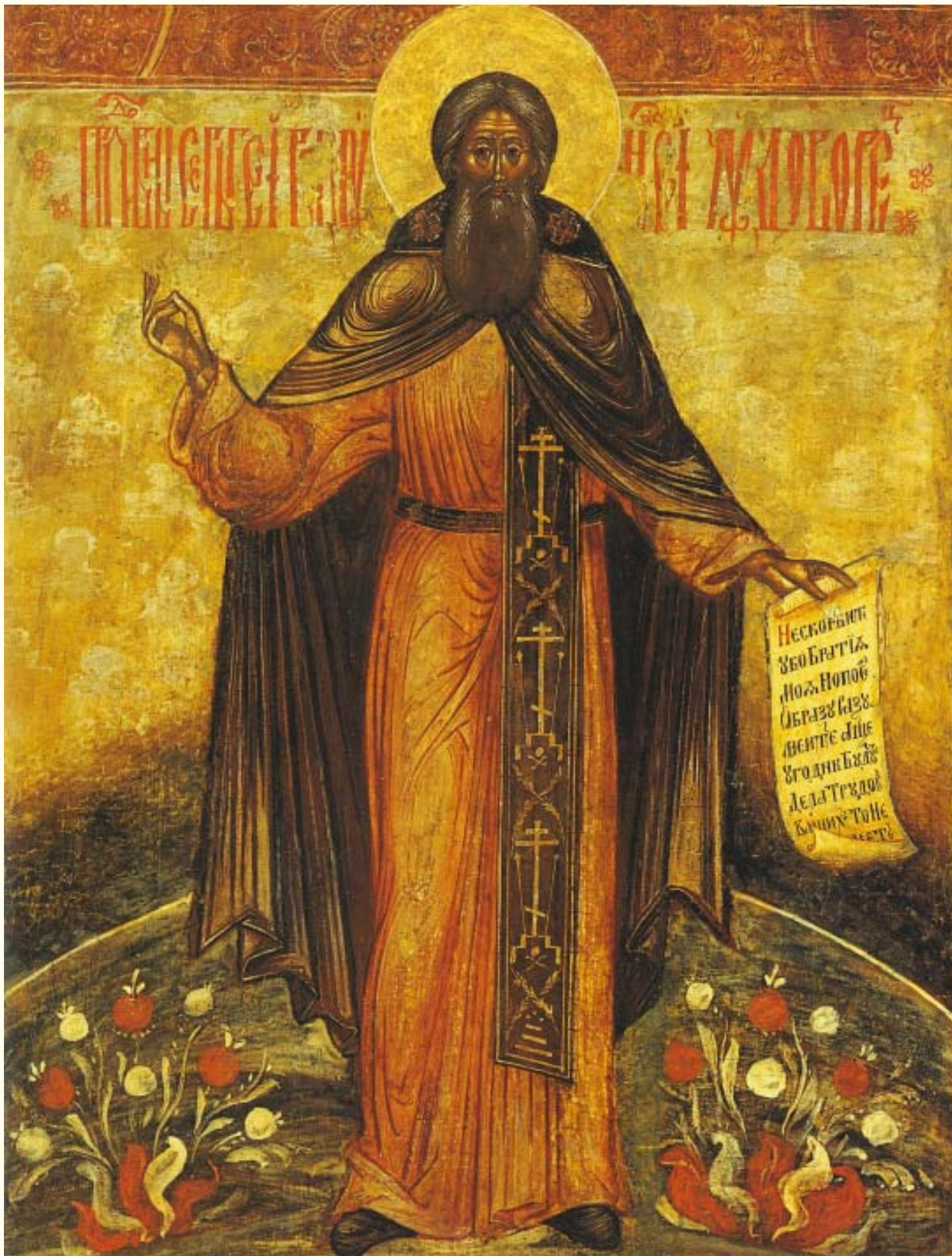
СЕРГИЙ РАДОНЕЖСКИЙ В ЖИТИИ. Центральная часть. Икона. XVII в.