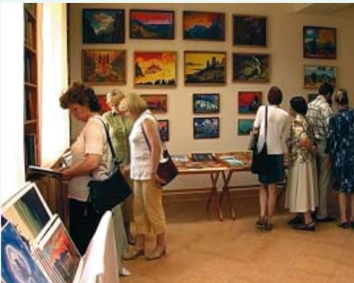
Киоск Музея Н.К.Рериха

«Явление Музея» смогло состояться только благодаря Высшей помощи и единению между сотрудниками и друзьями Сибирского Рериховского Общества. Ведь сколько здесь трудилось и продолжает трудиться друзей и помощников из разных городов и сёл России, понимающих, что только вместе, чувствуя надёжную поддержку друг друга, возможно созидание Музея.