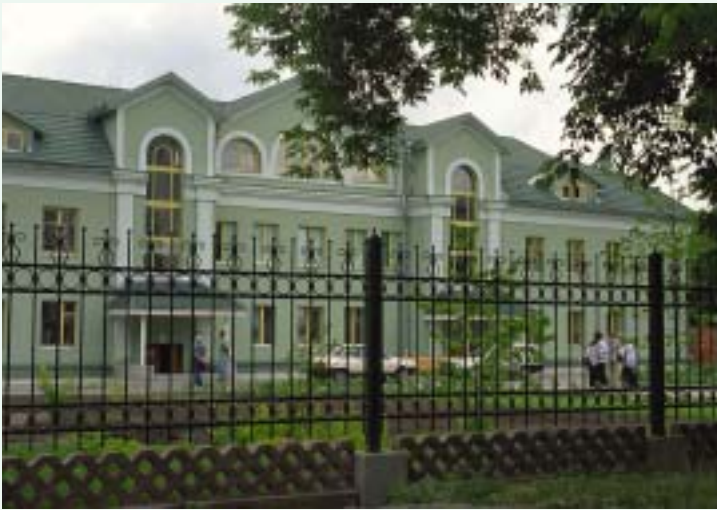
Музей Н.К.Рериха. 27 июня 2004 г.

В последнее воскресенье июня, когда в Новосибирске отмечается День города, Музей Н.К.Рериха проводит ДЕНЬ ОТКРЫТЫХ ДВЕРЕЙ — праздник, ставший уже традиционным. Родился он год назад, в 110-летний юбилей нашего города.