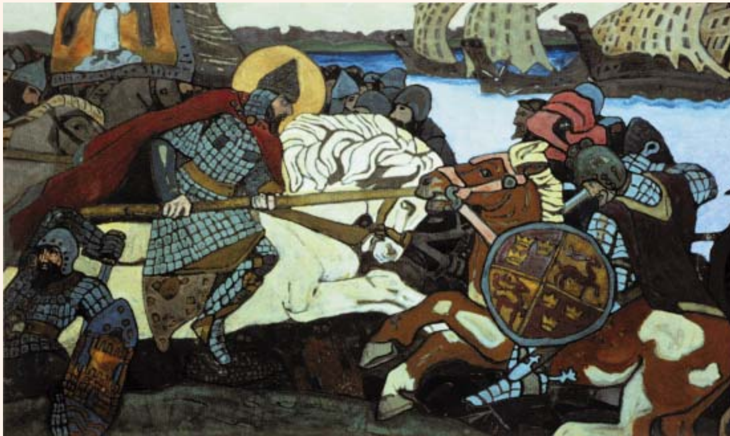
Н.К.Рерих. АЛЕКСАНДР НЕВСКИЙ ПОРАЖАЕТ ЯРЛА БИРГЕРА. 1904

я уже здесь, и разорю землю твою». Шведы планировали соединиться на берегу Невы с немецкими рыцарями и воевать совместными силами против Руси.