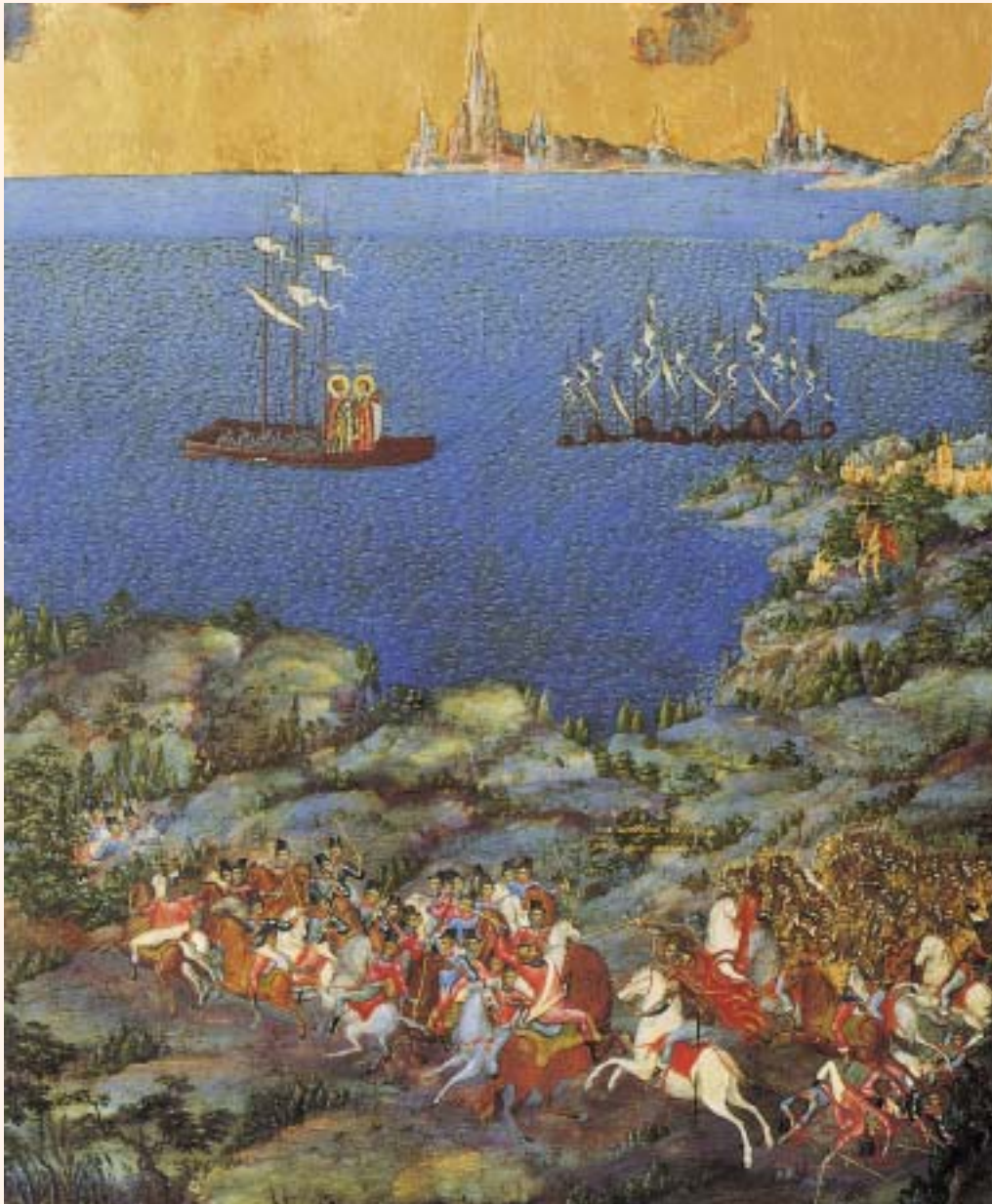
АЛЕКСАНДР НЕВСКИЙ. Фрагмент иконы

два года. Летописцы мало оставили сведений об этой поездке, но встречи с Ели-Чуцаем — мудрым последователем Конфуция и советником Чингиз-Хана — сам Александр считал знаменательными, имея в виду получение им глубочайших знаний Востока.