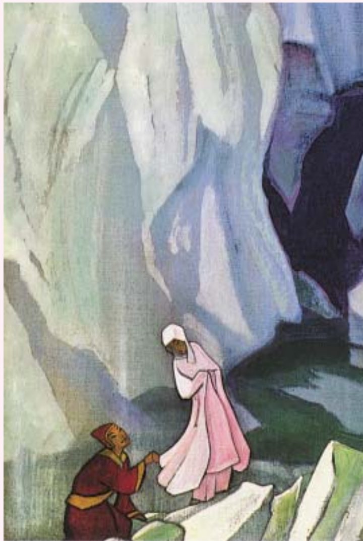
Н.К.Рерих. ВЕДУЩАЯ. 1932. Фрагмент

Во все века женщина была мечтой, улыбкой, грустью, вселенской радостью, безграничной печалью. Её звали Лаура, Елена, Нефертити, Ольга, Наталия, Мария... Многие из женских имён стали символами: преданности и верности — Пенелопа, красоты и женственности — Елена, вдохновения и почитания —