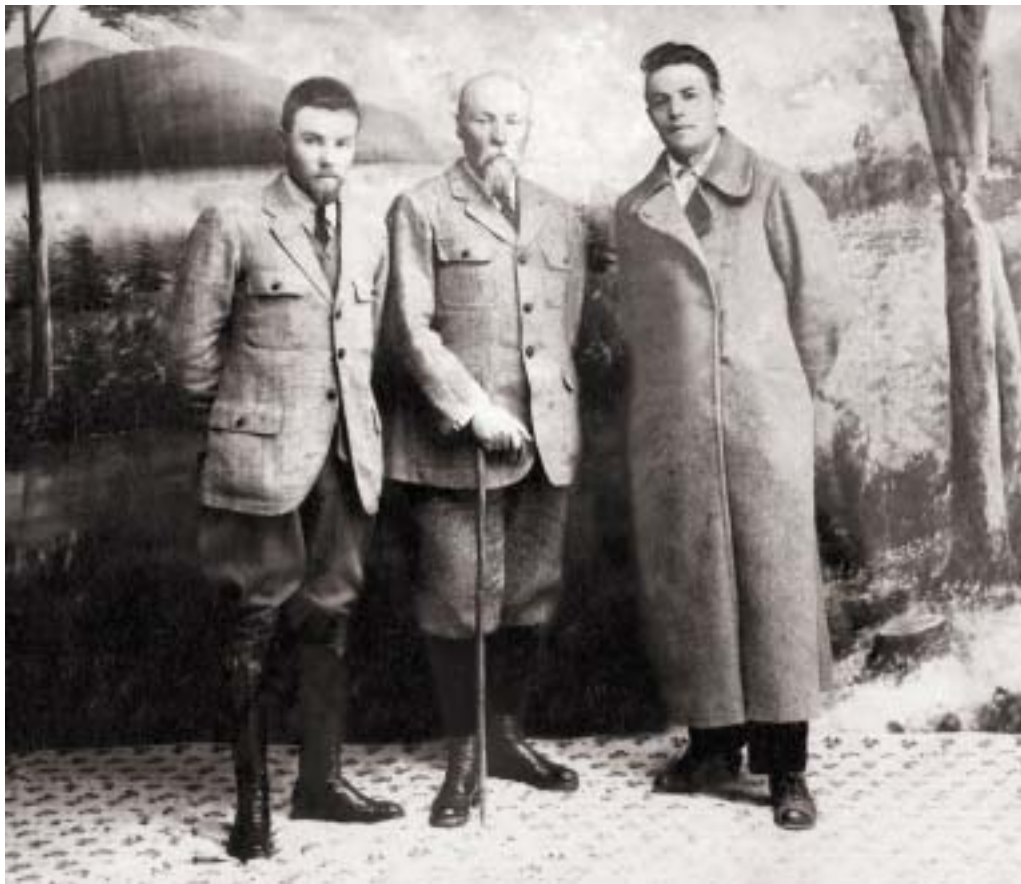
Ю.Н.Рерих, Н.К.Рерих, А.Е.Быстров. Урумчи, 1926.

искусство, образ жизни алтайского народа. Его интересовали и русские старообрядцы, которые с давних пор селились здесь, спасаясь от церковных реформ митрополита Никона.