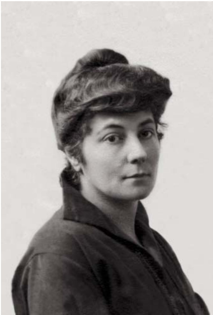
Е.И.РЕРИХ. 1920.

эволюция задержалась и растянулась бы на бесконечные века. Поэтому для ускорения так необходимы, именно, книги Учения, в которых собраны в сжатых, огненных формулах все знания, накопленные веками глубоких многосторонних опытов. В книгах Учения вдумчивый ученик найдёт ответ на самые сложные проблемы жизни, освещённые со многих сторон, так же как и много совершенно конкретных утверждений по всем отраслям науки. И правильный подход к науке может быть лишь после твёрдого, всестороннего усвоения Учения» 3 .