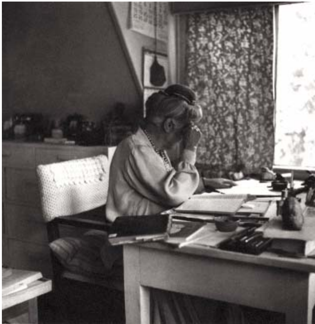
Е.И.РЕРИХ за рабочим столом. Индия, Калимпонг. 1950-55 гг.

для нашего времени, когда сама твердь планеты начинает трепетать от человеческого безбожия, невежества и всех проявлений чёрной магии и тёмных одержаний.