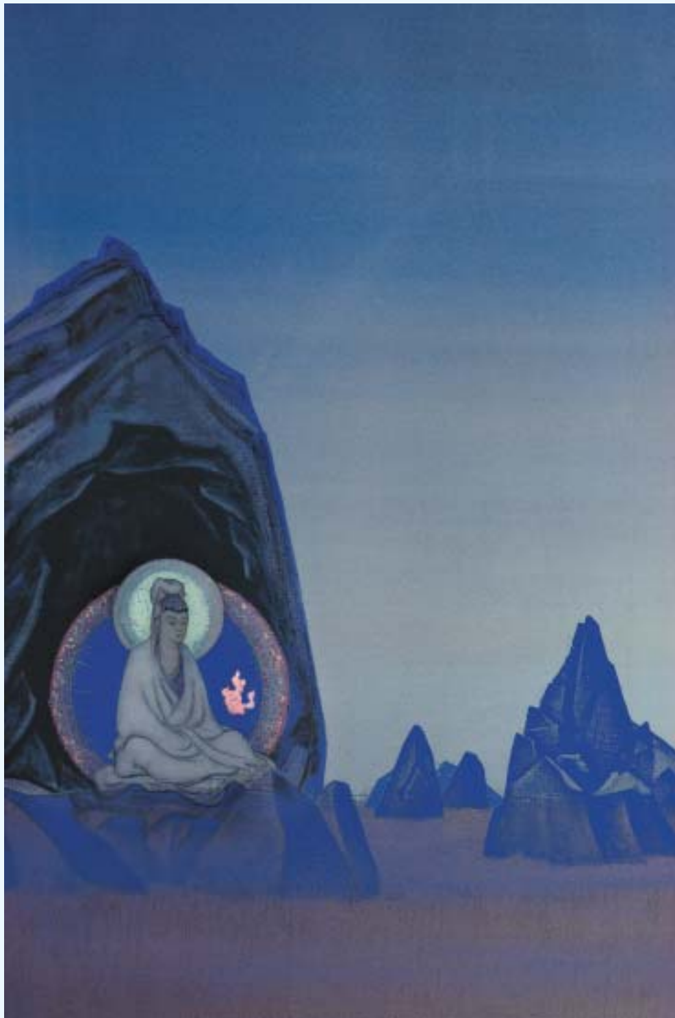
Н.К.Рерих. АГНИ-ЙОГА. 1928-1930