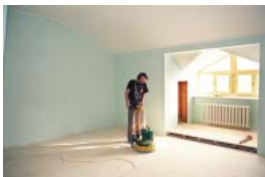
Шлифовка пола в помещении издательства