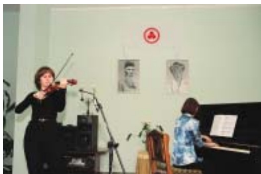
Концерт классической музыки