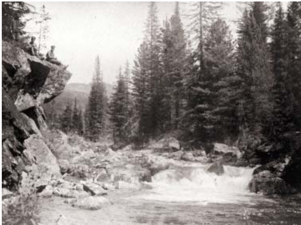
Маршрут экспедиции Рериха. Горный Алтай. 1926

Алтай — узел переселения народов, один из главных путей, по которому древние племена передвигались из Центра Азии на равнины Сибири и далее в Европу. Многие из них оставили здесь свои следы. Так, на Алтае находится множество древних захоронений. Ещё в каменном веке здесь жили люди, оставившие наскальные изображения — следы своеобразной культуры и философии. Николай Константинович и Юрий Николаевич на этом маршруте