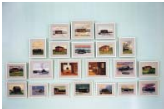
Алтайские пейзажи А.П.Веселёва