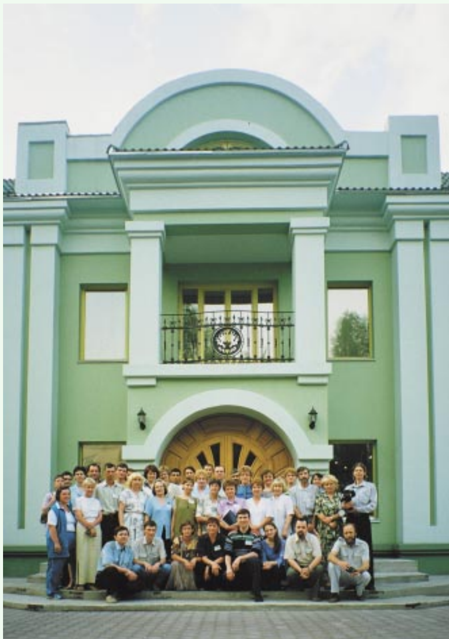
Сотрудники и друзья СибРО в ДЕНЬ ОТКРЫТЫХ ДВЕРЕЙ около Музея Н.К.Рериха, 29 июня 2003 г.

Хотелось, конечно, сдать первую очередь строительства к юбилейной для города дате. И многие имущие люди обещали помощь (впрочем, и сейчас от своих обещаний не отказываются), но — кому-то одно помешало, кому-то другое... Не успели, не получилось. Ну