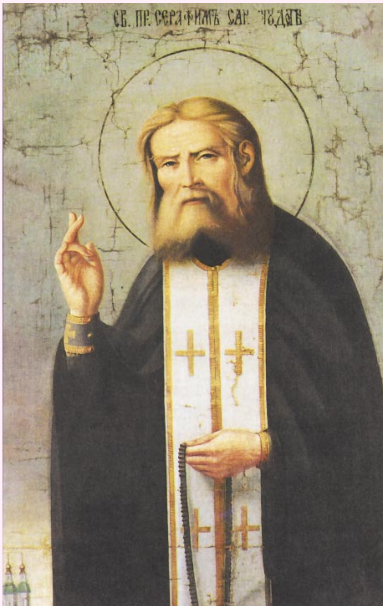
ПРЕПОДОБНЫЙ СЕРАФИМ САРОВСКИЙ. Икона