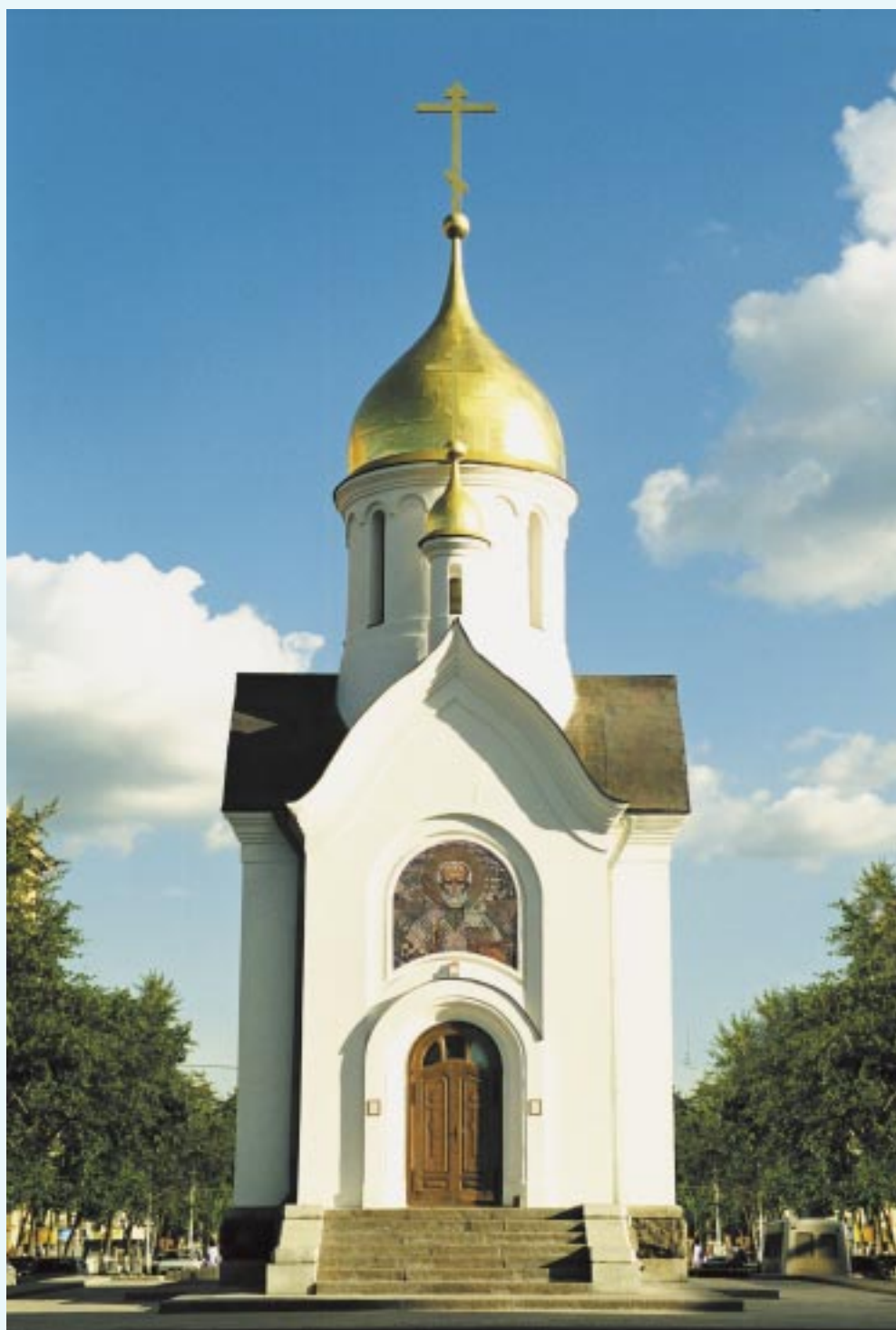
ЧАСОВНЯ СВЯТИТЕЛЯ НИКОЛАЯ в г. Новосибирске (Новониколаевске)

Издание Сибирского Рериховского Общества, № 7 (111), Июль, 2003