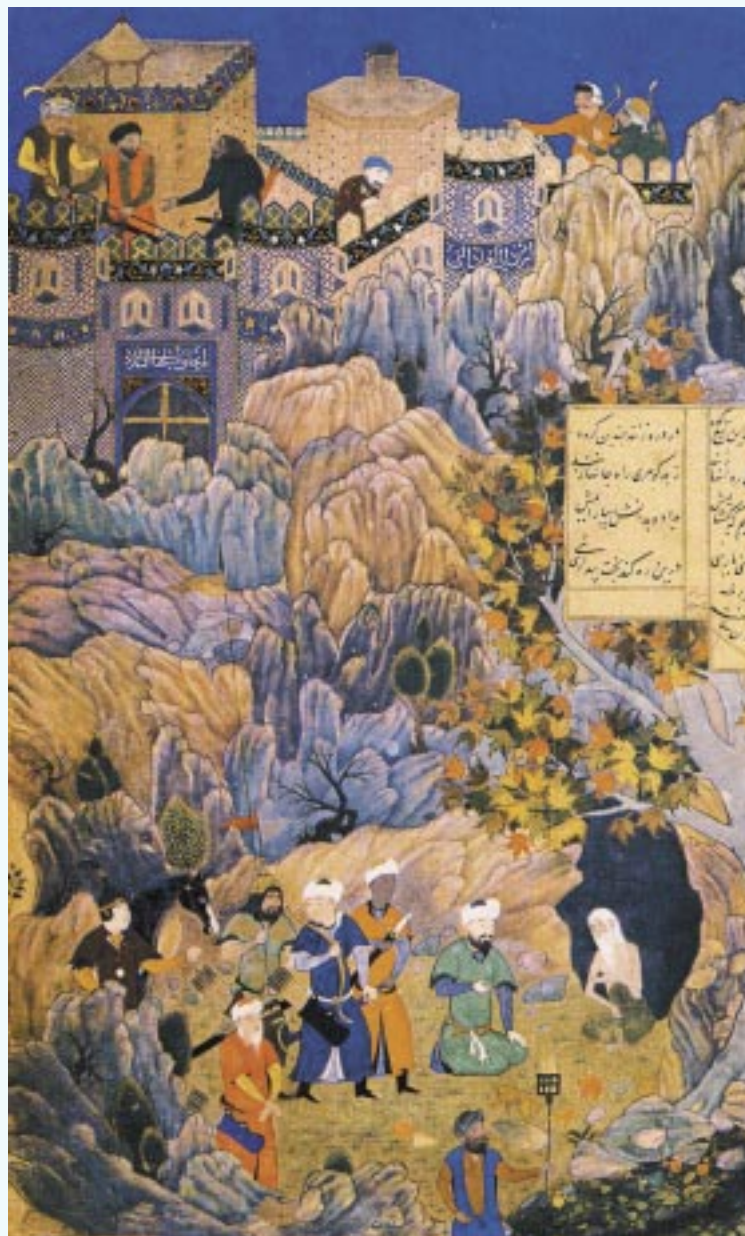
ИСКАНДЕР У ДЕРВИША-МУДРЕЦА. «Хамсе», 1495. Лондон, Британский Музей

Персидские художники выработали каноническую композицию: на лоне природы, где повстречались правитель (шах) и отшельник (дервиш), последний адресует венценосцу призыв к справедливости и разумному правлению. С простотой, лаконичностью и убедительностью Николай Константинович художественно претворяет традиционные образы. Он сохраняет все особенности миниатюры, её композицию, силуэтность и плоскостность фигур, чистоту и яркость красок, но вместо пышной челяди и дворцов, украшенных с восточной декоративностью — бескрайний про-