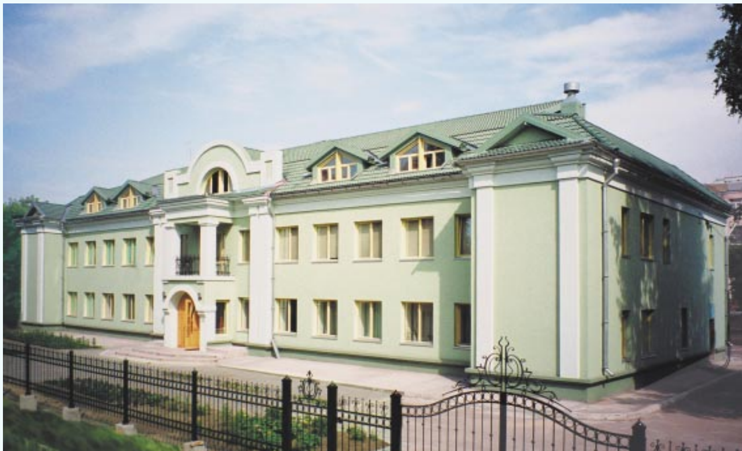
МУЗЕЙ Н.К.РЕРИХА в г. Новосибирске. Июль 2003 г.

(то есть Записей Б.Н.Абрамова). Необходимо обращаться к Высшему, читать, наполнять благими мыслями пространство и чётко представлять себе, какое будущее мы хотим иметь для человечества, верить в нашу будущую судьбу, которая нам предназначена. Ведь говорится в книге «Зов»: «...Укрепляйте глаза, чтобы не ослепнуть, когда Приоткрою край завесы Грядущего» 2 . В России это будет особенно прекрасно, но в это надо твёрдо верить и всемерно утверждать. Это будущее уже создано в Высших Сферах, но нужно воплотить его на земном плане. Наша задача — помочь Иерархии Света в этом спасительном труде. Этой цели служат и созидающийся Музей Н.К.Рериха в Новосибирске, и журнал «На Восходе», и наши «круглые» и «квадратные» столы, и секции, и беседы, и творчество сотрудников Рериховского Общества; и мысли наши должны постоянно работать в этом направлении.