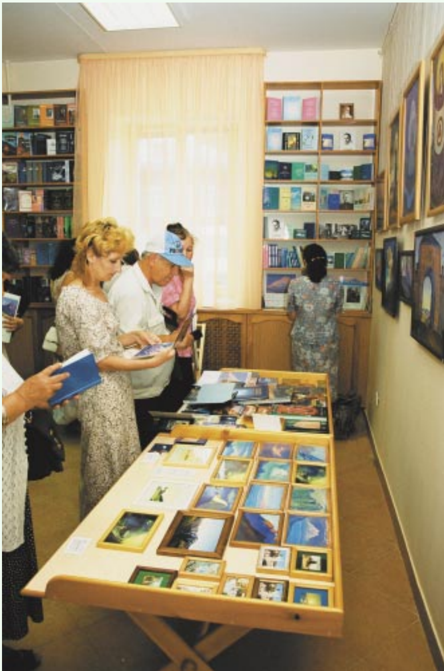
Книжный салон Музея Н.К.Рериха в ДНИ ОТКРЫТЫХ ДВЕРЕЙ

И не боимся поношений. Мы знаем — в тот Музей придут Посланцы новых поколений, Которых неотложно ждут.