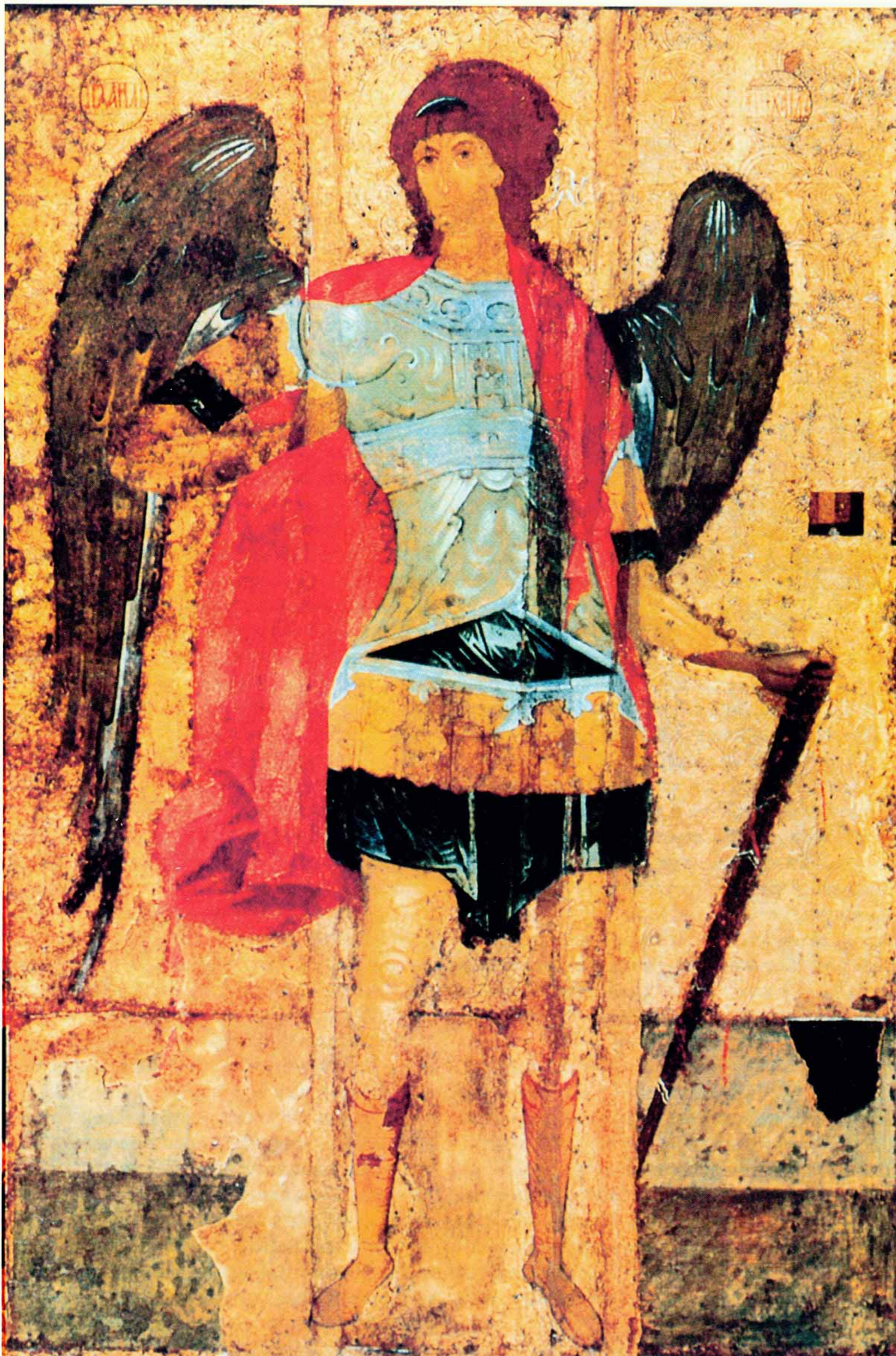
АРХАНГЕЛ МИХАИЛ С ДЕЯНИЯМИ (фрагмент). Икона. XV в.