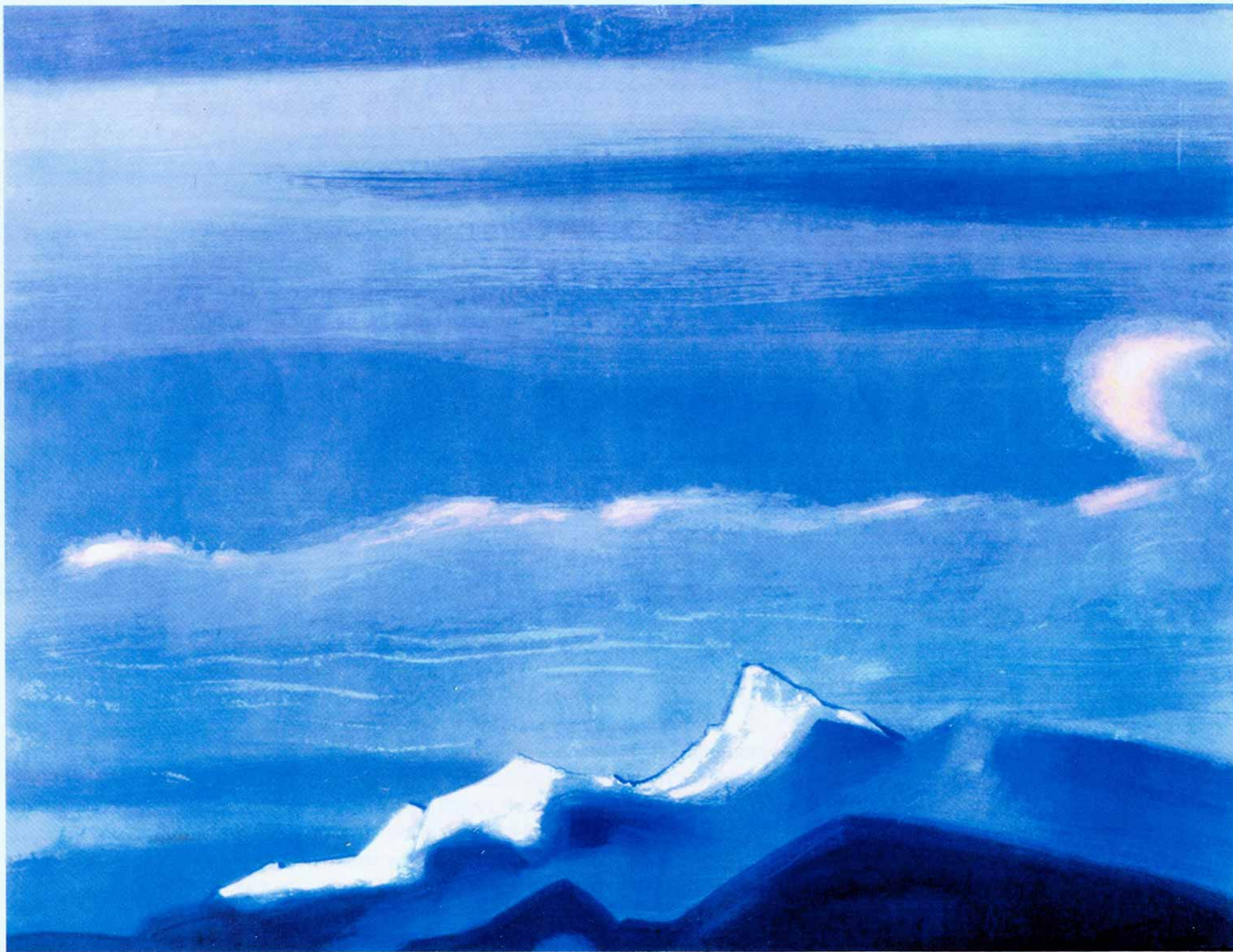
С.Н.Рерих. ГИМАЛАИ. 1971

время идёт чудовищное умаление Красоты, затемнение этого высшего принципа Бытия. И если понимание любви человек уже свёл до чисто физиологического уровня, то понятие красоты ещё не успело так извратиться. Будем беречь понятие красоты, зорко распознавать, где глубина и Свет красоты, а где блеск и внешность красивости. Ведь красивость есть не что иное, как лоск цивилизации, и далека от истинной красоты. И если вы видите яркие цветные вывески, пёстро-разноцветные обёртки и рекламы, «последний писк» моды — не говорите «красота», не унижайте великого понятия, данного нам для радости духа, а не для эмоций. «Хорошо показать людям суровое правдивое суждение о явлении истинного и глубокого творчества. Худо примиряться пустой внешностью и шумихой балагана».