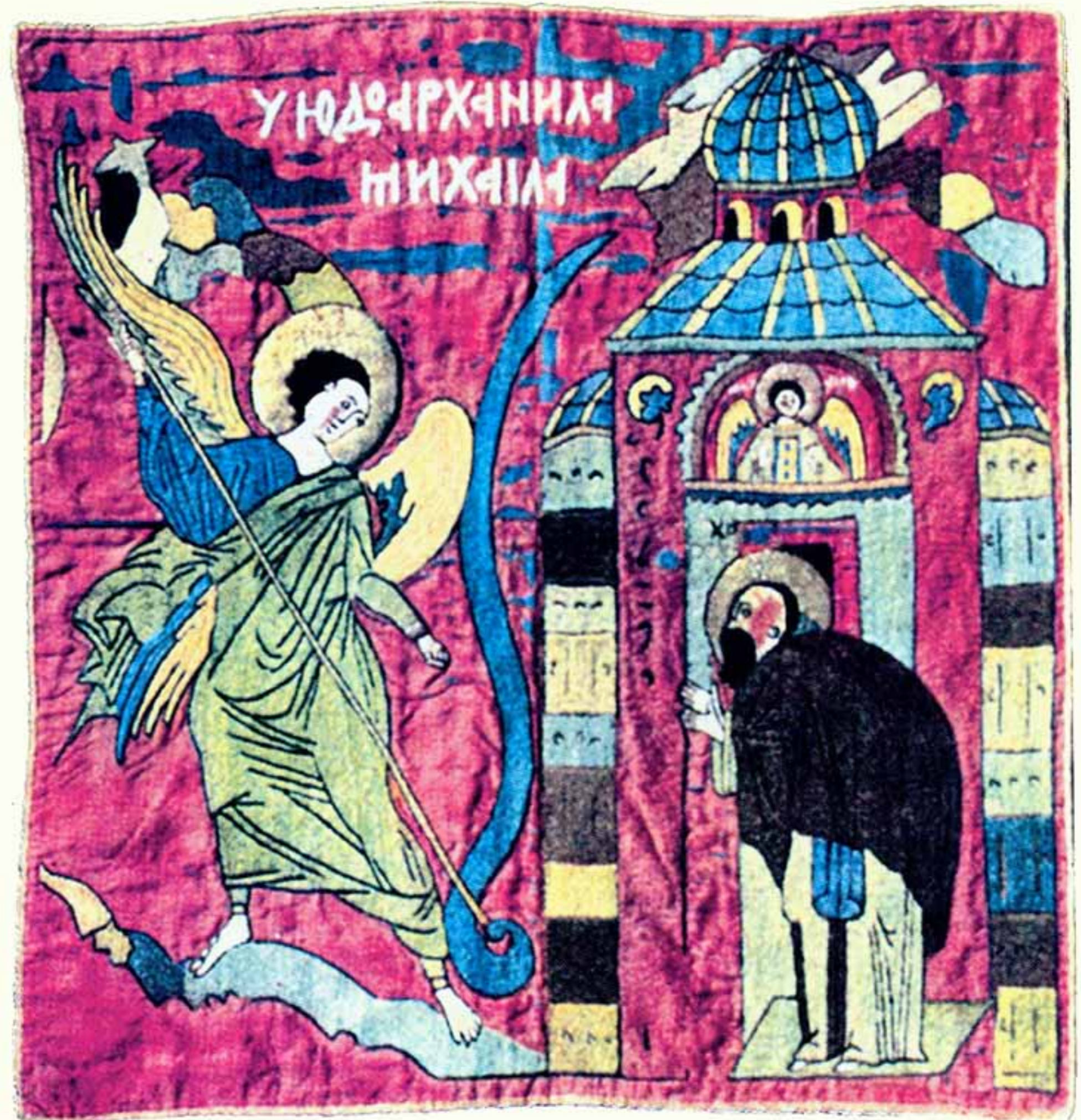
ЧУДО АРХАНГЕЛА МИХАИЛА В ХОНИЯХ (фрагмент) Вышивка. XV в.

Вот как описывает этот эпизод Марк Твен в своей книге о Жанне д'Арк от лица своего героя: «Однажды — это было 15 мая 1428 года — я спустился с холма на опушку дубовой рощи... День был облачный, и вся поляна вокруг дерева была в густой тени. Жанна сидела на толстых, узловатых корнях бука, которые образовали подобие кресла. Руки её были сложены на коленях, голова склонена, и вся её поза выражала глубокую задумчивость; казалось, она унеслась куда-то далеко. Вдруг я увидел нечто