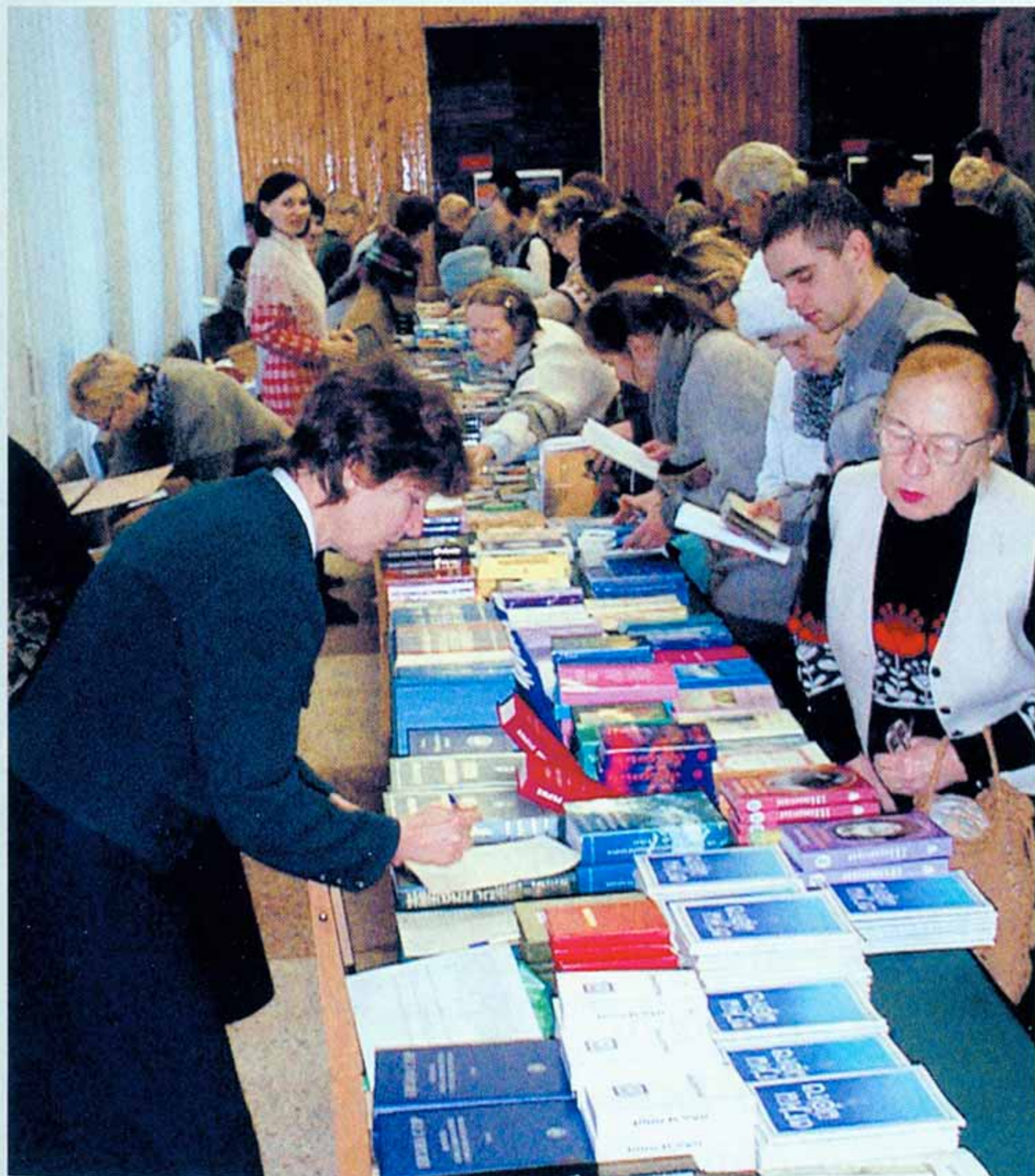
Книжный киоск на «круглом столе» 26.11.2000

Ответ: Совершенно правильно всё. И то и другое надо делать и можно делать. И представлять себя овладевшим нужным качеством, это очень помогает; представлять себя спокойной, уравновешенной, радостной, бодрой, несмотря ни на какие болезни. Это очень помогает — когда представляешь себя в нужном положении, образе. Когда начинаешь о себе думать как о больной, немощной — это страшно вредит. Можно представлять себя в конкретной ситуации с конкретными людьми. Полезно эти ситуации проигрывать и представлять, как бы ты себя повёл, а жизнь не скупится на таковые, так что можно не только представлять, но и без этого получать каждый день.