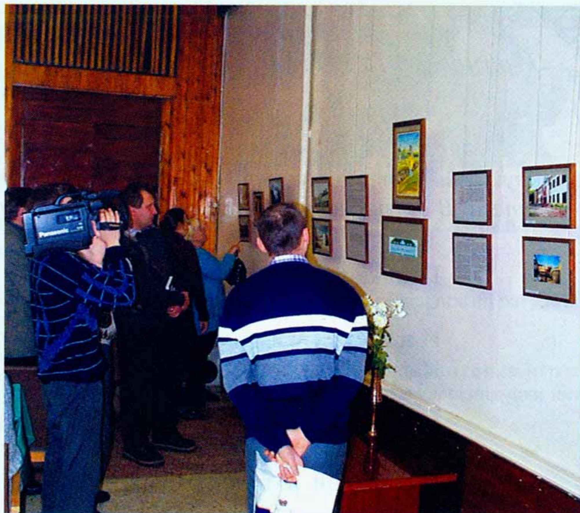
Выставка фотографий Музея им.Н.К.Рериха в Новосибирске на «круглом столе» 26.11.2000

Вопрос: «Грани Агни Йоги», VIII, § 192: «В Учении много говорится о верности и преданности, и всё же, несмотря на все предупреждения, число отходящих и отпадающих велико. Верить и быть верным вопреки очевидности способны только немногие. Остальные просто не