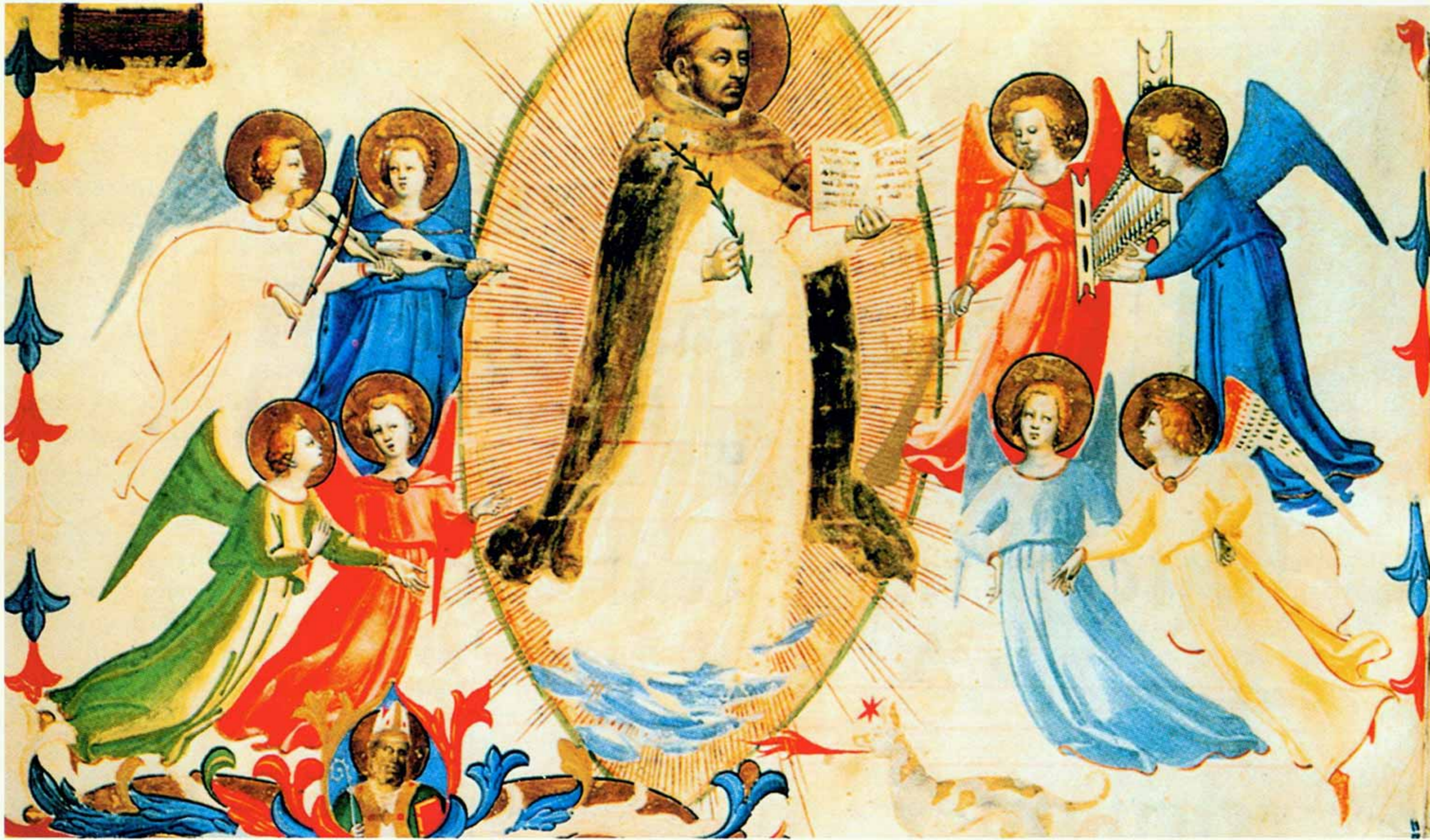
Фра Анджелико. ГЛОРИФИКАЦИЯ* СВЯТОГО ДОМИНИКА (фрагмент). Около 1430

что знак Божественного — Абсолютная Красота — есть причина и источник красоты видимой, красоты материального мира. В природе, в совершенных творениях рук человеческих — в искусстве — находим ответ той вечной, непреходящей Красоты. Также и жизнь человека может явиться утверждением божественной Красоты и Гармонии. Это произойдёт, когда каждое действие, слово, каждое чувство и каждый помысел будут соотнесены и приведены в соответствие с Образом Божиим, сокрытым в глубине души каждого человека, и настроены, подобно музыкальному инструменту, по закону высшей соразмерности и красоты.