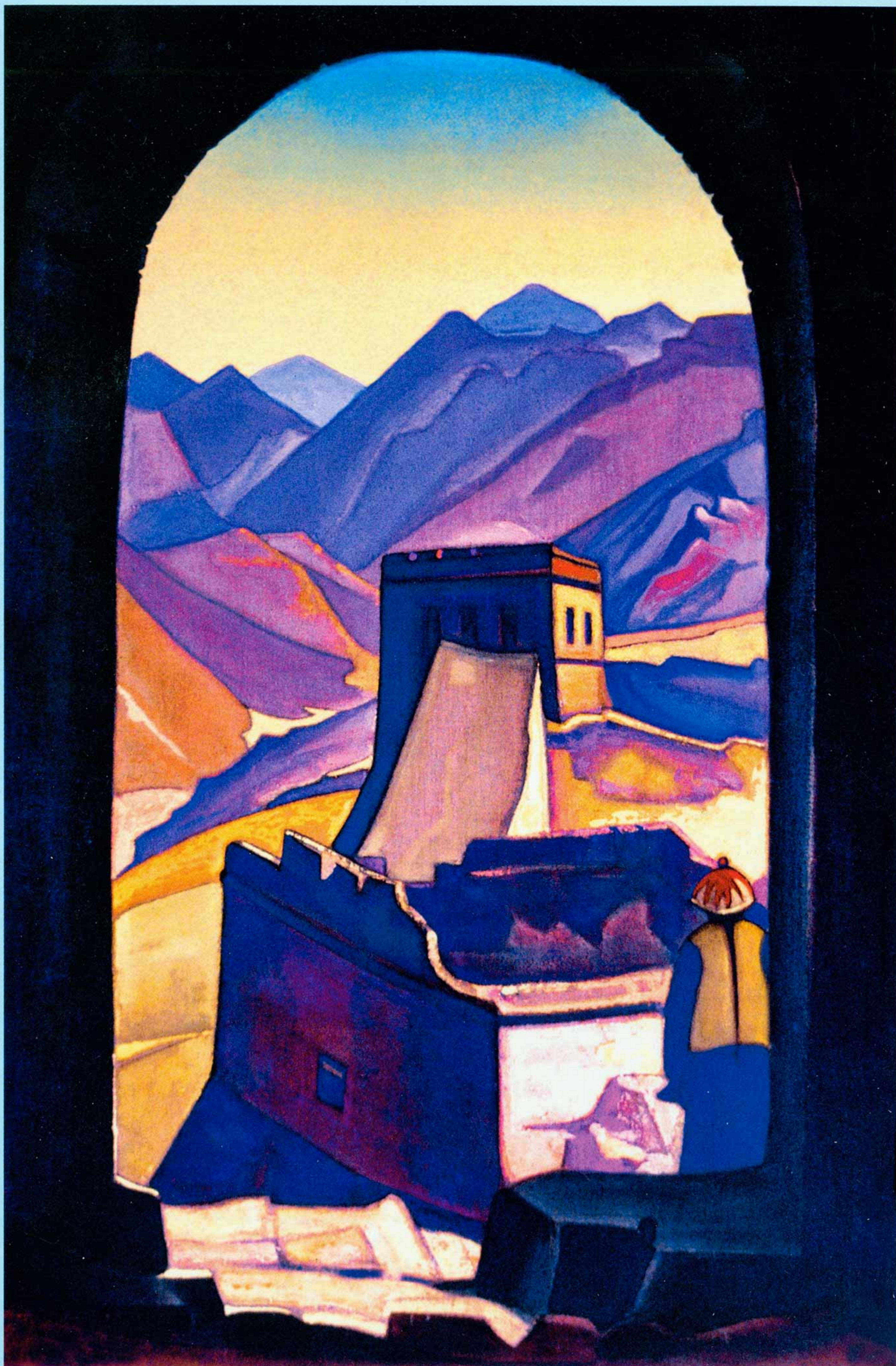
Н.К.Рерих. ВЕЛИКАЯ СТЕНА КИТАЯ. 1935 – 1936