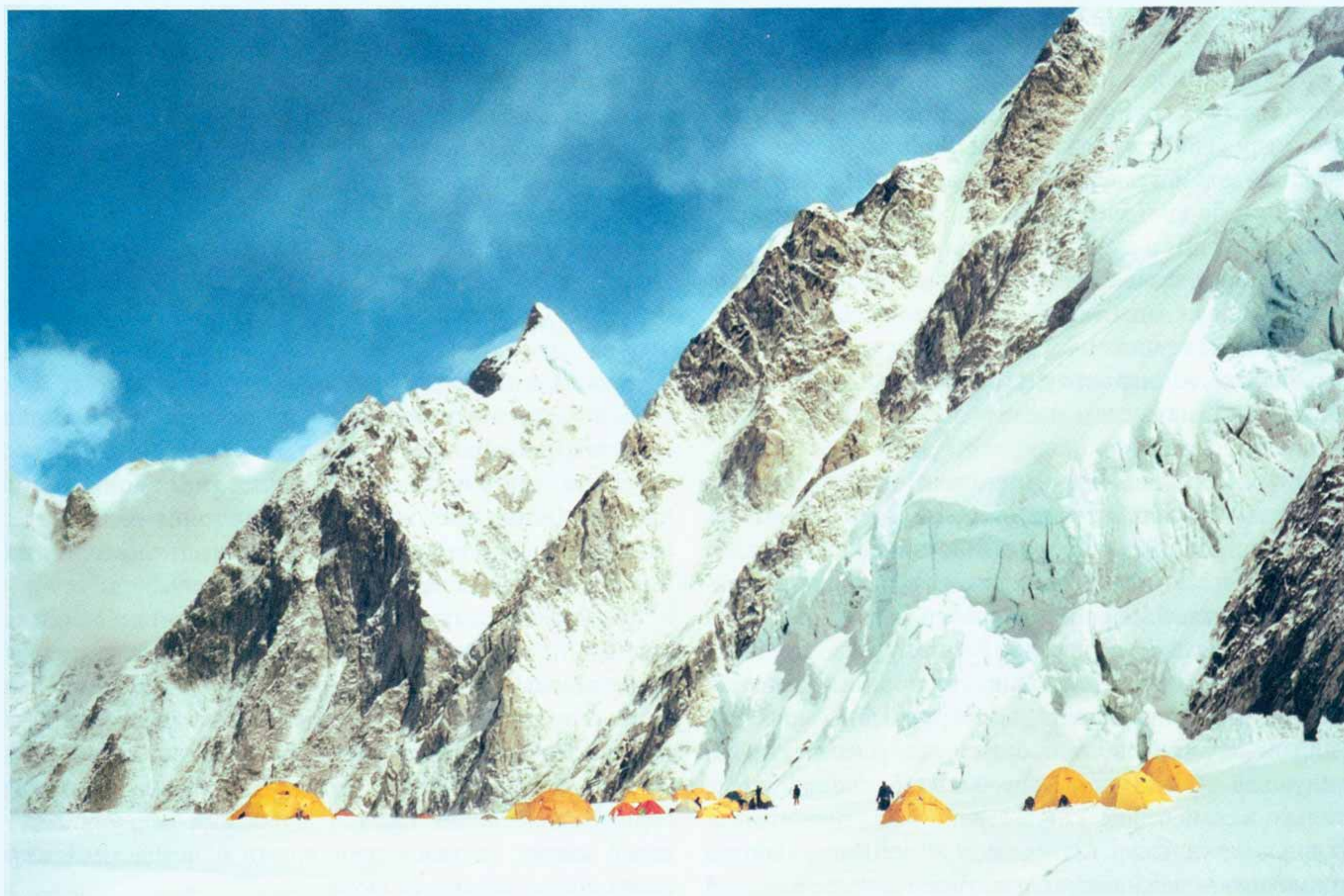
Палаточный лагерь I на высоте 6100 м на леднике Кхумбу в его верховьях. Май, 2000