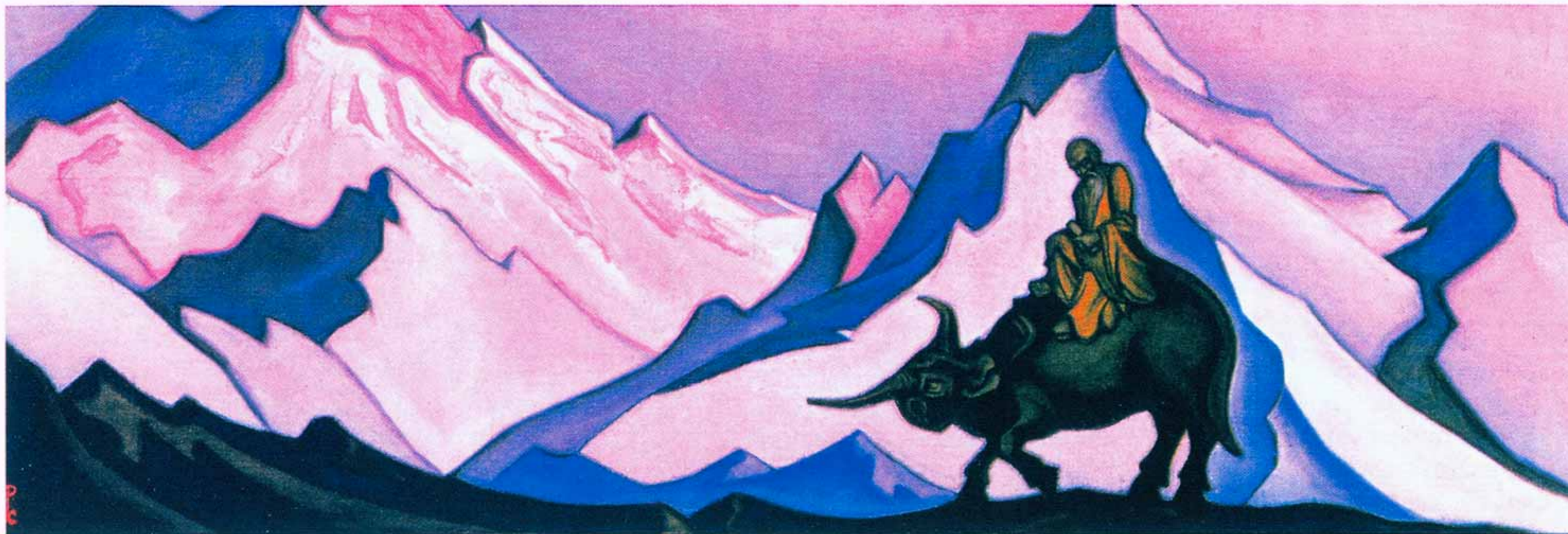
Н.К.Рерих. ЛАО-ЦЗЫ. 1943

«Довольный малым у Бога не забыт». Такой настрой есть то же основание спокойствия, к которому призывает Лао-Цзы. «Совсем спокоен тот, у кого нет желаний». Об этом же говорится в Бхагавад-Гите: «Когда человек отказался от всех желаний сердца, когда его Я нашло удовлетворение в Божественном Я, тогда он именуется "человеком со стойким умом". Тот, чей ум спокоен среди страданий, бесстрастен среди наслаждений, кто освободился от желаний, страха и гнева, тот именуется мудрецом со стойким умом. Тот, кто ни к чему не привязан, кто, встречая приятное и неприятное, не радуется и не ненавидит, разумение того установилось».