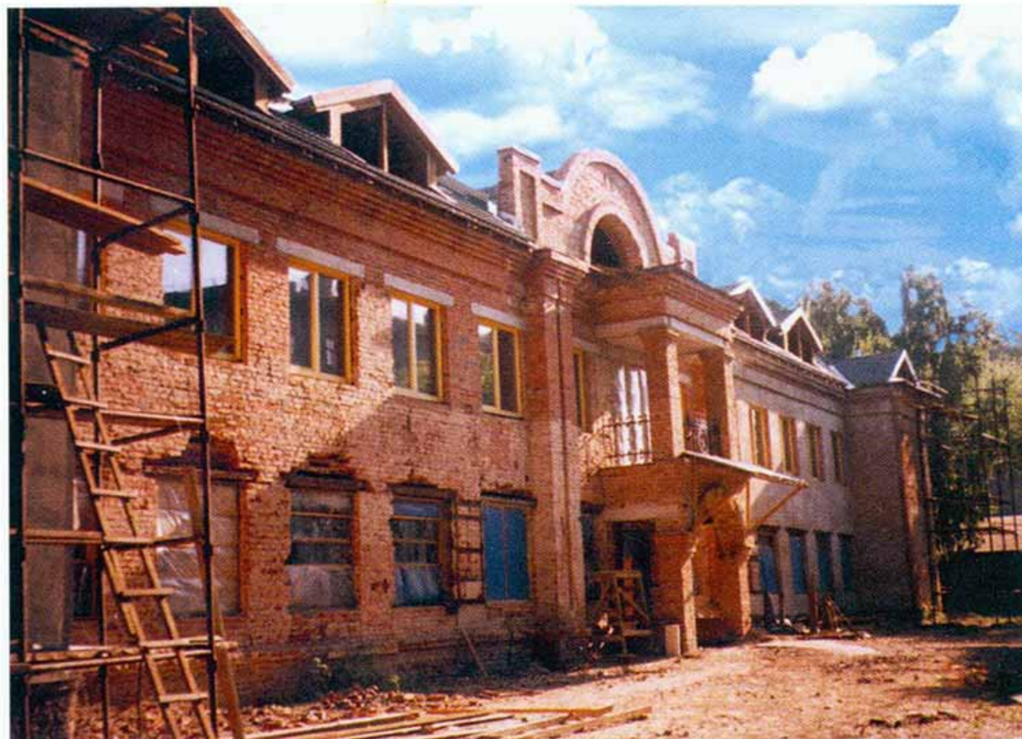
Музей им. Н.К.Рериха в Новосибирске, август 2000. Вставлены окна