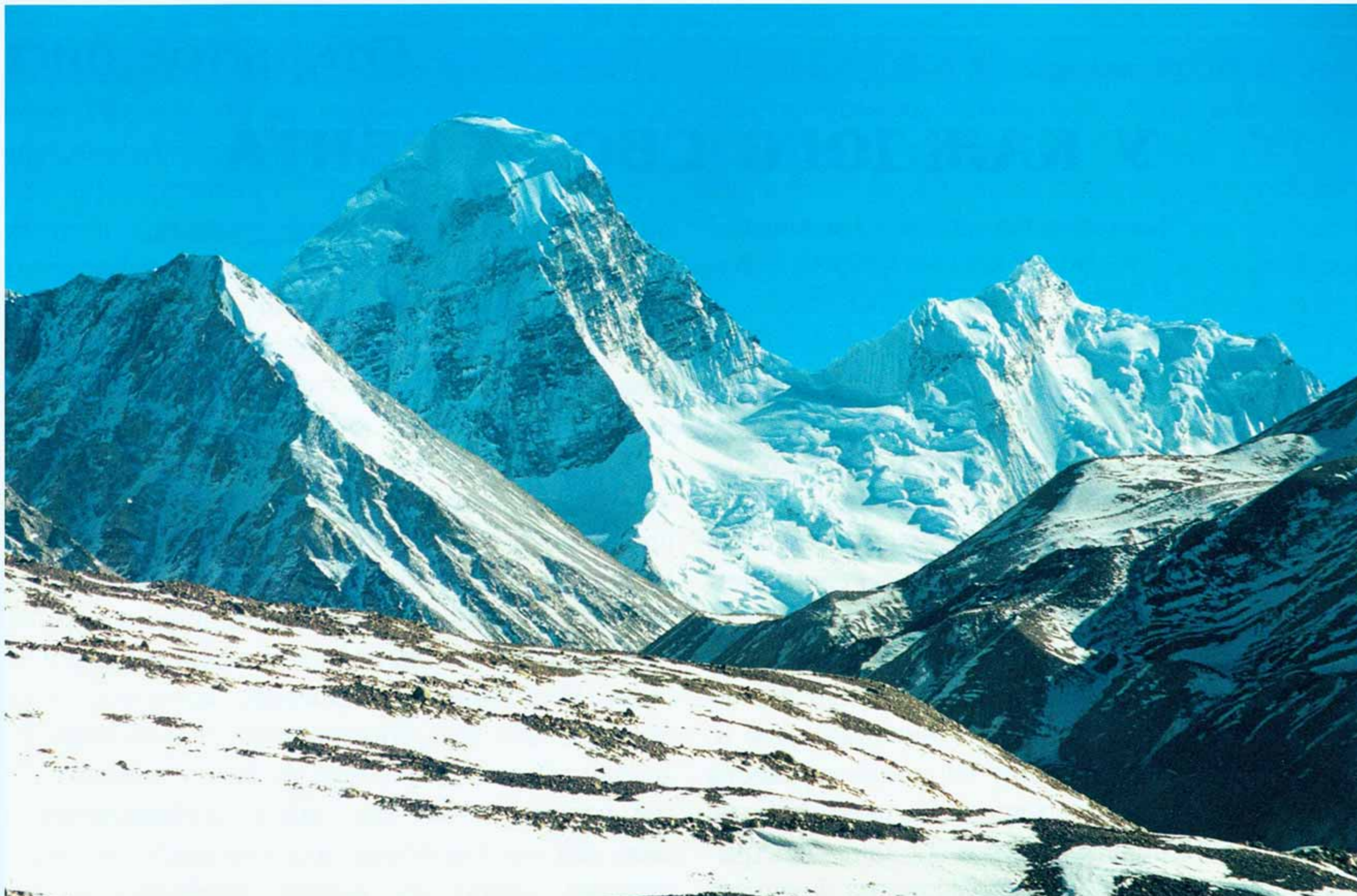
Пумори — «Сияющий пик». Тибет, Гималаи. 1998