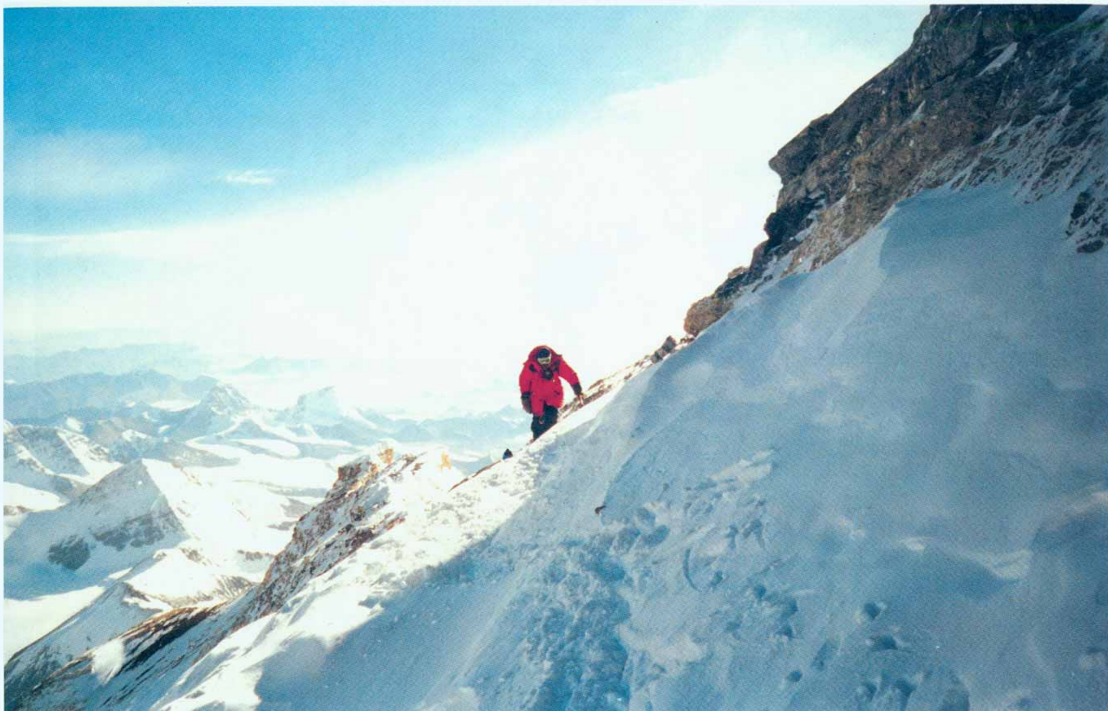
На северо-восточном гребне Эвереста (8550 м). На заднем плане — Тибетское нагорье. 1998