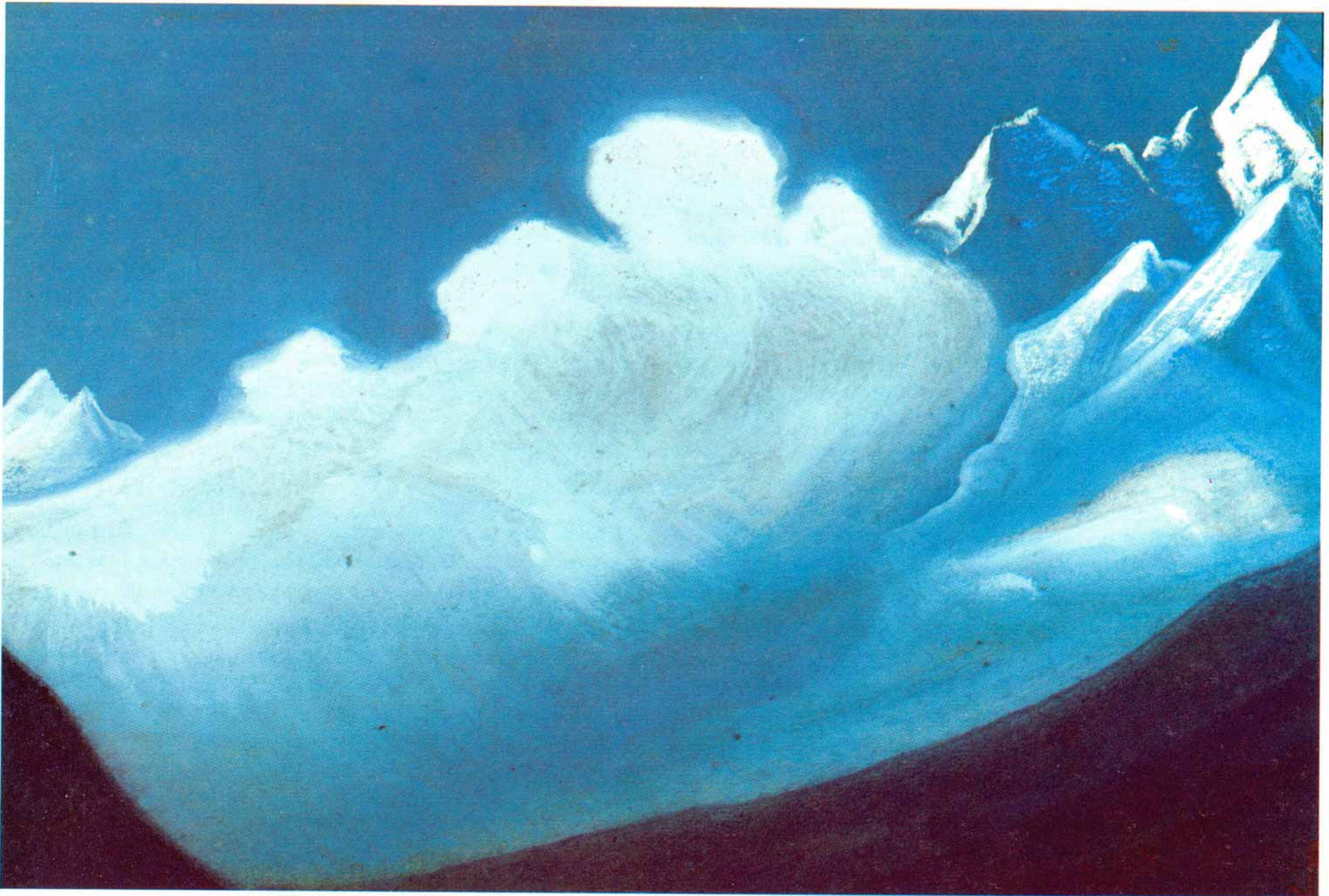
Н.К.Рерих. ОБЛАКО НА ВЕРШИНАХ. 1945