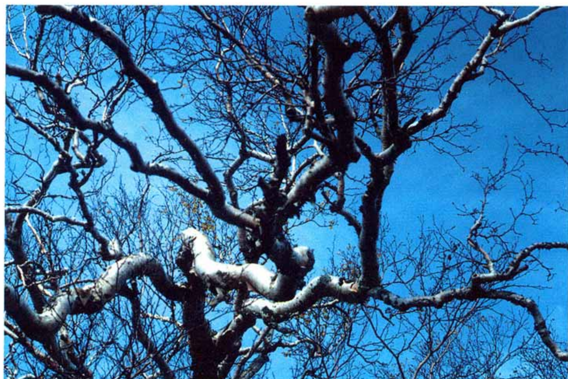
Камчатская каменная берёза