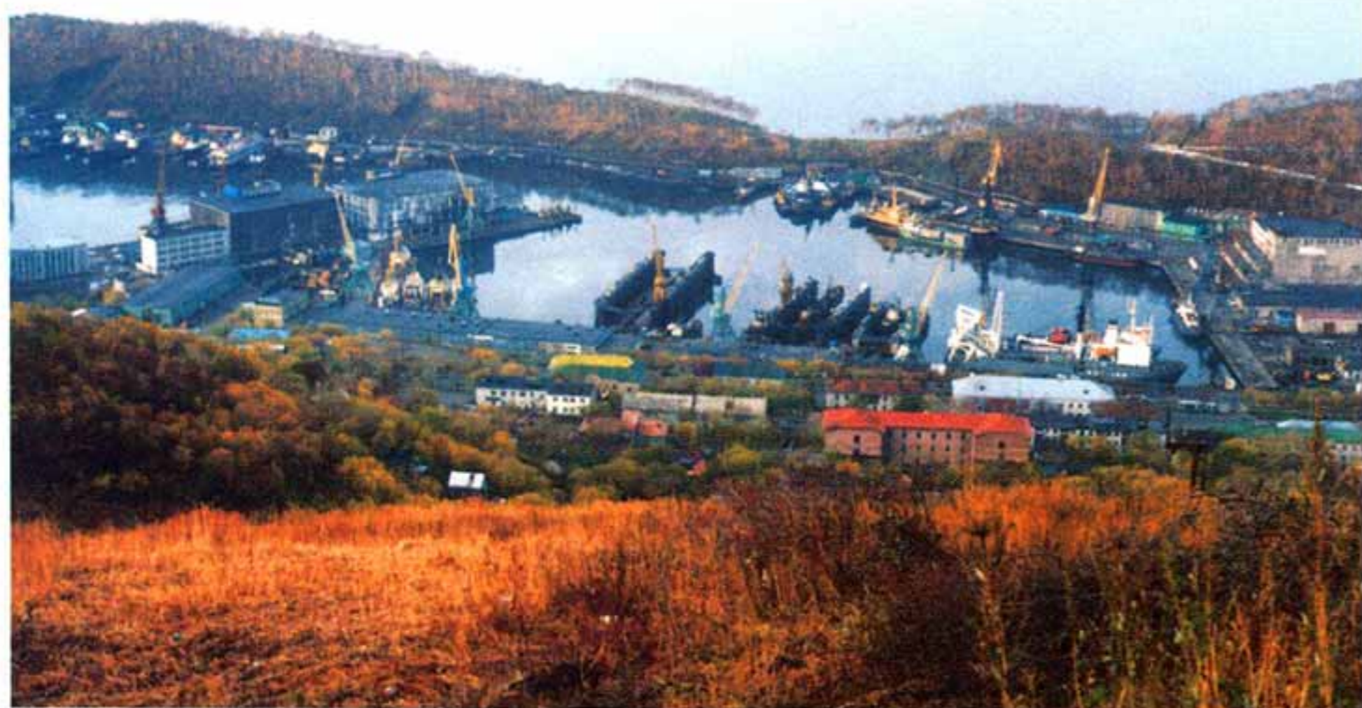
Морской порт. Петропавловск-Камчатский

И все, кто дерзает, кто хочет, кто ищет, Кому опостытели страны отцов, Кто дерзко хохочет, насмешливо свищет, Внимая заветам седых мудрецов!