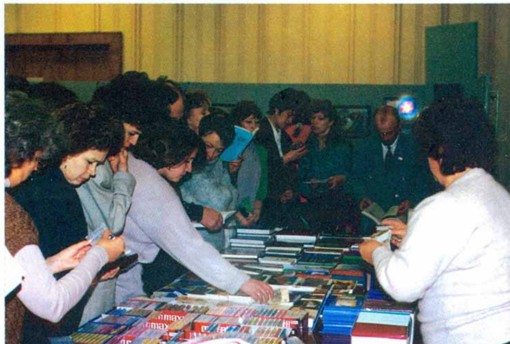
Книжный киоск Сибирского Рериховского Общества на конференции

Анализируя наследие Н.К. Рериха, всё время обращаешь к мысли, что его имя должно быть в ряду выдающихся учёных России, которые обладали синтезом научных знаний и философского мышления. Это, прежде всего, Владимир Иванович Вернадский, и я бы ещё назвал Николая Ивановича Вавилова, потому что и Н.К. Рерих, и его последователи в семье, и В.И. Вернадский, и Н.И. Вавилов — это были учёные, которые обладали способностью не только наработать фактуру, но и анализировать её с глобальных позиций. Вспомните о концепциях Вернадского, вспом-