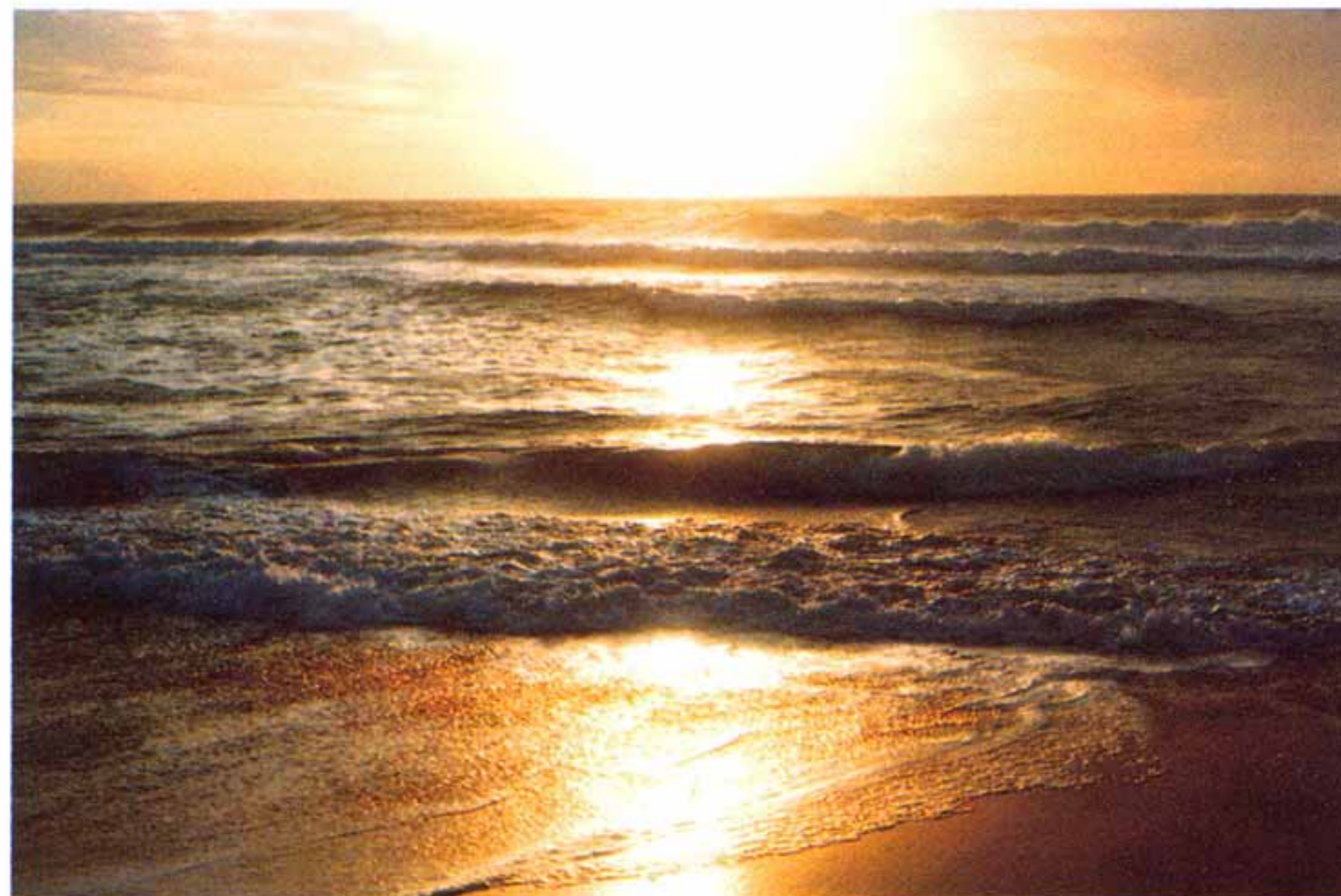
Великий Тихий океан

А вы, королевские псы, флибустьеры, Хранившие золото в тёмном порту, Скитальцы-арабы, искатели веры И первые люди на первом плоту!