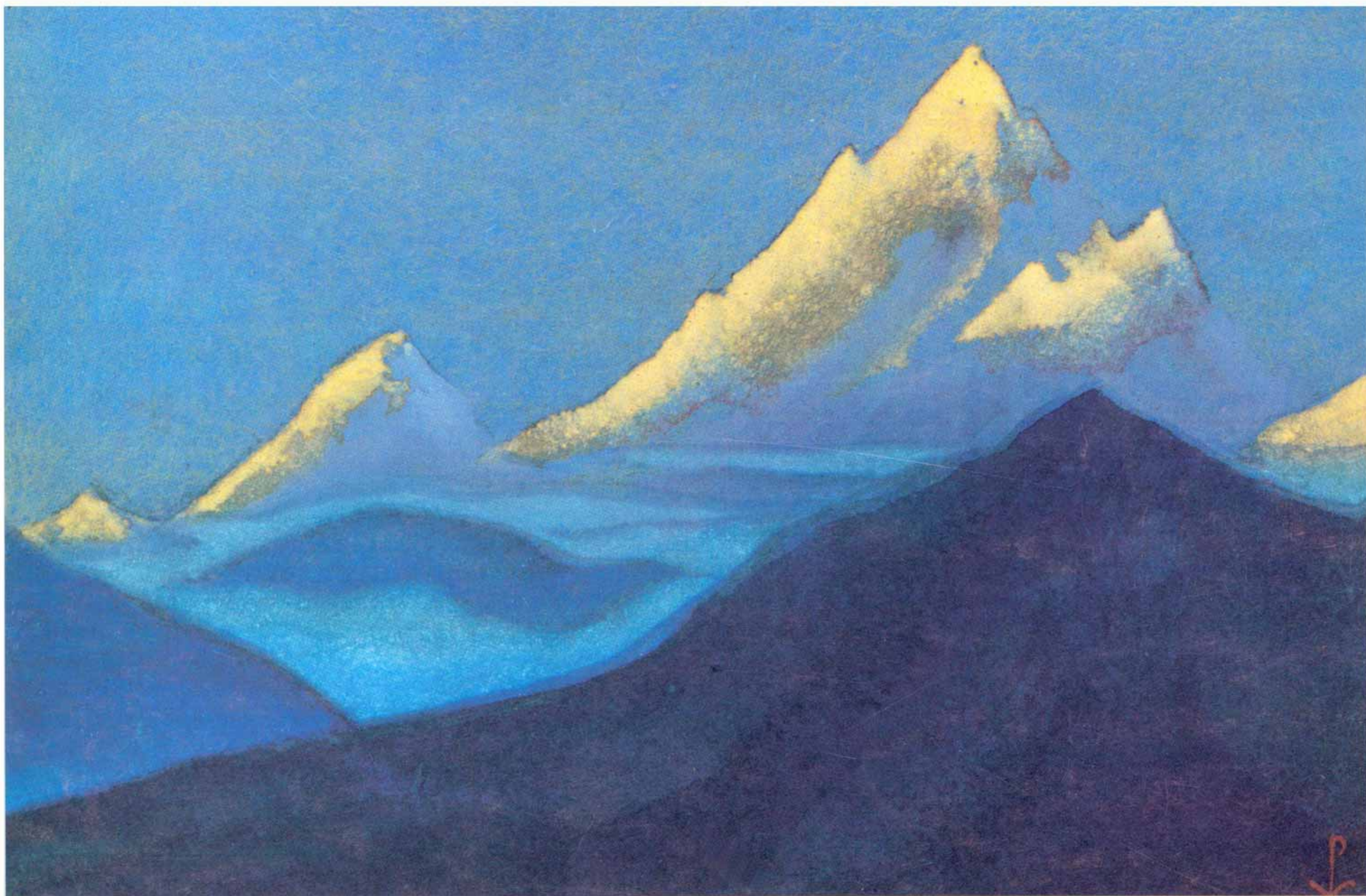
Н.К.Рерих. ГАСНУЩИЕ ВЕРШИНЫ. 1944