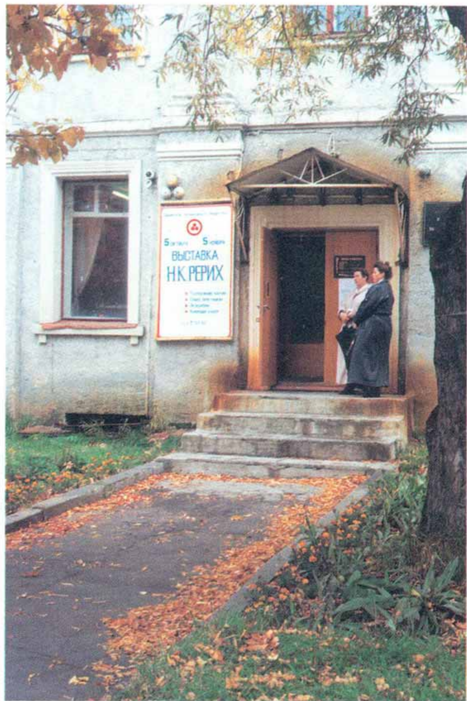
Областной выставочный зал. Петропавловск-Камчатский

празднование 300-летия присоединения Камчат- ки к России дало возможность провести в Петро- павловске-Камчатском нашу выставку и цикл ли- тературно-музыкальных слайдпрограмм о жизни и творчестве семьи Рерихов.