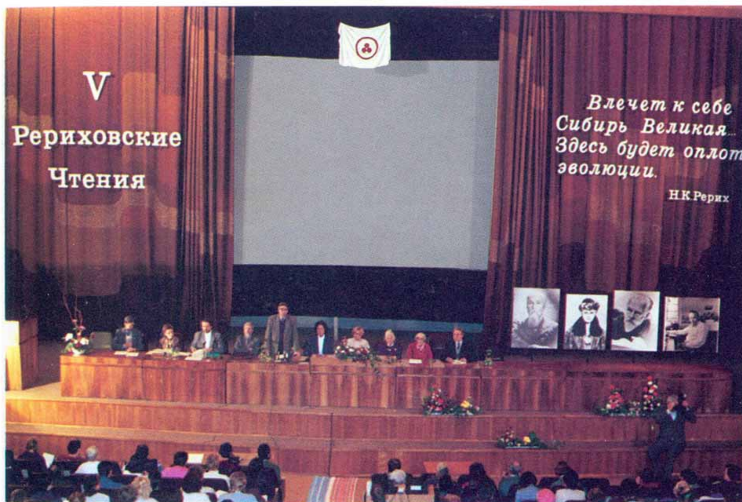
На открытии V Рериховских Чтений