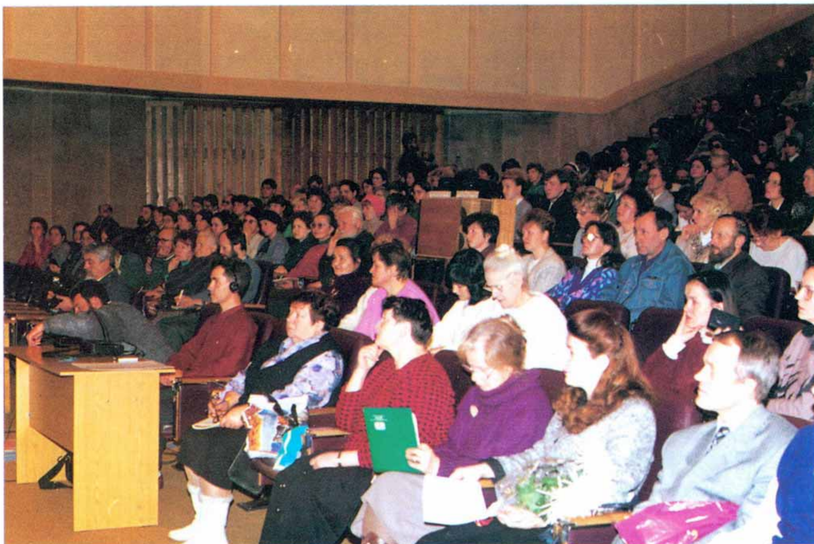
В зале во время работы конференции

Сибирское Рериховское Общество выражает сердечную благодарность руководству АОМТ «Авиакомпания Сибирь» и ОАО «Аэропорт Толмачёво», которые обеспечили бесплатный проезд учёных и общественных деятелей из Санкт-Петербурга, Москвы, Украины и Литвы на Пятые Рериховские Чтения.