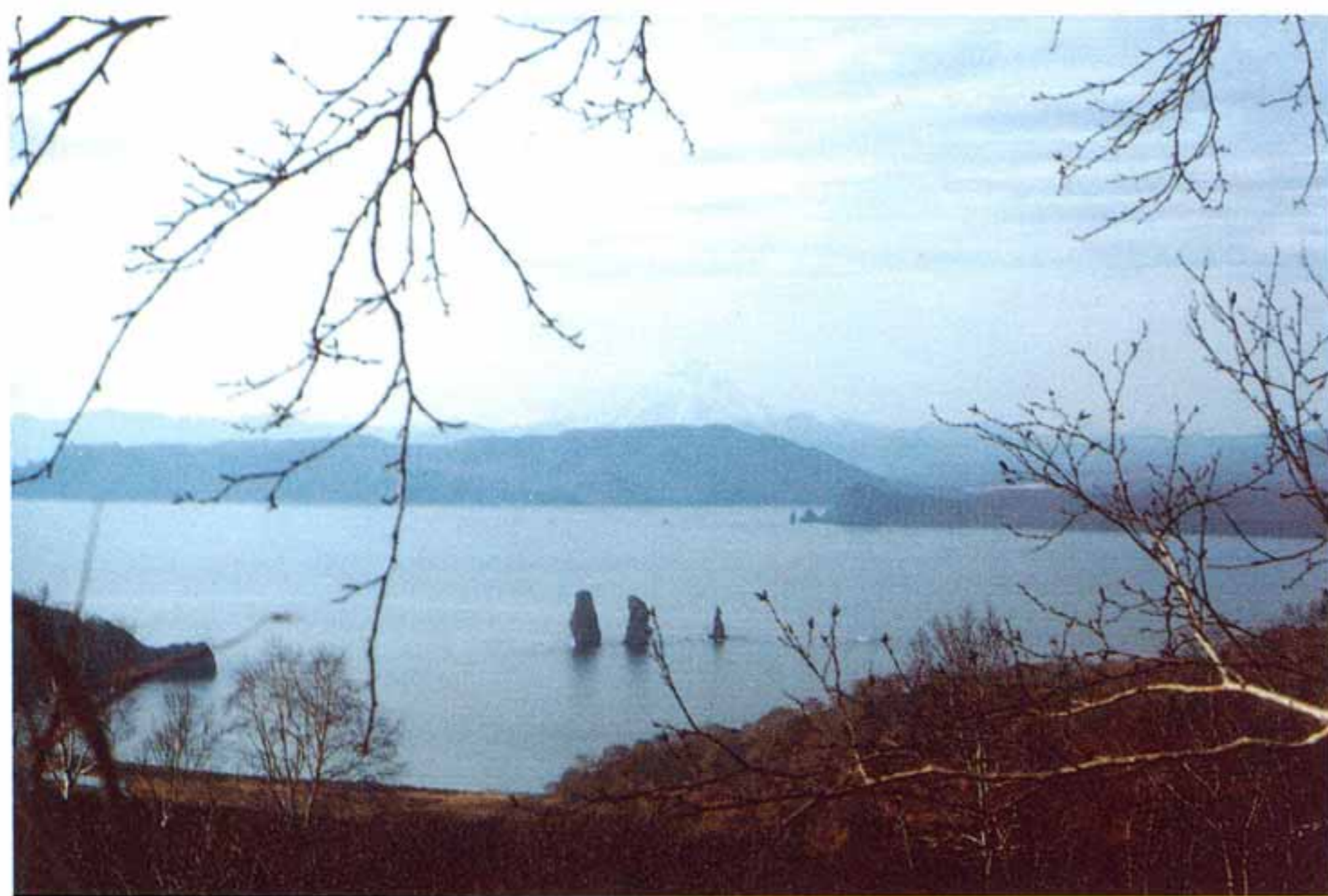
Вход в Авачинскую бухту. Скалы «Три брата»