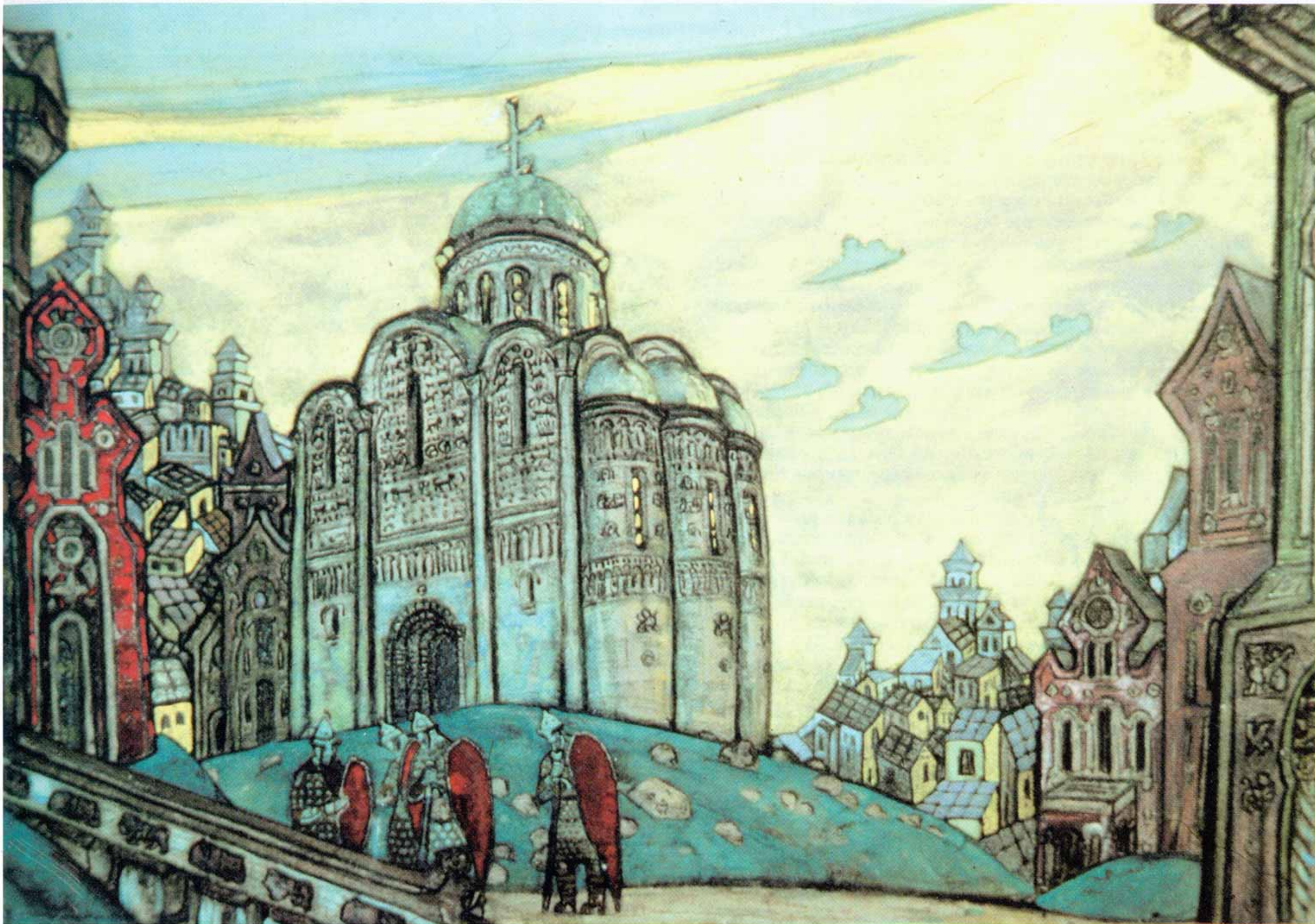
Н.К. Рерих. ПУТИВЛЬ. Эскиз декорации к опере А.П. Бородина «Князь Игорь». 1914