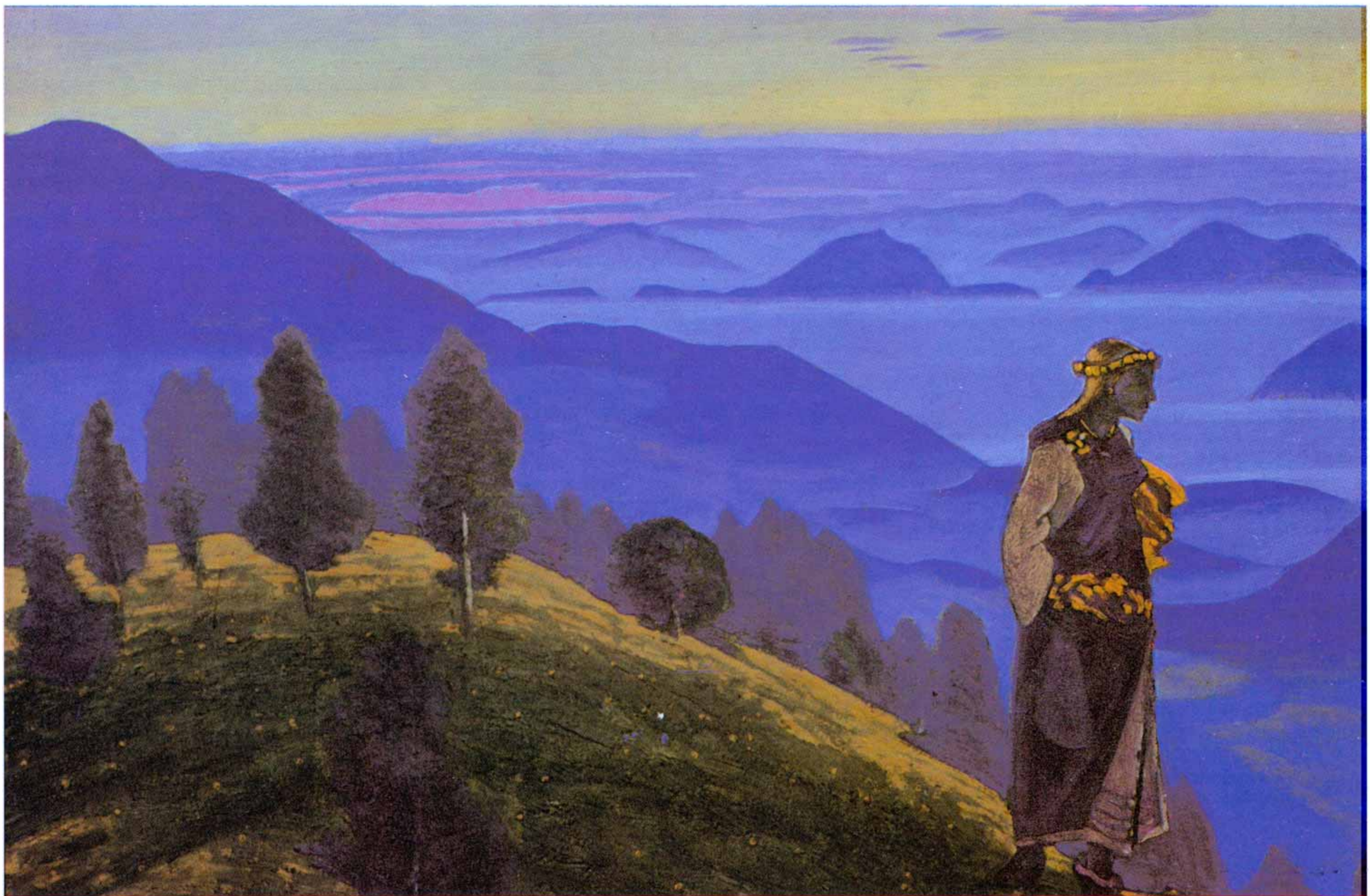
Н.К. Рерих. ДОЧЬ ВИКИНГА. 1910