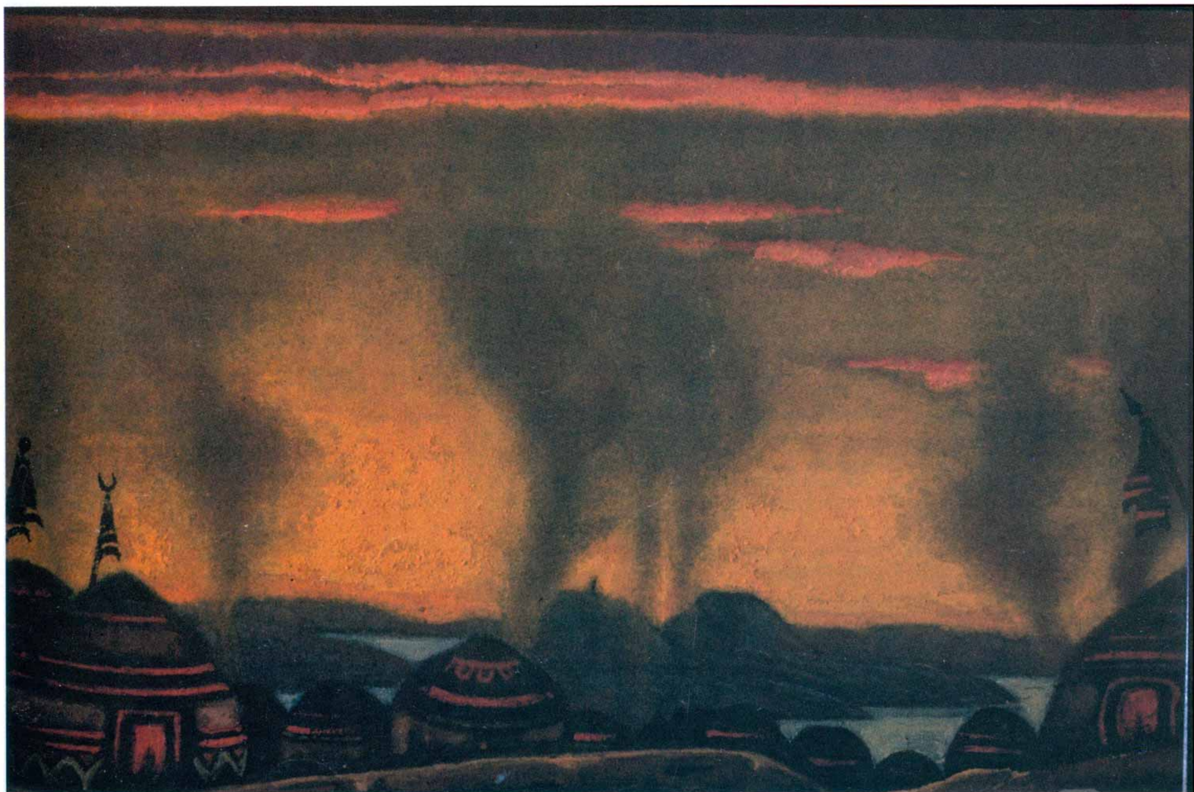
Н.К.Рерих. ПОЛОВЕЦКИЙ СТАН. Эскиз декорации к опере А.П. Бородина «Князь Игорь». 1944

Среди них были оперы Вагнера: «Кольцо Нибелунгов», «Мейстерзингеры», «Лоэнгрин», «Тангейзер», «Парсифаль»;